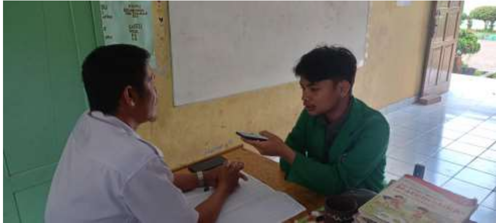
gambar 1.5 wawancara kedua dengan guru