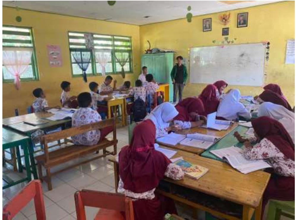
Gambar 1.7 suasana kelas VI