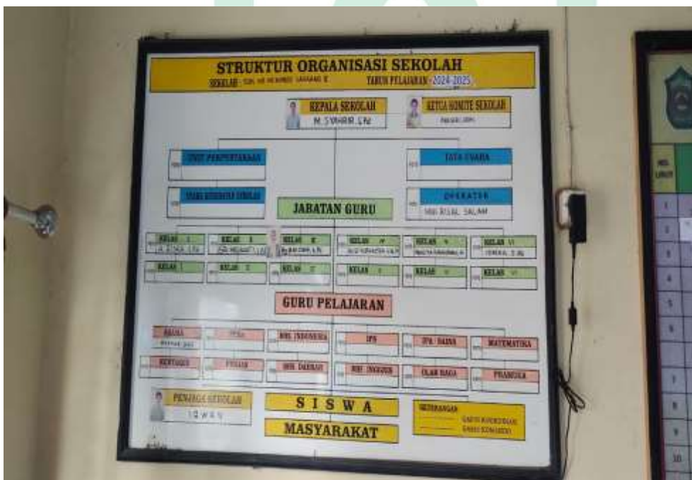
Gambar 2.0 papan struktur organisasi sekolah