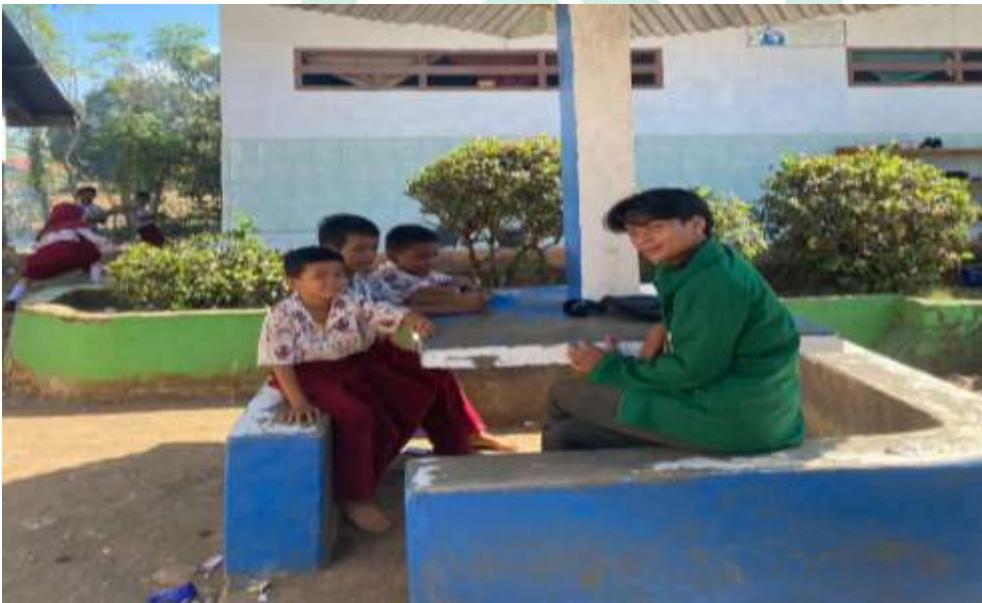
Gambar 1.2 wawancara dengan peserta didik