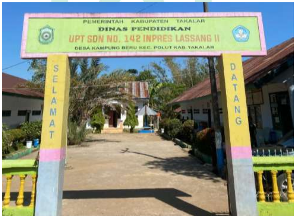
Gambar 1.8 pintu gerbang sekolah