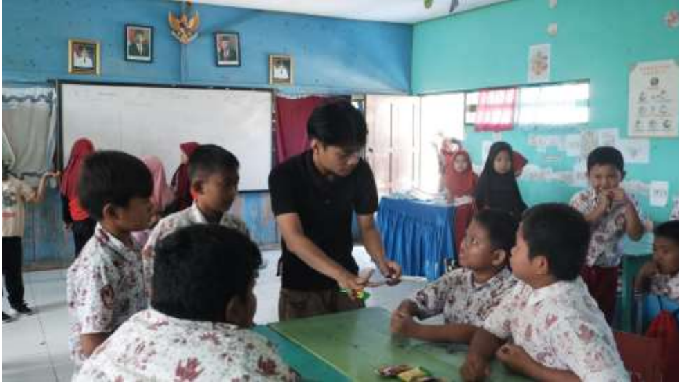
Gambar 1.1 observasi awal