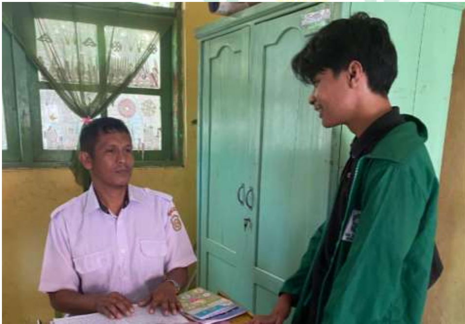
Gambar 1.4 wawancara dengan guru