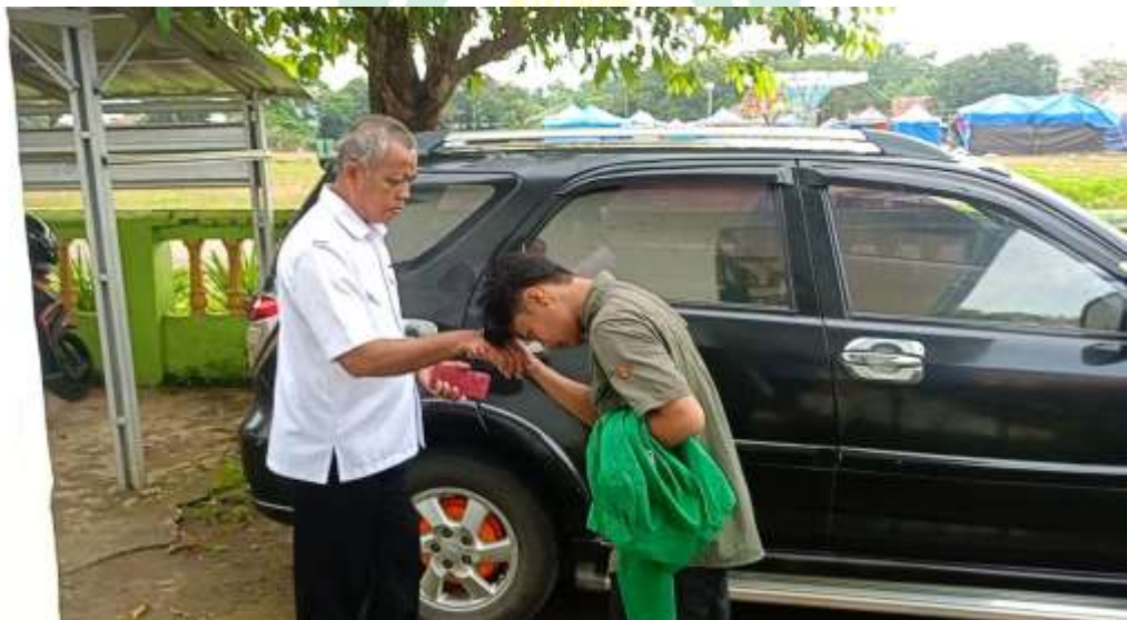
gambar 1.6 dokumentasi bersama kepala sekolah