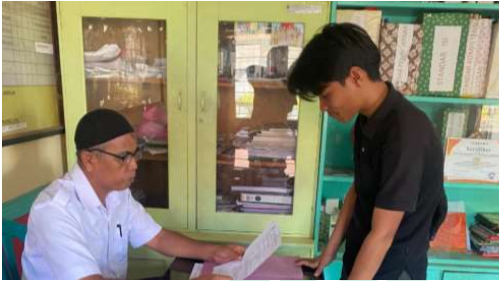
Gambar 1.3 wawancara dengan kepala sekolah