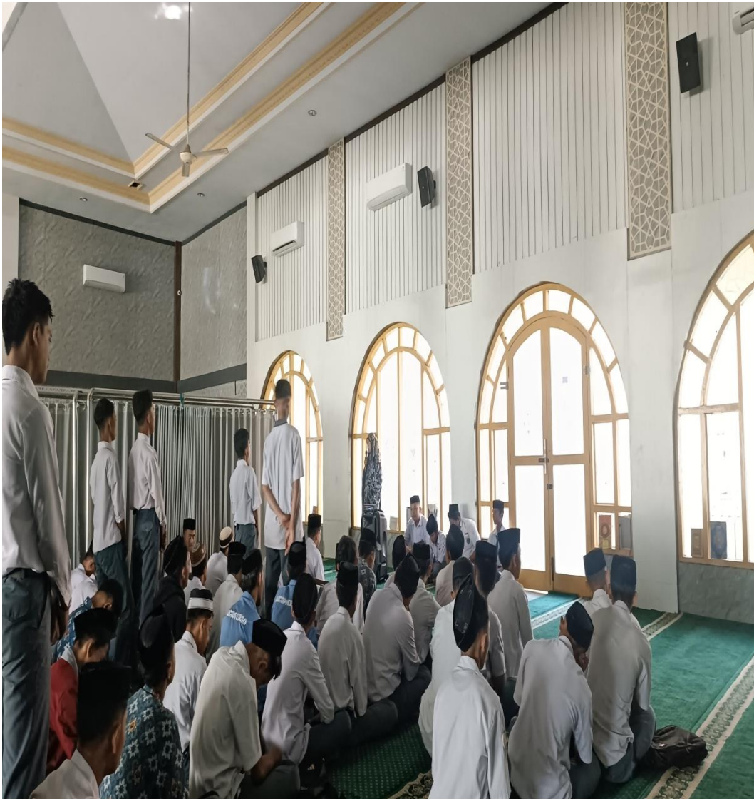
Kegiatan rutin setiap selesai salat dzuhur, setiap hari Senin dan Rabu