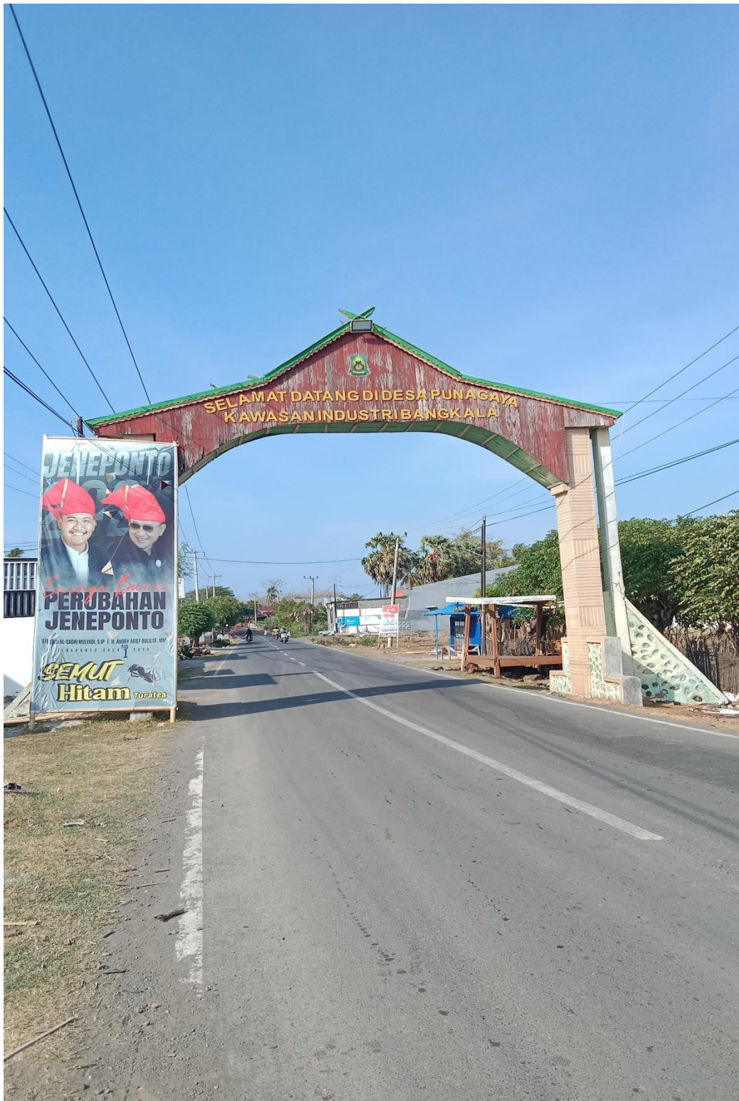
Desa Punagaya, Kecamatan Bangkala, Kabupaten Jeneponto.