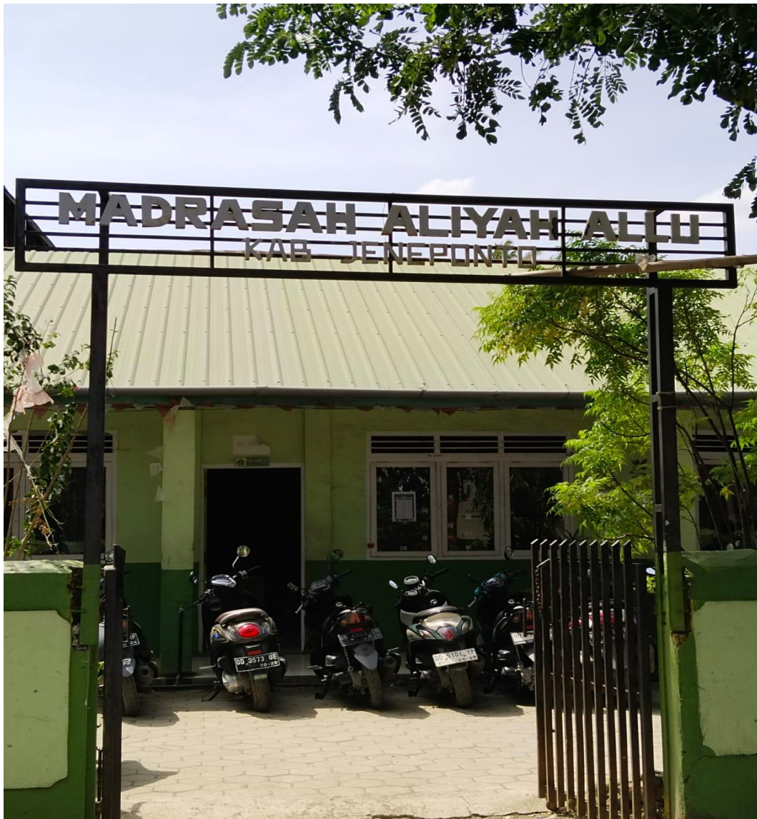
Madrasah Aliyah Allu