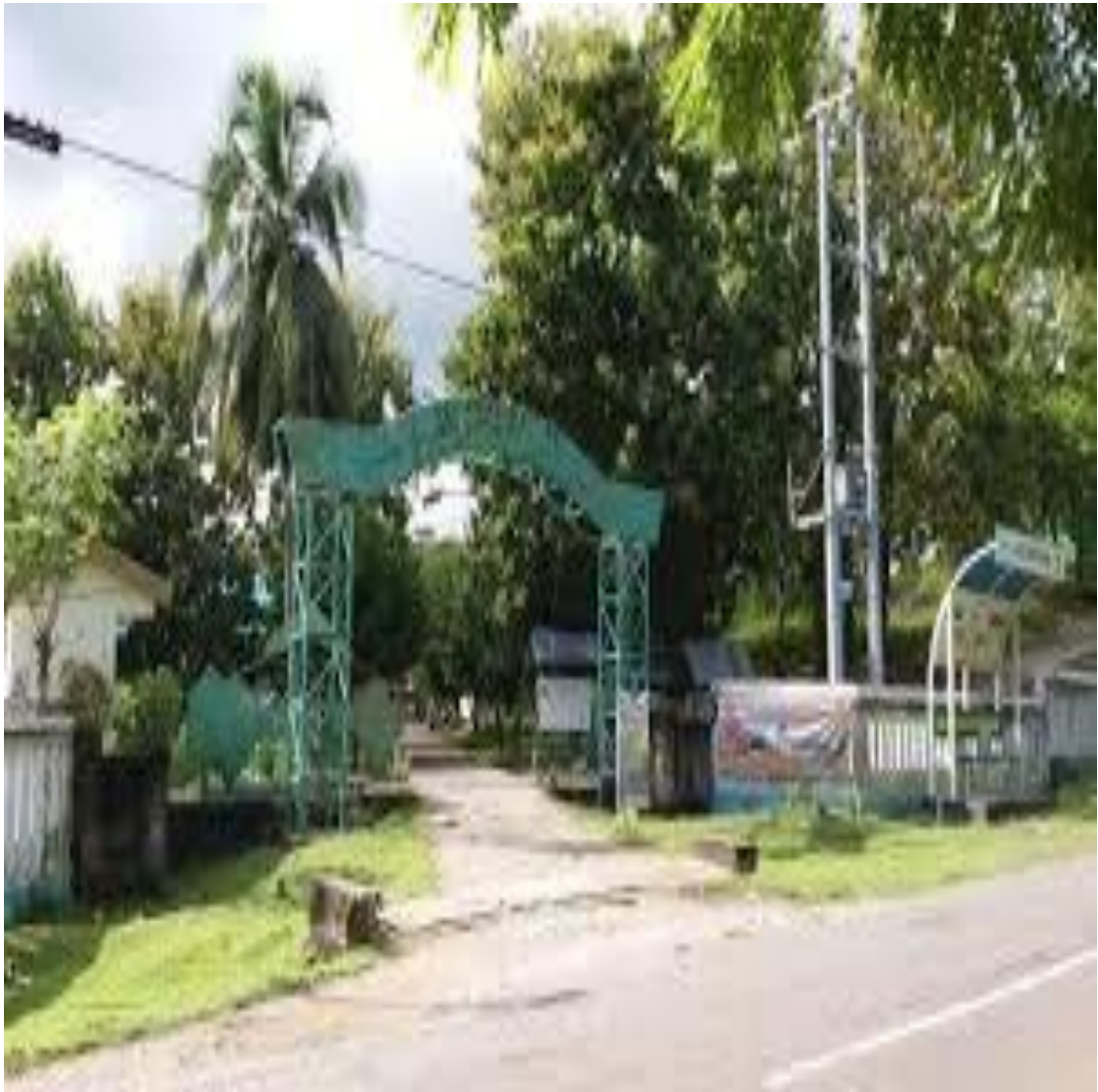
Pintu Gerbang Pondok Pesantren Al-Qur'an Babussalam Al-Muchtariyah Kecamatan Bontoharu Kabupaten Kepulauan Selayar