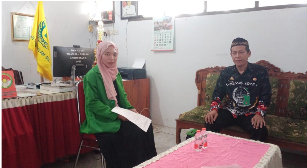
Kepala Sekolah SMA Abd. Jabbar S.Pd.