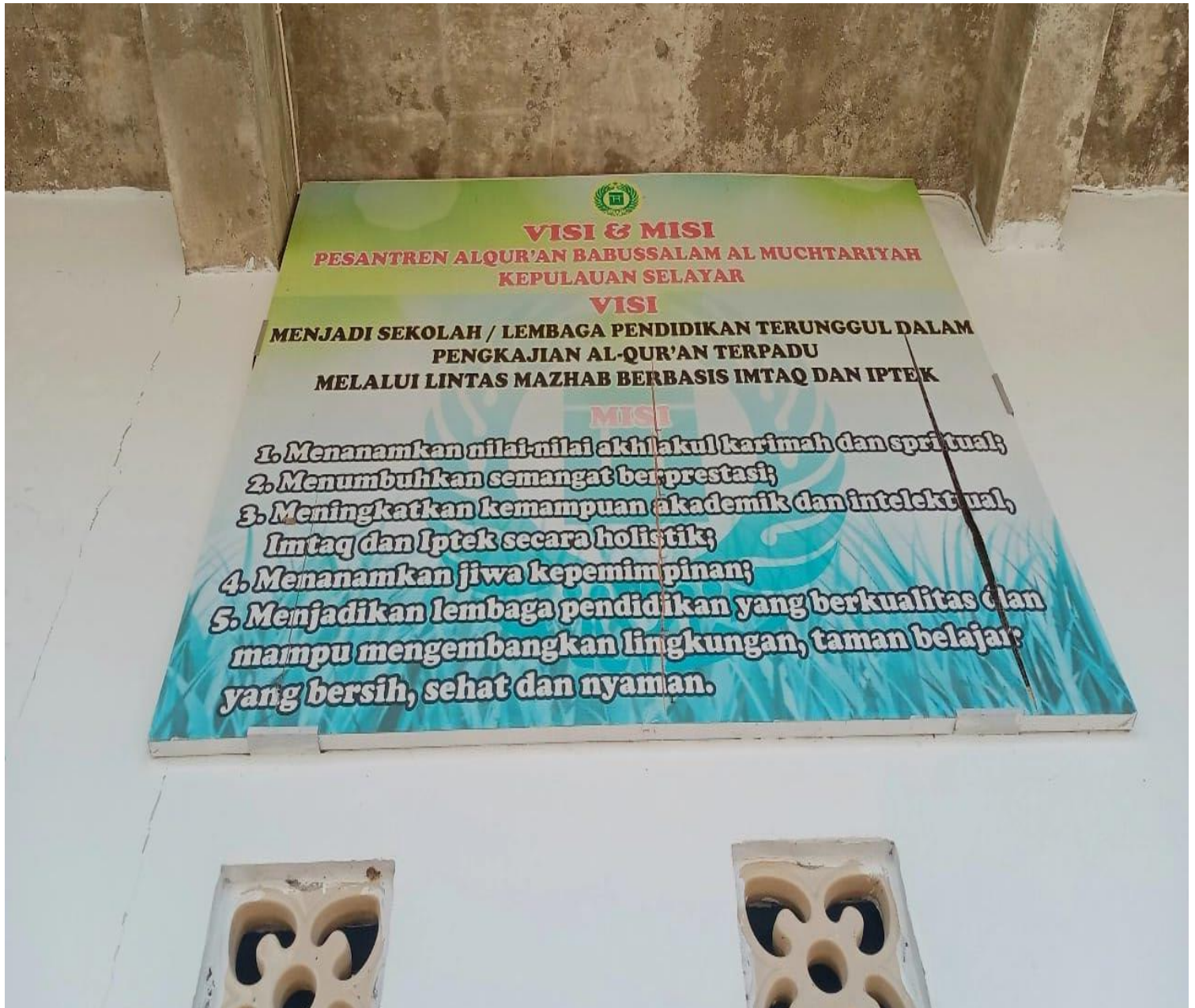
Visi Misi Pondok Pesantren Babussalam