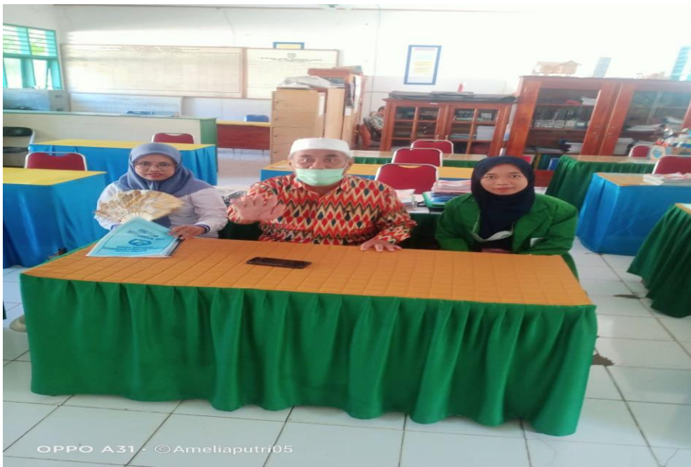
Kepala Sekolah SMP