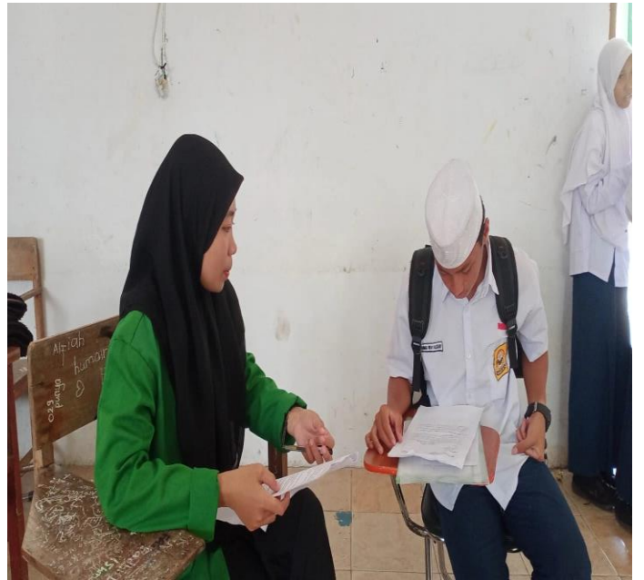
Wawancara dengan Peserta Didik SMP