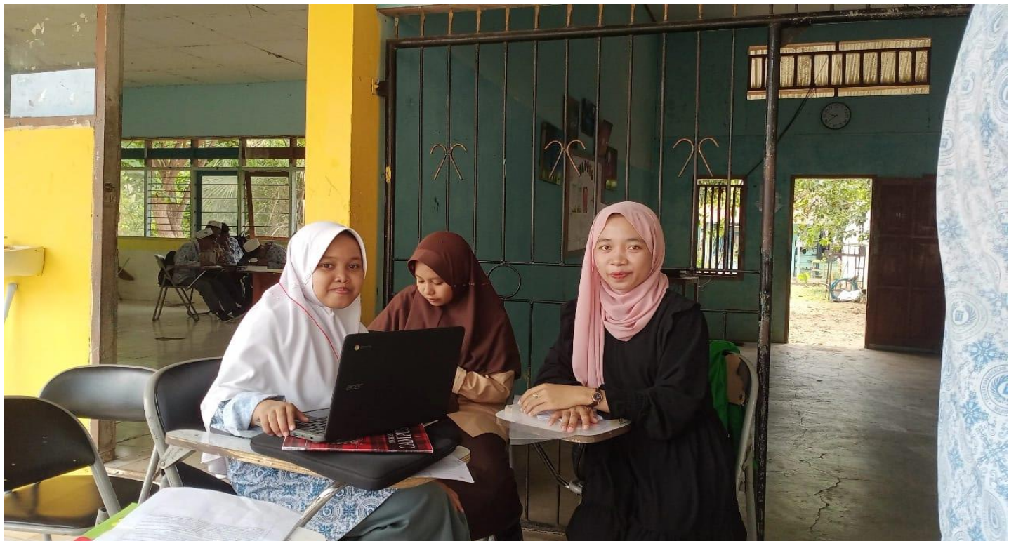
Wawancara dengan Peserta Didik SMA