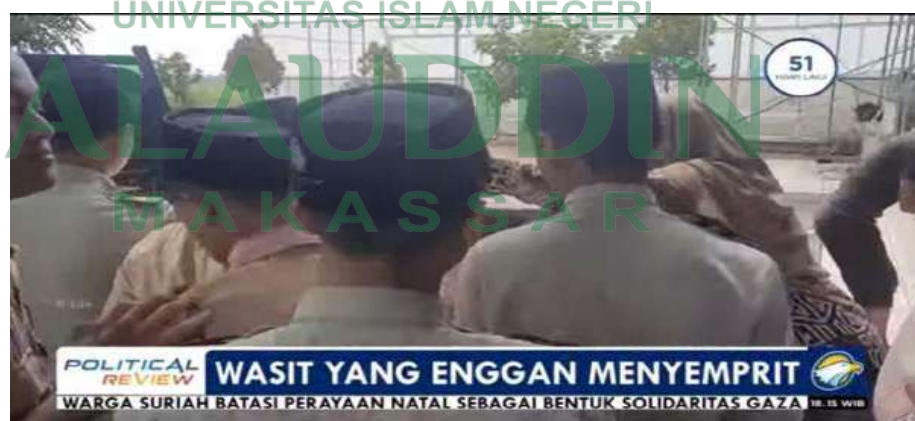
Gambar 4.4 Santri Mengambil Makan Siang Gratis dari Tim Prabowo-Gibran

Penggalan video tersebut merekonstruksikan aksi yang dilakukan oleh tim dari paslon Prabowo-Gibran dalam membagikan susu secara gratis di salah satu pondok pesantren. Penggalan video dari pemberitaan Metro Tv mengenai isu politik tersebut terdapat detail yang ditayangkan secara jelas oleh Metro Tv yang sejalan dengan apa yang dibacakan oleh narator pada naskah pemberitaan tersebut, yaitu terpampang dengan jelas spanduk yang bergambar kartun animasi Prabowo-Gibran di depan para santri yang tengah mendengarkan pembicara dari tim Prabowo-Gibran. Selanjutnya, grafis yang disajikan dalam bentuk cuplikan video pada pemberitaan Prime Time News Metro Tv mengenai aksi bagi-bagi makanan gratis di salah satu pondok pesantren sebagai berikut.