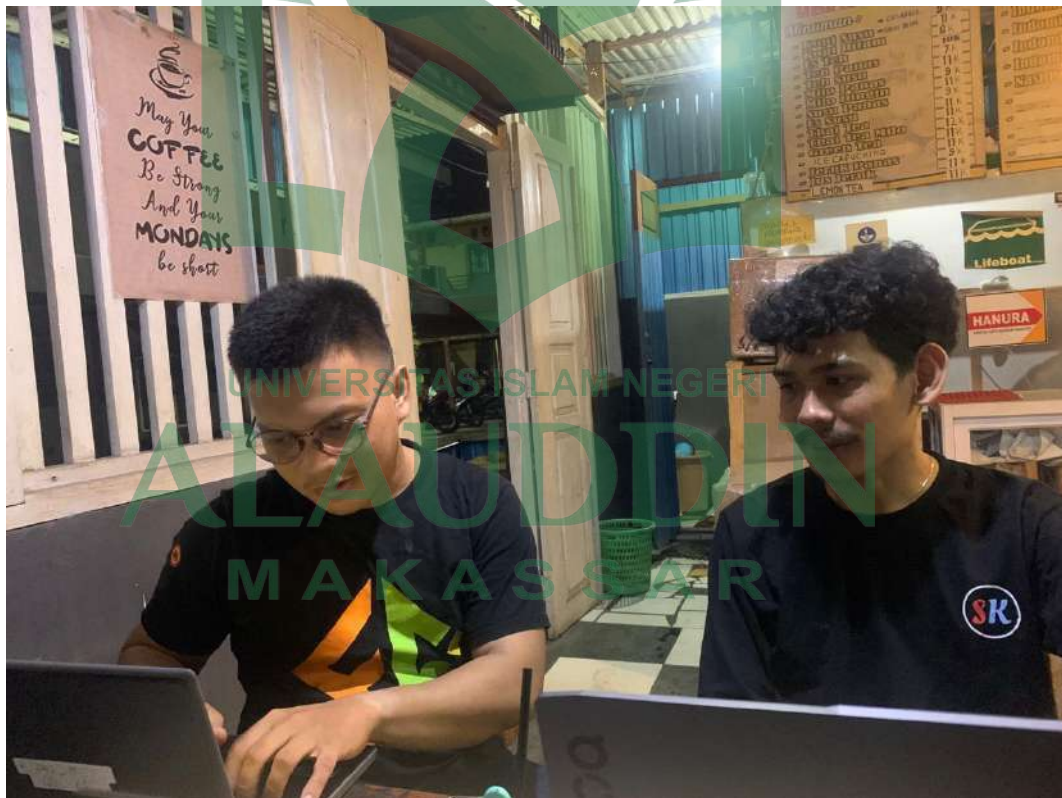
WAWANCARA DENGAN INFORMAN FS