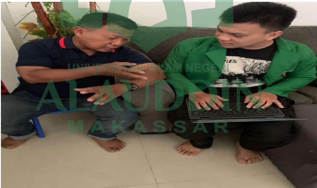
WAWANCARA DENGAN INFORMAN MB