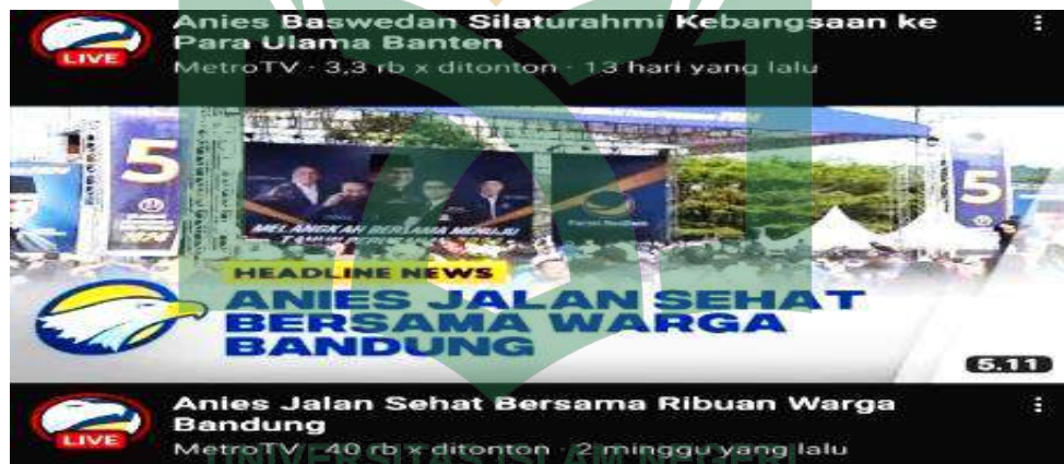
Gambar 1.1 Berita Salah Satu Program Kampanye Anies Baswedan yang diberitakan oleh Metro Tv

Pada kontestasi Pemilu 2024, Partai Nasdem kembali berpartisipasi. Partai Nasdem telah mendeklarasikan Anies Baswedan sebagai Calon Presiden RI usungannya di Nasdem Tower pada 3 Oktober 2022 lalu. 7 Beberapa berita terkait tentang Anies Baswedan terus bermunculan setelah pendeklarasiannya sebagai calon presiden usungan Partai Nasdem, seperti gambar berikut yang menggambarkan pemberitaan Metro Tv terhadap kampanye Anies Baswedan.