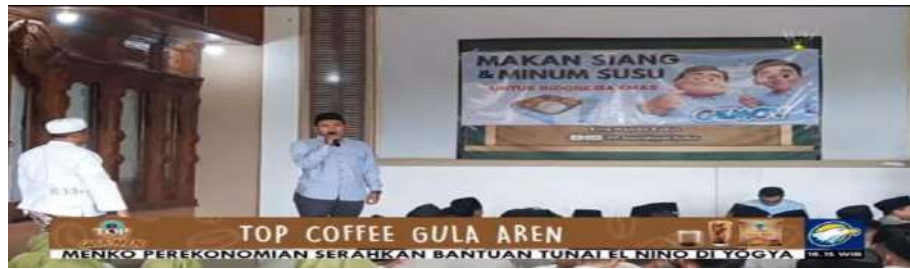
Gambar 4.3 Aksi Kampanye Bagi-bagi Susu serta Makan Siang Gratis Paslon Prabowo Gibran Di Ponpes