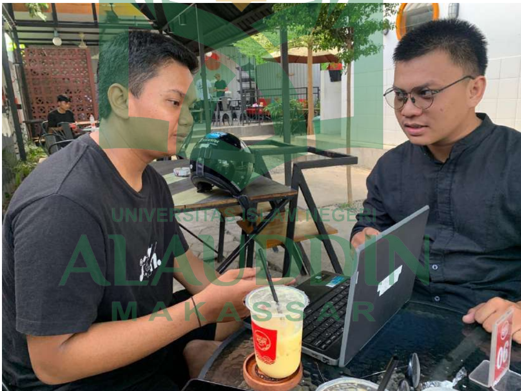
WAWANCARA DENGAN INFORMAN MS