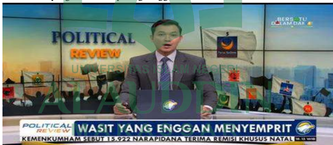
Gambar 4.1 Pembacaan Naskah Lead Berita oleh News Anchor pada Segment Political Review Primetime News Metro Tv

Data pertama merupakan pemberitaan diambil dari tayangan program prime time news yang merupakan program berita utama Metro Tv, program tersebut ditayangkan selama petang hingga malam hari.