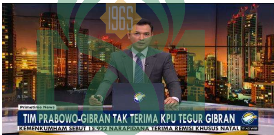
Gambar 4.5 Pembacaan Lead Berita oleh News Anchor pada Program Prime Time News Metro Tv

Data kedua diambil pada program Prime Time News Edisi 24 Desember 2023. Sajian data dan penjelasan dari hasil interpretasi yang didasari pada analisis wacana kritik model Van Dijk, yaitu sebagai berikut: