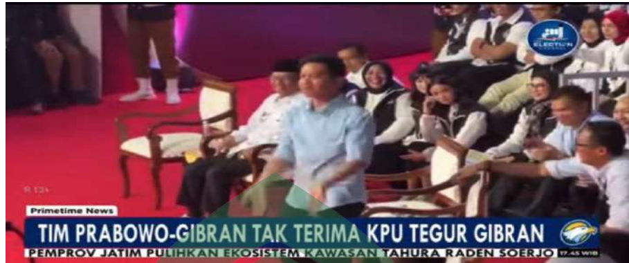
Gambar 4.6 Aksi Angkat Tangan Gibran Saat Debat Capres Pertama

Sumber: Prime Time News Metro Tv Edisi 24 Desember 2023 Pukul 17.45