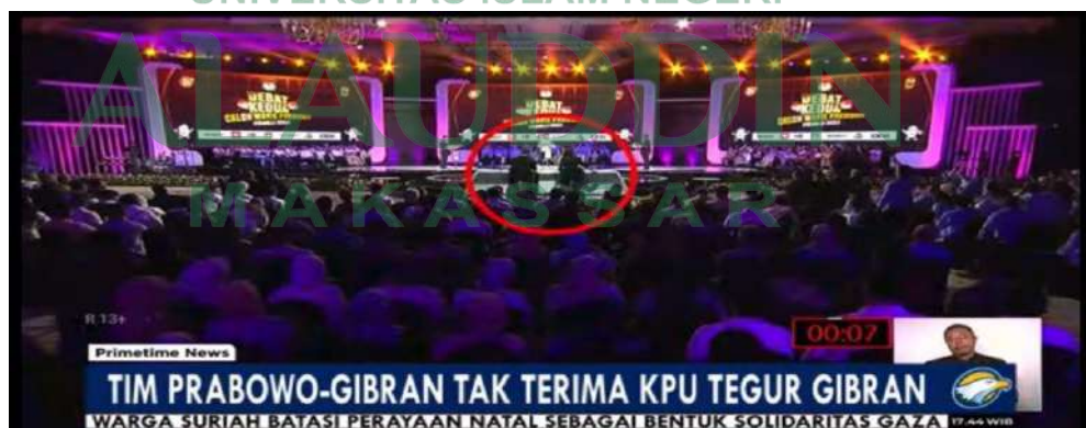
Gambar 4.7 Aksi Angkat Tangan Gibran Saat Debat Cawapres Pertama