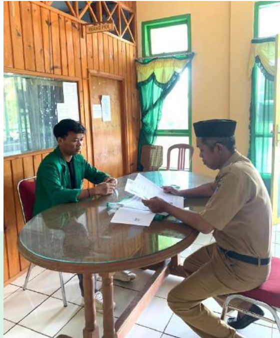
Wawancara Bapak Camat Kecamatan Curio