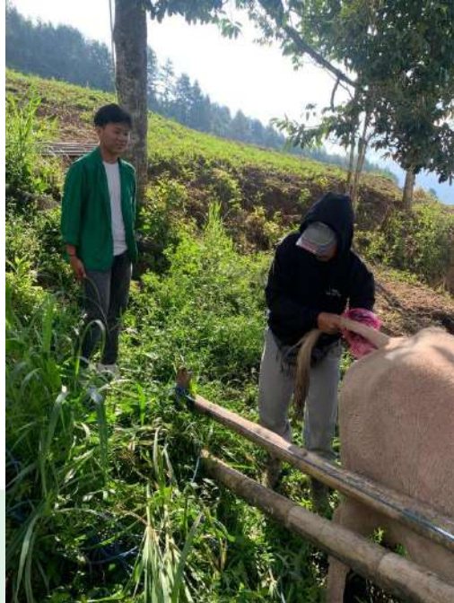
Wawancara, Pelaksanaan dan Praktek Jual Beli Sperma Ternak Kerbau