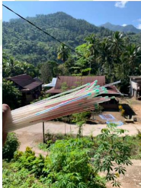
Alat Kawin Suntik Inseminasi Buatan