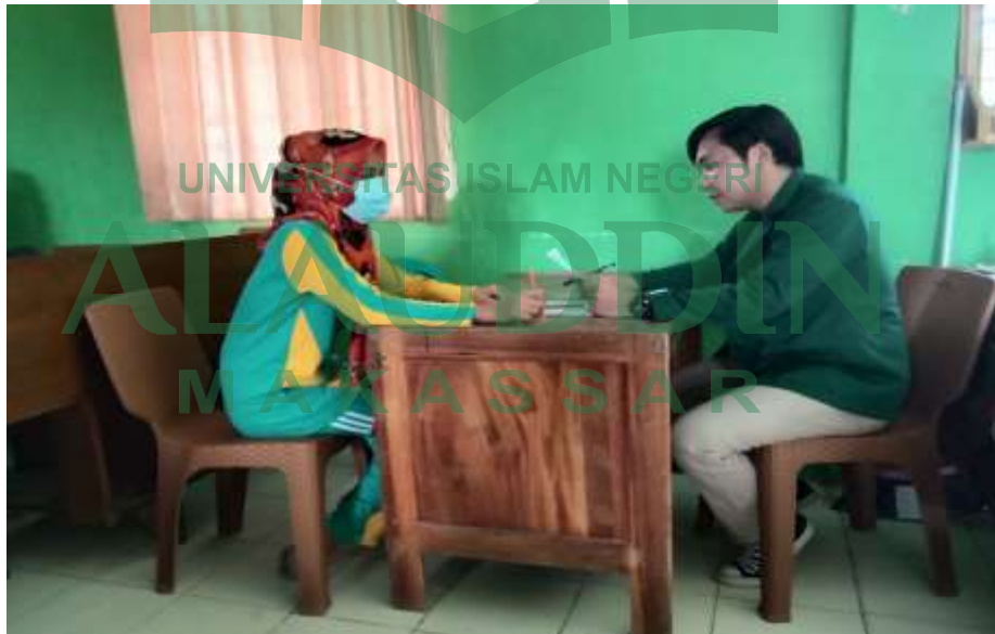
Wawancara Peneliti dengan Guru