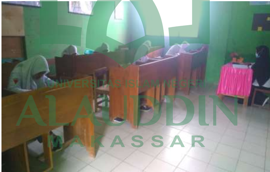
Proses Belajar Mengajar di MA Al Wasilah Lemo