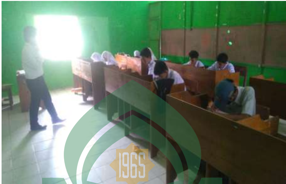
Proses Belajar Mengajar di MA Al Wasilah Lemo