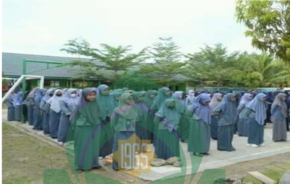
Upacara Peringatan Hari Guru Nasional