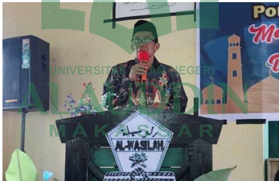
Kunjungan Kemenag Polewali Mandar