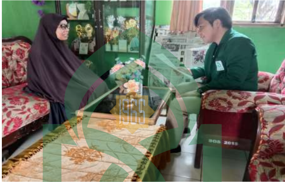
Wawancara Peneliti dengan Kepala Madrasah

Madrasah Aliyah (MA) Al Wasilah Lemo, Kabupaten Polewali Mandar