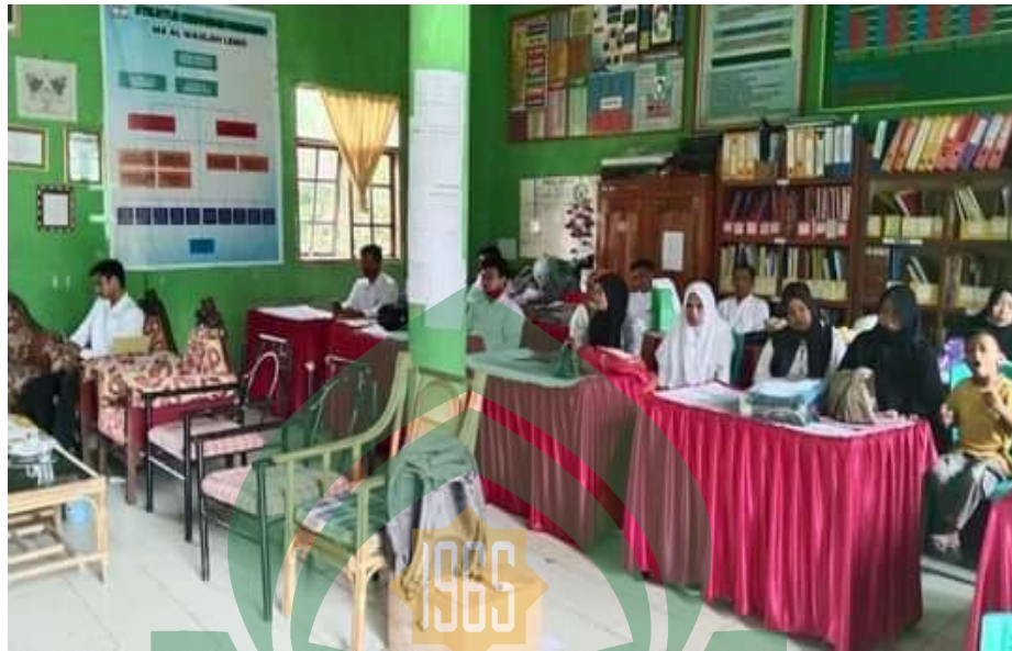
Rapat Guru MA Al Wasilah Lemo