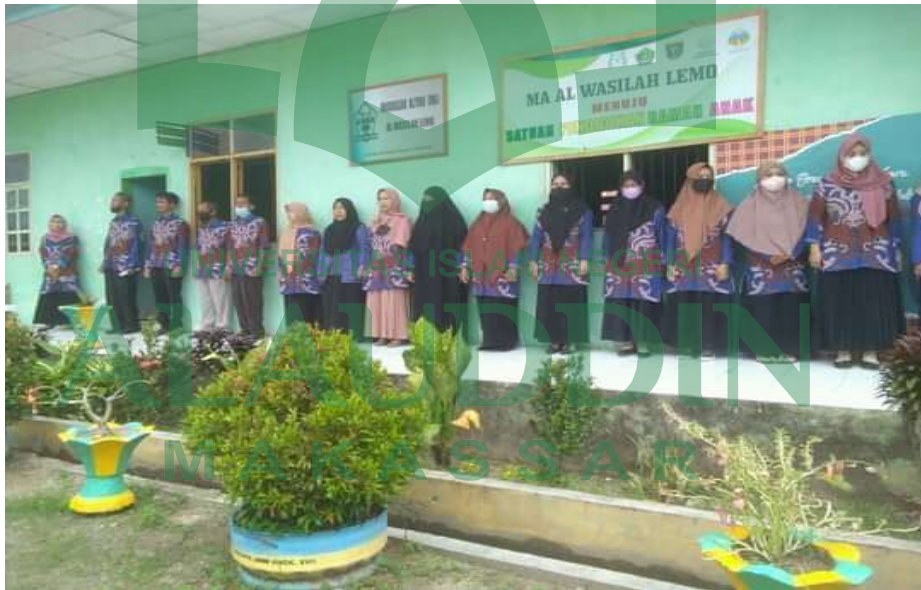
Peringatan Hari Guru Nasional