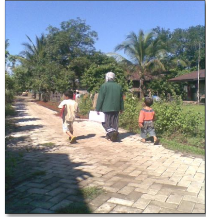
Menuju ke rumah responden