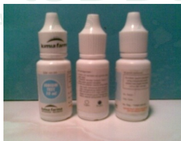
Gambar 5.5 Iodina test

Ketersediaan garam beryodium di rumah tangga dapat diketahui dari wawancara dan identifikasi langsung dengan melakukan uji iodina pada garam masing-masing responden.