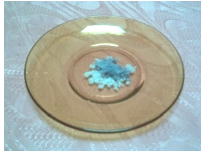
Gambar 5.1 (garam curai/krosok/kasar) berwarna ungu tua