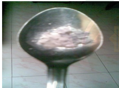
Gambar 5.3 berwarna ungu muda/pucat