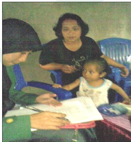
Wawancara langsung dengan responden (Ibu Rumah Tangga)