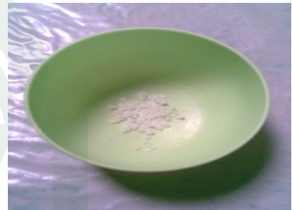
Gambar 5.4 tidak berubah warna

Dari hasil uji tersebut diperoleh data sebagai berikut: