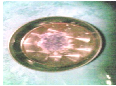
Gambar 5.2 (garam halus) berwarna ungu tua