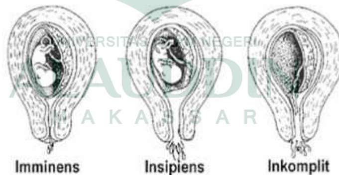
Gambar 1. Abortus Imminiens, Insipiens dan Inkomplit (Sumber : Artikel Kedokteran,2012)

Merupakan pengeluaran hasil konsepsi pada kehamilan sebelum 20 minggu dengan masih ada sisa yang tertinggal di dalam kavum uteri.