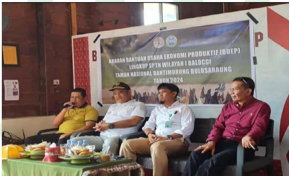
(Dokumentasi kepala desa dalam rapat penyaluran bantuan kepada masyarakat)