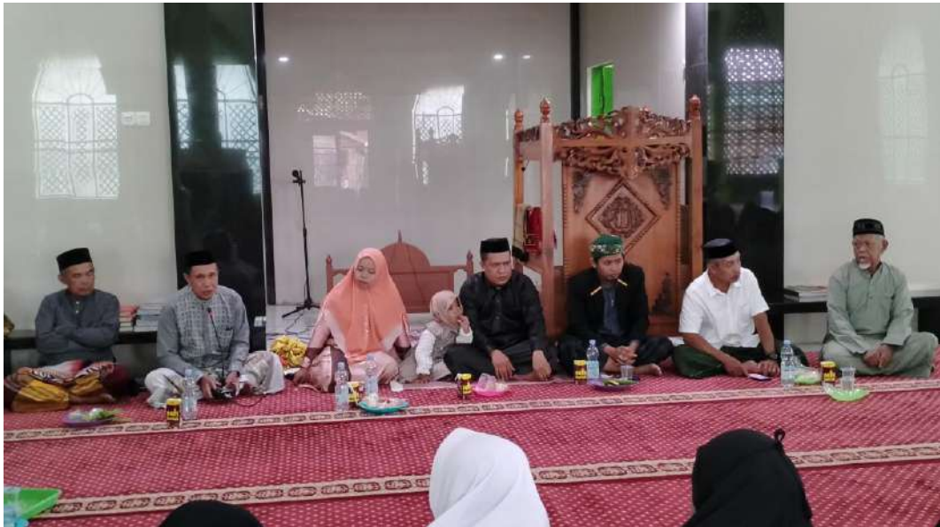
(Dokumentasi kepala desa dengan ibu-ibu pengajian majelis taklim)