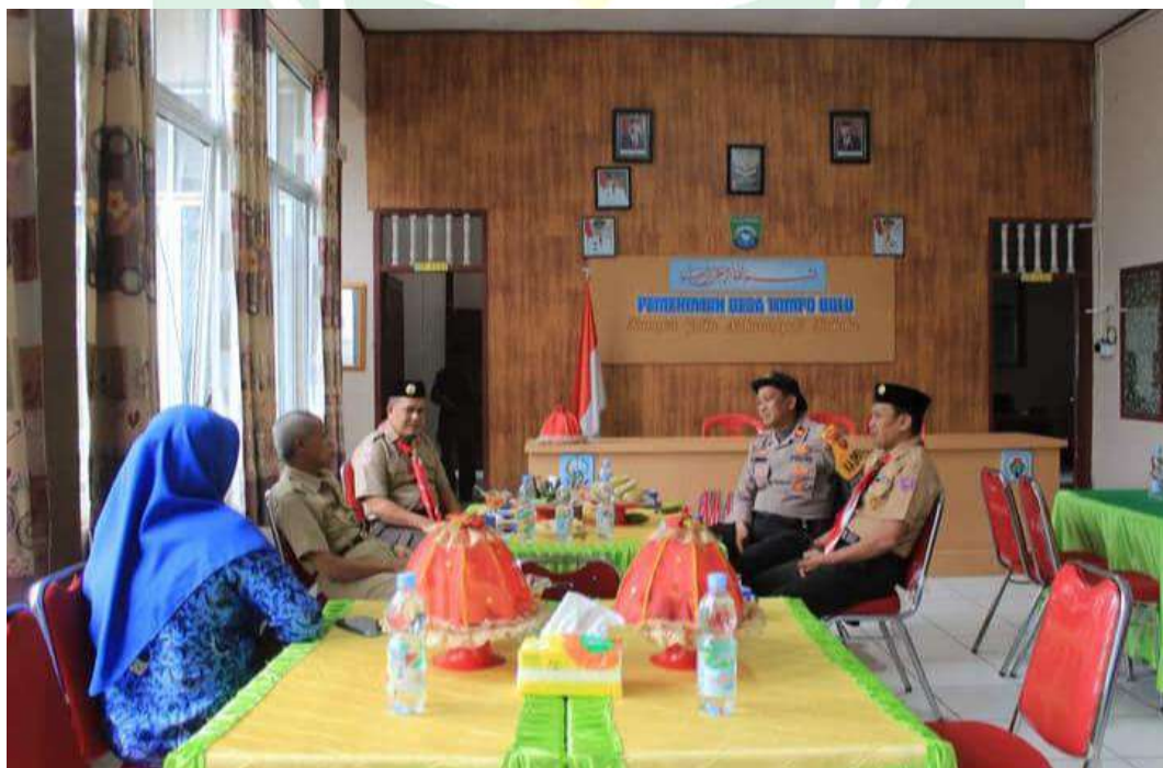
(Dokumentasi komunikasi kepala desa dalam mendukung kegiatan pramuka di desa Tompo Bulu)