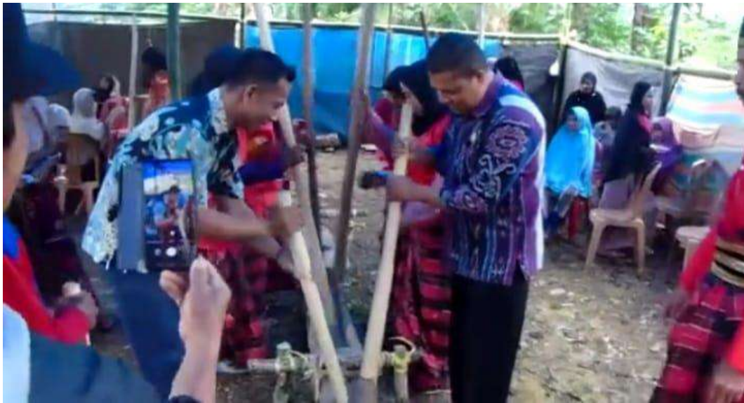
(Dokumentasi bentuk dukungan kepala desa terhadap budaya masyarakat)