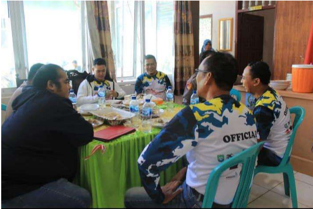
(Dokumentasi kepala desa dalam rapat pembahasan pembangunan Desa Tompo Bulu)