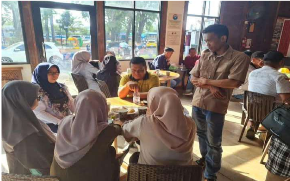
(Dokumentasi kegiatan pengelolaan pengembangan usaha masyarakat dibidang pariwisata)