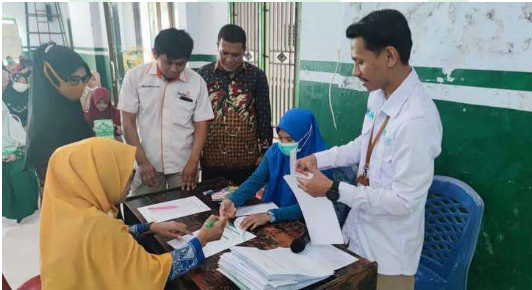
(dokumentasi kepala desa terhadap kegiatan masyarakat)