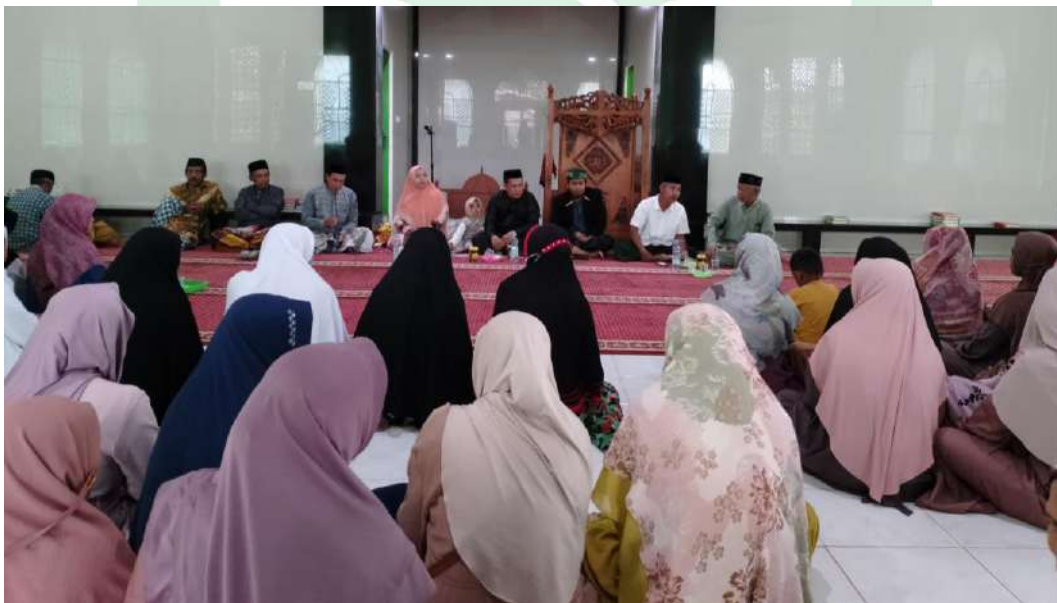
(Dokumentasi kepala desa dengan ibu-ibu pengajian majelis taklim)