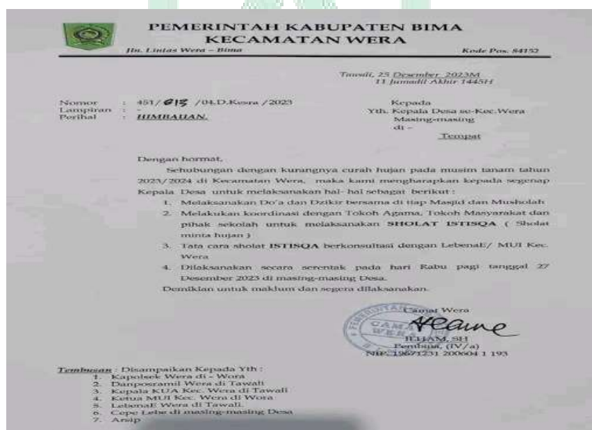
Gambar 1.1 Waktu Pelaksanaan Salat Istisqa'

Salat dan doa meminta hujan di kampung ini dilakukan nanti di bulan 12, bulan 1 dan bulan 2 pada saat itu tepat dengan musim hujan dan kami sedang dalam kegiatan bertani, dan harus di ketahui bahwa tidak ada salat dan doa minta hujan di musim panas, itu hanya akan kami lakukan ketika pada saat musim hujan, tidak masuk akal jika melakukan salat dan doa minta hujan di musim panas. Musim hujan untuk hujan begitupun sebaliknya, mengingkari dua musim itu sama saja mengingkari kehendak Allah.