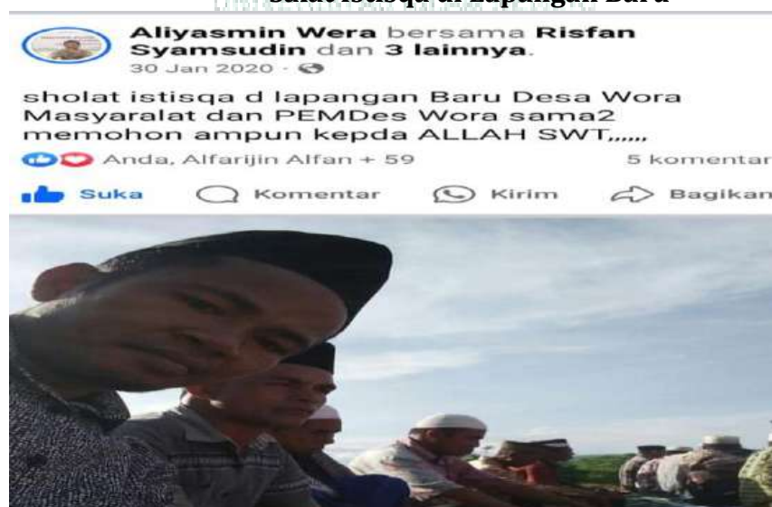
Gambar 1.4 Salat Istisqa'di Lapangan Baru

Sedangkan untuk tempat dilakukannya salat istisqa' biasanya di bukit Salence yang terletak di dusun Asifa rt 04 rw 02 Desa Wora. Pada dasarnya berkaitan dengan tempat itu sudah ada anjuran dari Nabi saw. yaitu tempat yang terbuka dan lapang. Kemudian untuk Desa Wora sendiri dalam pelaksanaan salat istisqa' juga memilih tempat yang terbuka dan lapang namun beragam tempatnya dalam artian tergantung dari hasil kesepakatan yang dibuat oleh pemerintah tapi pada kebiasaanya mereka yaitu di lapangan baru dan doro Salence .