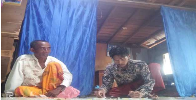
Gambar 1.8 Wawancara Pemangku Adat