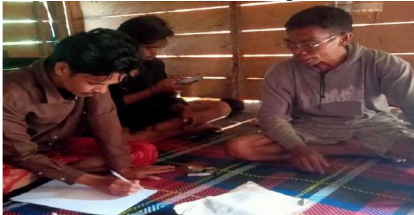
Gambar 1. 9 Wawancara Pemangku Adat