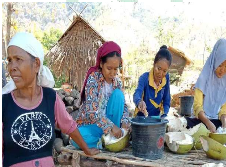
Gambar 1.6 (Kabua Ngaha) Mempersiapkan Konsumsi

makanan masyarakat biasa memilih urap ayam untuk di konsumsi, kenapa? karena makanan tersebut dianggap nikmat apatah lagi mereka sudah menempuh perjalanan jauh maka makanan itu akan menjadi bayaran dari usaha mereka. Tapi harus dipahami bahwa membuat urap ayam ini tidaklah menjadi syarat dalam pelaksanaan tradisi doa raho ura , makanan ini bisa saja yang lain tapi pada kebiasaanya urap ayam dibuat ketika dilakukanya tradisi doa raho ura .