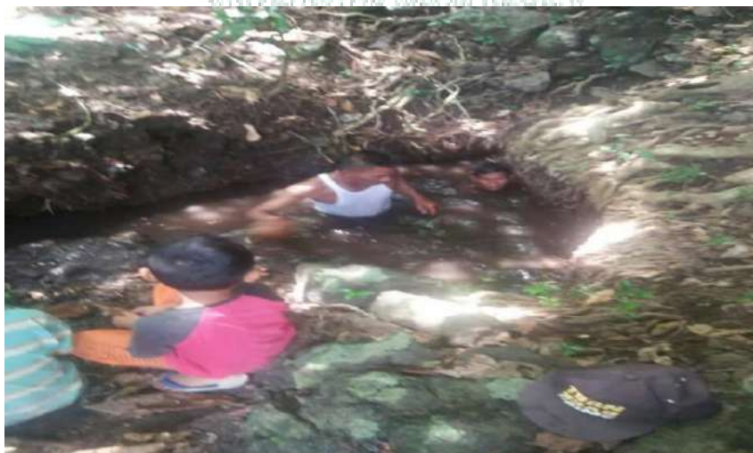
Gambar 1.7 Karaso Mada Oi Seli (Membersihkan Mata Air Oi Seli )

Prosesnya ialah ketika masyarakat sampai di tempat yang telah ditentukan oleh pemerintah Desa yaitu sumur mata air oi seli . Maka mula-mula tindakan awal yang akan dilakukan pada saat itu yaitu satu atau dua orang mengambil bagian untuk memasuki sumur mata air oi seli dengan maksud untuk membersihkan sumur dari lumpur, dedaunan dan ranting yang membuatnya tersumbat.