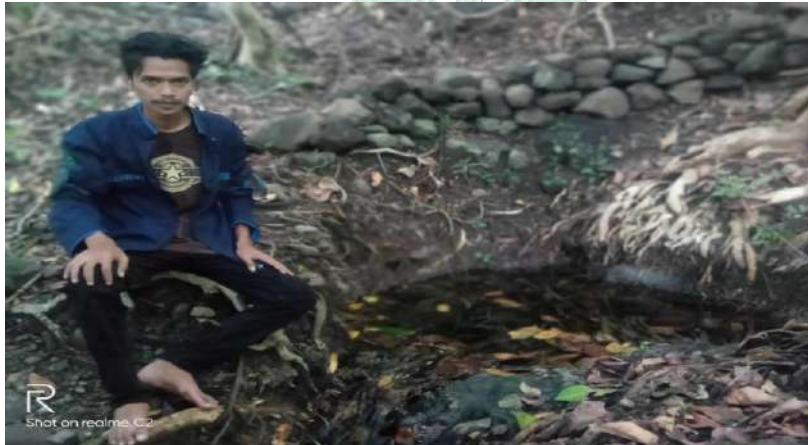
Muara Sungai Tempat doa Raho Ura