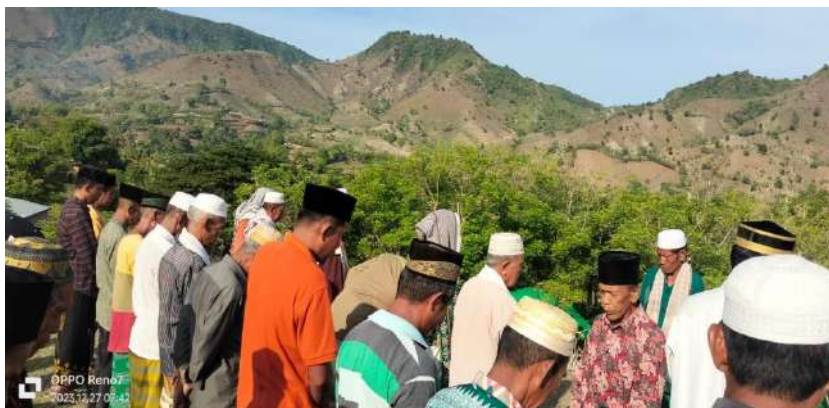
Gambar 1. 3 Salat Istisqa' Di Bukit Salence

Hal yang mendasari adanya salat dan doa minta hujan di tempat kami Desa Wora ini karena tidak datangnya hujan, jika hujan datang seperti biasa kami tidak melakukan salat dan doa minta hujan dan dari tidak adanya hujan itu dapat mendatangkan kerusakan-mati pertanian kacang dan jagung yang ada di gunung dan sawah. Salatlah kami dengan niat hati dapat diampuni, jika bisa lebih diberikan air hujan dan dikasihani oleh Allah swt. atas hidup kami.