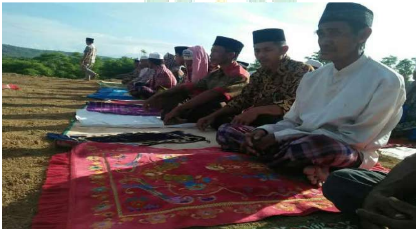
Gambar 1.5 Beristighfar dan Berdzikir Sesudah Salat

dilakukan maka saya biasanya menambah dengan doa meminta keselamatan, meminta pertolongan, meminta rezeki dan lain sebagainya yang biasa di hafal, tapi yang paling penting ialah susunan doa diatas dan apa yang kami lakukan ini sudah sesuai anjuran ulama.