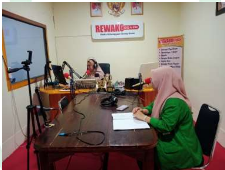
Gambar 4: Mendengarkan Langsung Siaran Program “Digoda (Digoyang Dangdut)” yang dibawakan oleh Nada Sofie