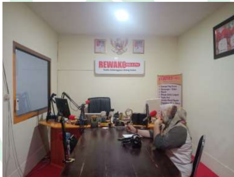
Gambar 8: Ruangan Siaran Radio Rewako 100.4 FM