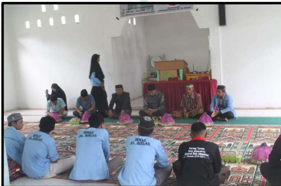
Gambar 10 : Kegiatan Remaja Masjid (Kajian)