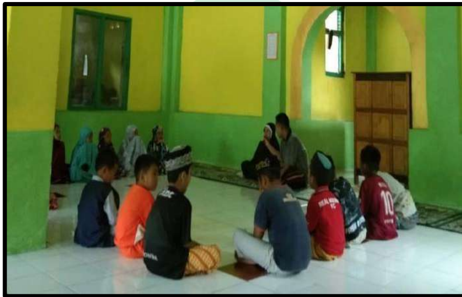
Gambar 9 : Kegiatan Pembinaan TK/TPA di Masjid Nurussalam Bungayya