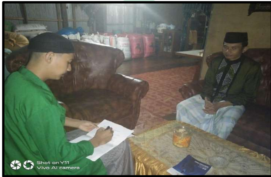
Gambar 5 : Wawancara dengan Pengurus Masjid Babussalam Pannijoang