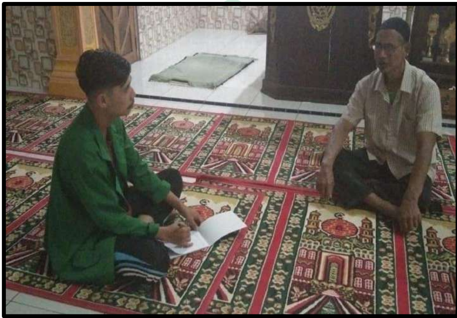
Gambar 7 : Wawancara dengan Pengurus Masjid Al-Anshar Tombolo