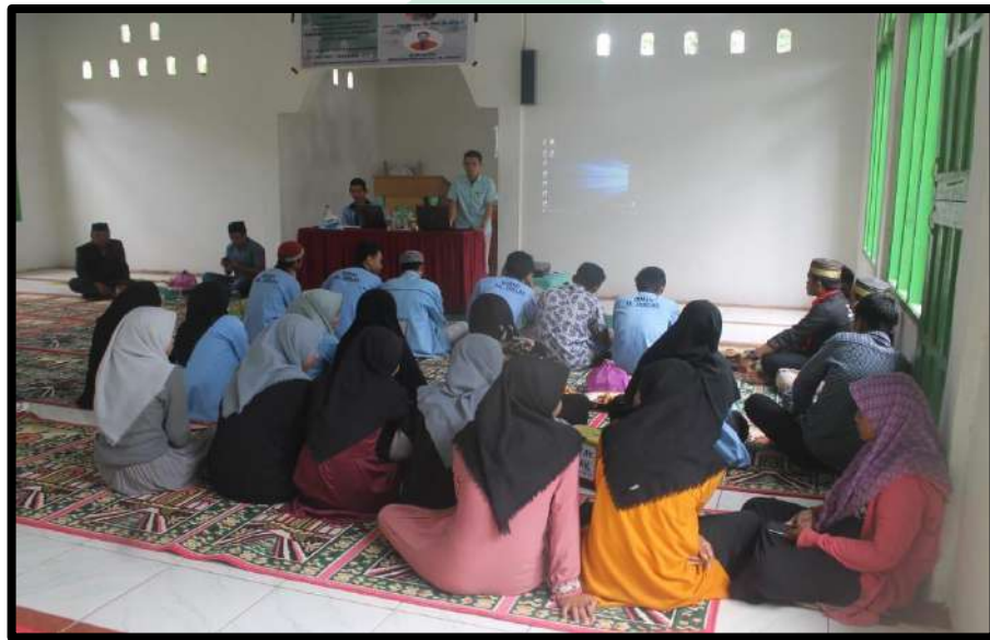
Gambar 11 : Kegiatan Remaja Masjid