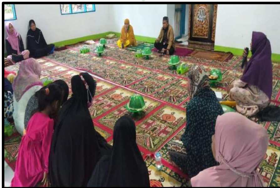
Gambar 12 : Kegiatan Pembinaan Majelis Taklim