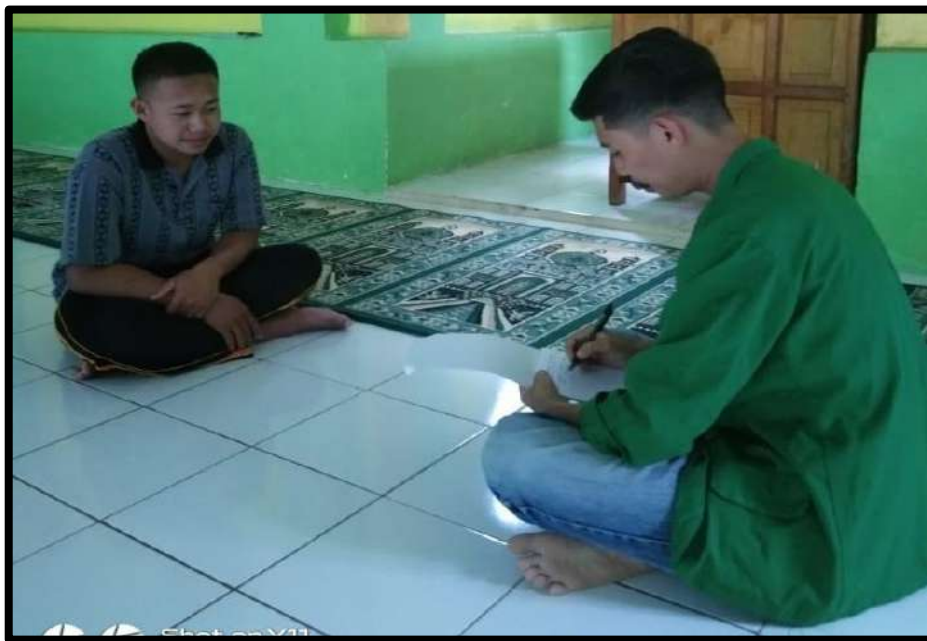
Gambar 8 : Wawancara dengan Pengurus Masjid Nurussalam Bungayya