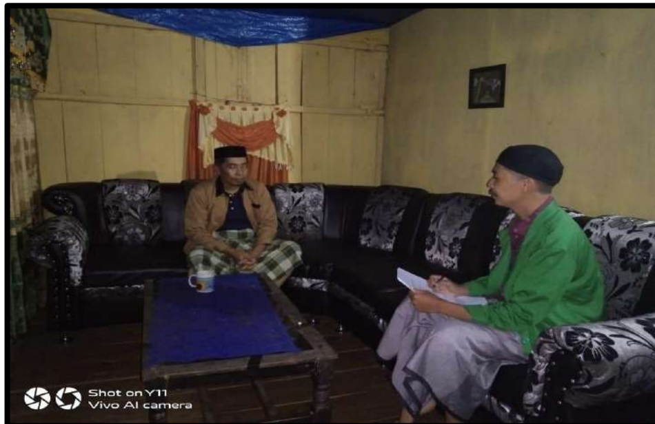
Gambar 6 : Wawancara dengan Pengurus Masjid Al-Ikhlas Bontomanai