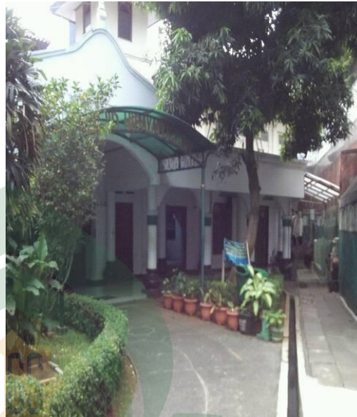
Masjid Andi Mappanyukki Desa Waekecee