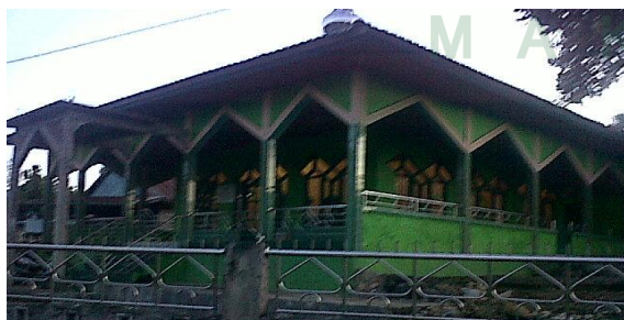
Masjid Hasana Desa Tonrongnge