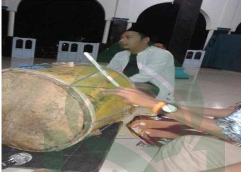
Foto pengurus masjid yang sedang mengajarkan memainkan alat musik pada remaja masiid