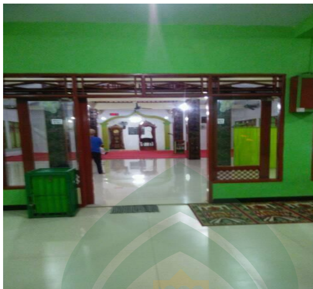
Celengan dan karpet shalat masjid