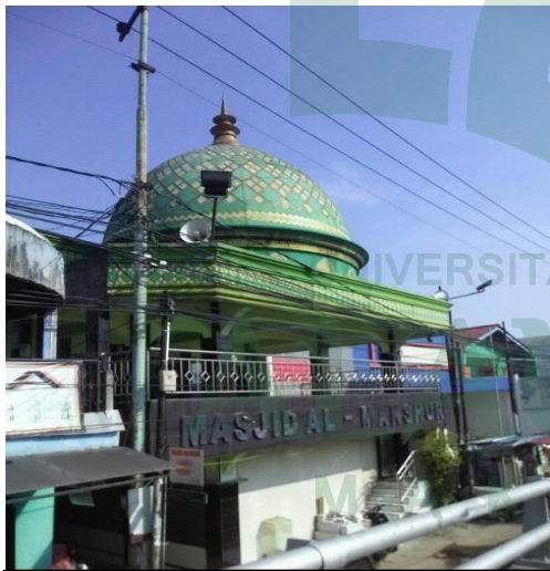
Masjid Al-Manshur Desa: Patangkai Kec.Lappariaja Kab. Bone