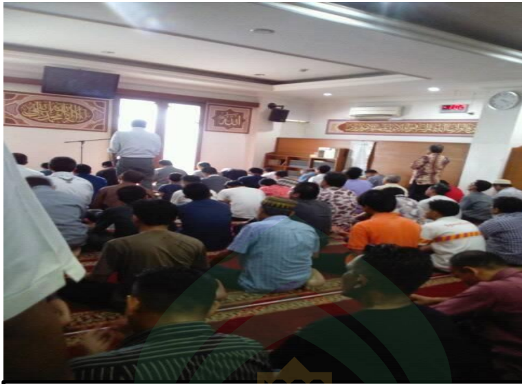
Suasana jama'ah yang sedang menunggu Shalat Ashar sambil mendengarkan azhan dengan suasana khusus