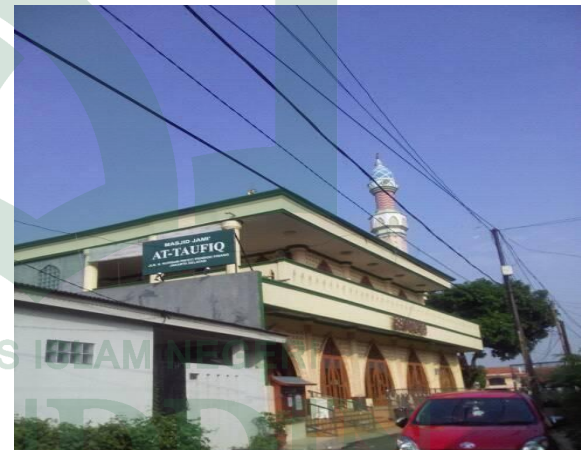
Masjid At-Taufiq Desa Liliriattang