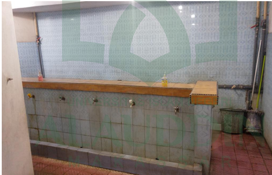
Tempat wudhu dan alat pembersi masjid