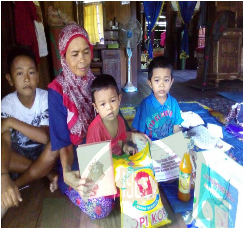
Suasana penyaluran bantuan sembako oleh pengurus masjid terhadap jamaah'ah (pengurus masjid) yang kurang mampu