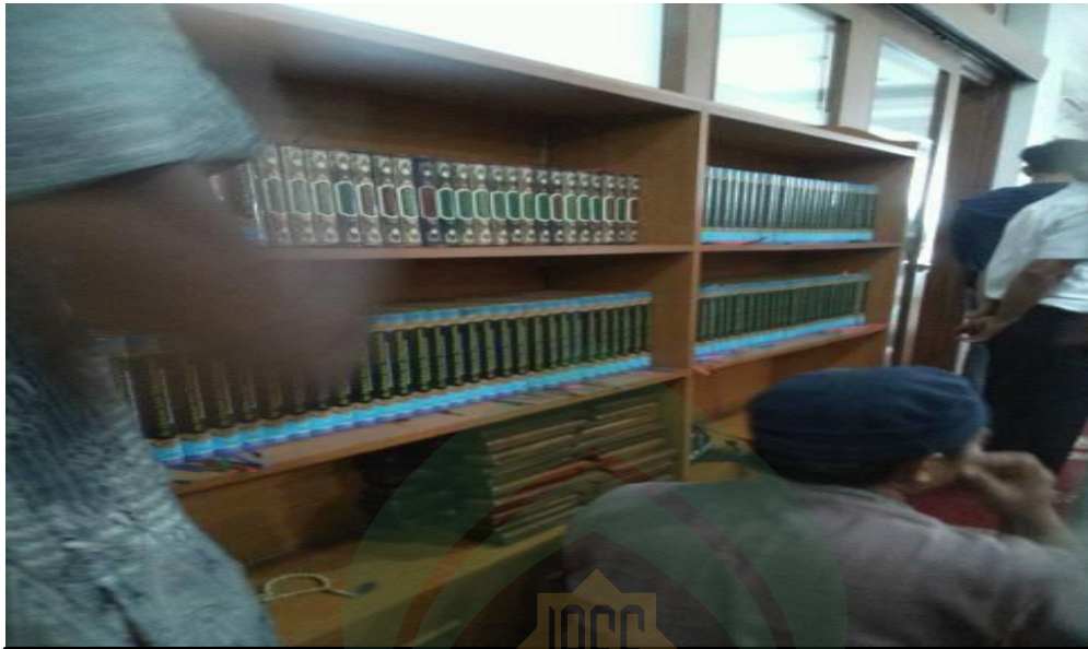
Perputakaan mini masjid terlihat beberapa Al-Quran dan terlihat alat tempat meletakkan Al-Qur'an