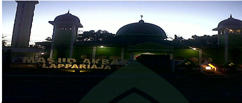
Masjid tertua di Kecamatan Lappariaja yang terletak di Desa Patangkai