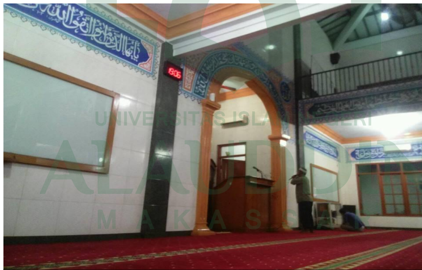
Foto pengurus masjid yang sedang Azhan Shalat Duhur

Suasana para pengurus dan Jama'ah masjid se usai Shalat Magrib secara berjama'ah, kemudian dilanjutkan dengan berdoa bersama dengan tujuan mendapatkan ridho Allah swt.