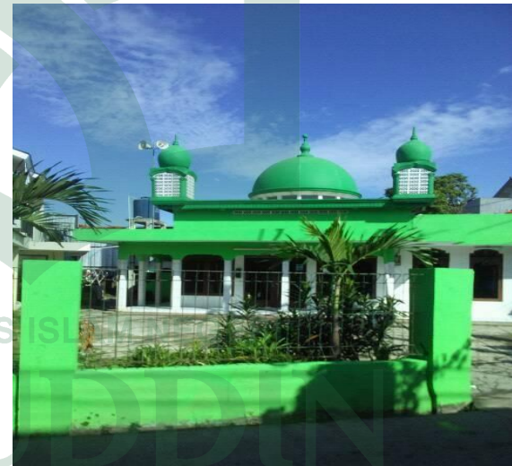
Masjid Amanah Desa Sengeng Palie