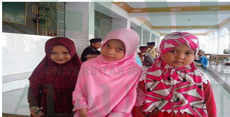
Inilah murid yang sering membantu teman-temannya di Taman Pendidikan Al-Qur'an (TPA) yang agak lambat cara penyerapan ilmunya dalam belajar membaca dan menulis Al-Qur'an