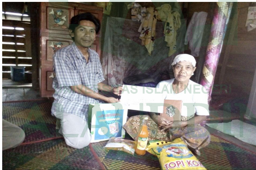
Suasana penyaluran bantuan sembako oleh pengurus masjid terhadap jamah'ah (guru mengaji) yang kurang mampu