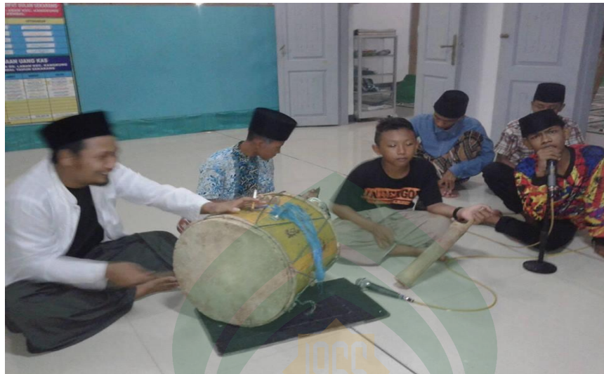
Kekompakan pengurus masjid dan remaja masjid dalam memainkan alat musik tradisional sambil bernyanyi