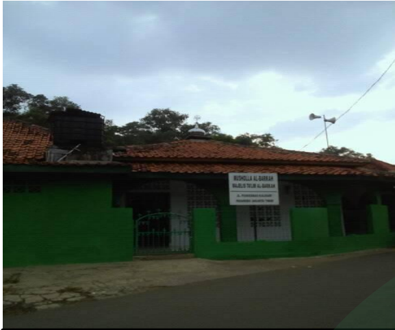
Masjid Nur Iman Desa Mattampa Walie