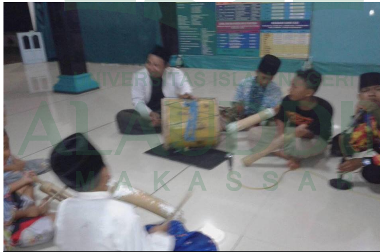
Foto para remaja masjid memainkan alat musik tradisional sambil bernyanyi