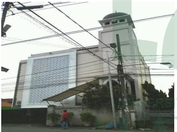
Masjid Amina Desa Liliriattang