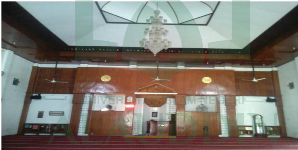
Fasilitas masjid diantaranya terlihat kipas anagin, AC atau pendingin ruangan, jam digital, mimbar, karpet, sounsystem dan lampu kristal yang tergantung di dalam masjid