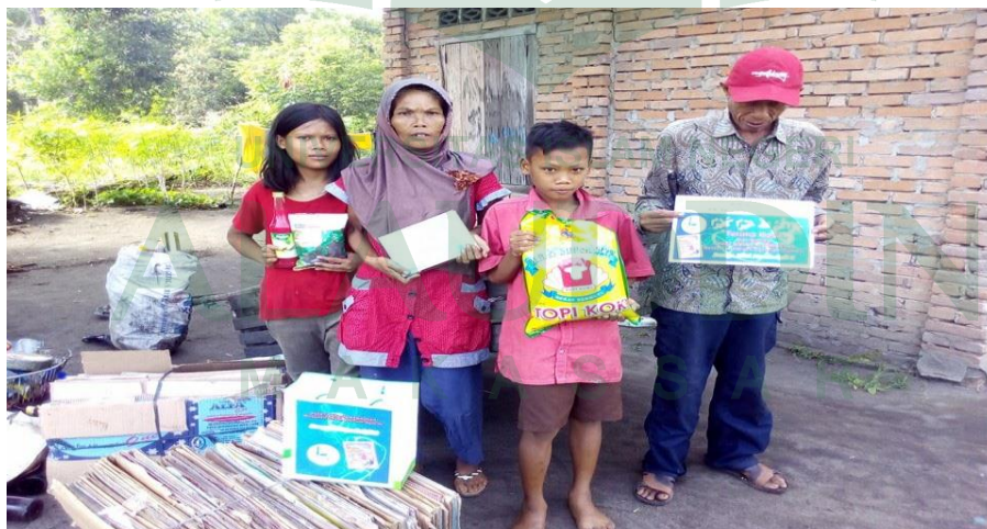
Suasana penyaluran bantuan sembako oleh pengurus masjid terhadap jamaah'ah yang rajin ke masjid yang tergolong kurang mampu