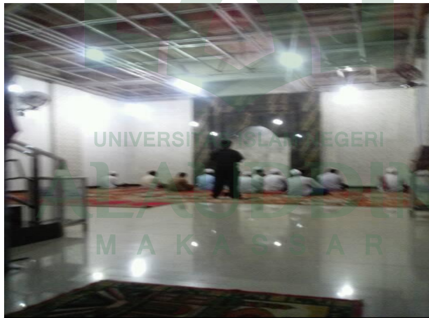
Suasana jama'ah yang sedang shalat sunnah dan jama'ah yang sedang menunggu waktu shalat Isya tiba