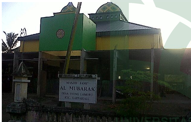
Masjid Al Mubarak Desa Ujung Lamuru