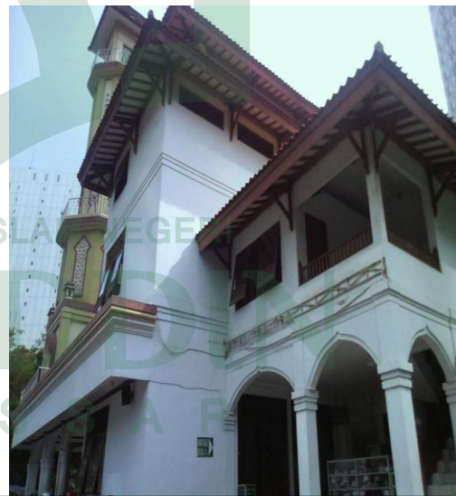
Masjid pisabilillah Desa Tenri Pakkua