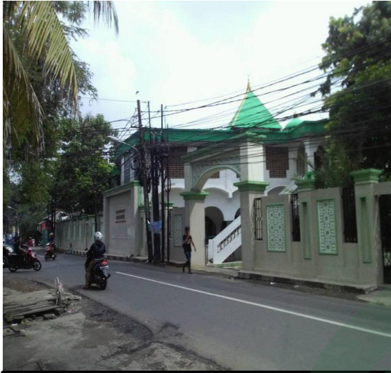
Masjid Mutma inna Desa Tenri Pakkua