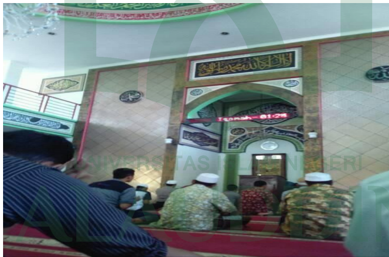
Suasana para jama'ah yang menanti-nantikan Shalat Duhur secara berjama'ah