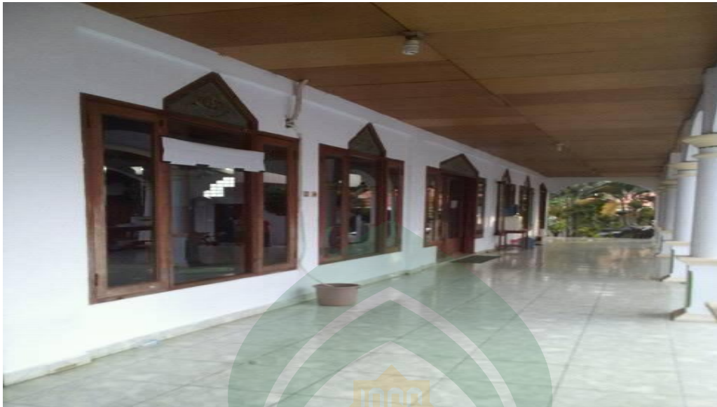
Ember penampungan air AC atau mesin pendingin ruangan dan lampu masjid