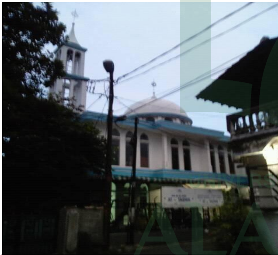
Masjid Muslimin Desa Pattuku Limpoe