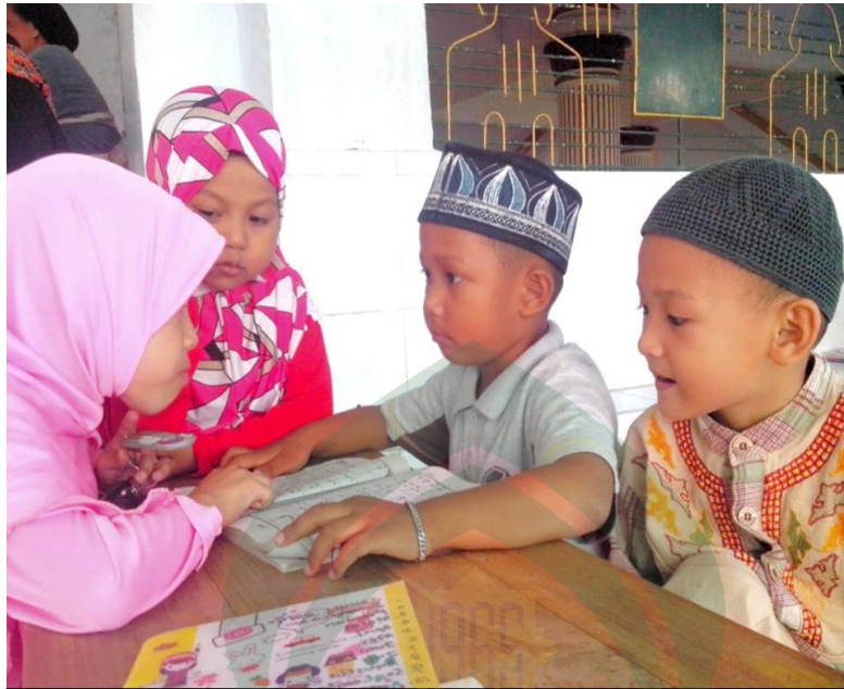
Suasana saling mengajarkan sesama murid Taman Pendidikan Al-Qur'an (TPA)