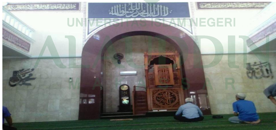
Fasilitas masjid diantaranya terlihat kipas anagin, jam , mimbar, karpet, dan pendengin ruangan berupa AC yang terlihat di dalam masjid