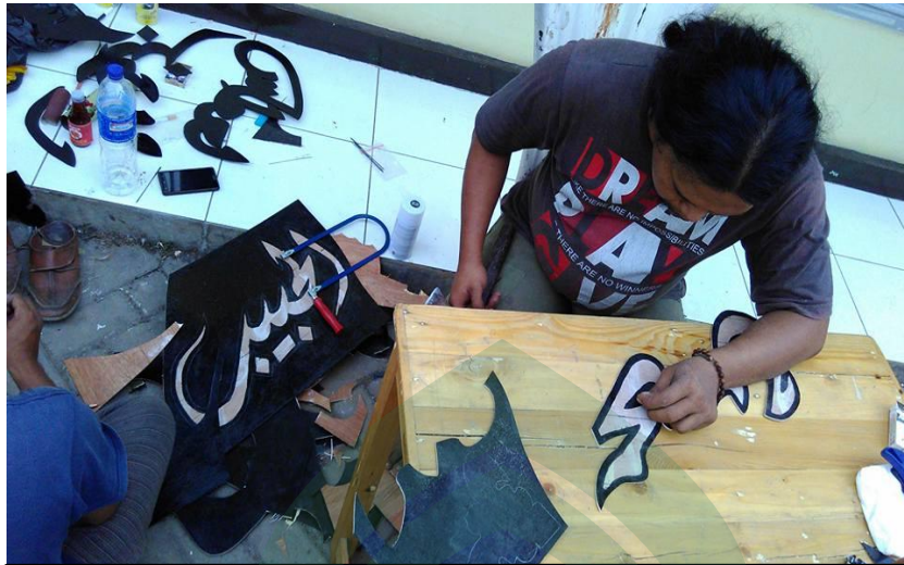
Pemberdayaan jama'ah yang pengangguran