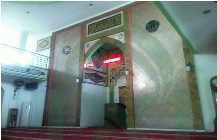
Fasilitas masjid diantaranya terlihat kipas anagin, jam digital, mimbar, karpet, sounsistem dan perputakaan mini masjid