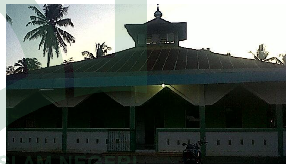
Masjid Al-Islam Desa Ujung Lamuru