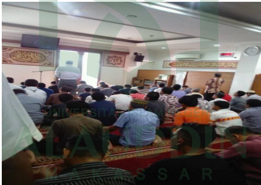
Suasana jama'ah yang menikmati fasilitas masjid yang terlihat di dalamnya berupa pendingin ruangan atau AC, jam digital, jam dinding, karpet shalat,sounsistem dan mik