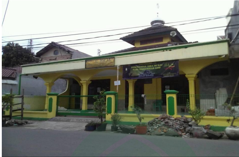
Masjid Al-Ikhlash Desa Pattuku Limpoe

UNIVERSITAS ISLAM NEGERI ALAUDDIN M A K A S S A R