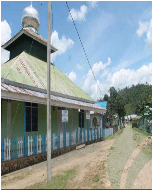
Masjid Mah'mud Desa Waekecee