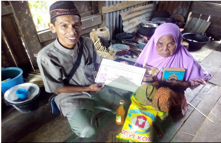
Suasana penyaluran bantuan sembako oleh pengurus masjid terhadap jamah'ah (Majelis Ta'lim) yang kurang mampu