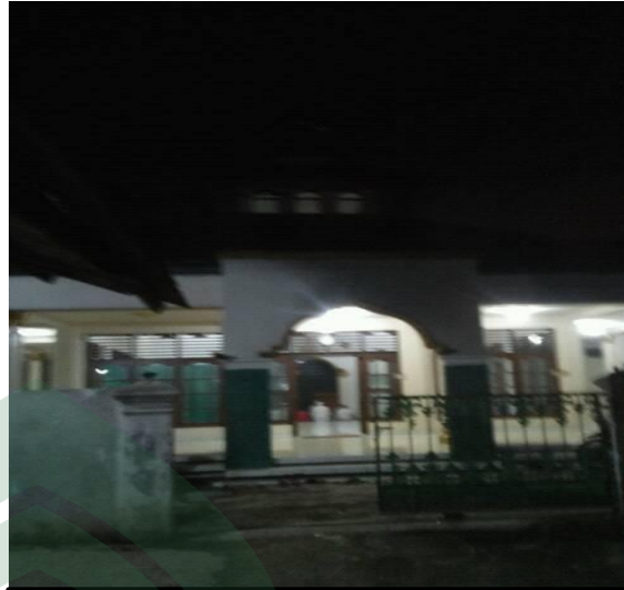
Masjid Ar-Rahman Desa Sengeng Palie