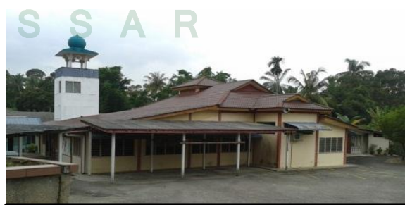
Masjid Nurul Huda Desa Tonrongnge