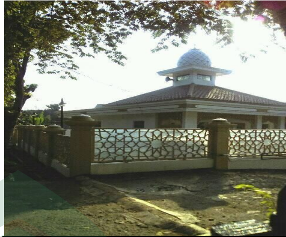
Masjid Al-Munawara Desa Mattampa Walie