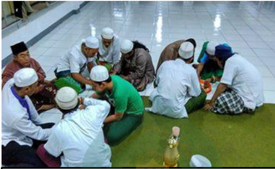
Suasana para pengurus masjid dalam menjalin kekompakan sesama pengurus yang dituangkan dalam makan bersama dalam satu piring berempat dan bertiga