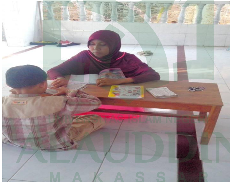
Suasana proses belajar mengajar antara guru dan murid Taman Pendidikan Al-Qur'an (TPA)