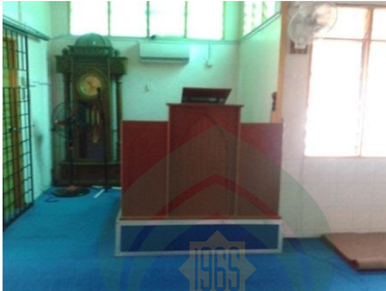
Fasilitas masjid yang terlihat mimbar, kipas angin, AC atau pendingin ruangan, jam dan karpet shalat