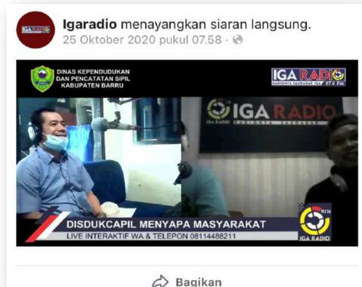
Live facebook IGARadio

“media lain yang diajak kerja sama ialah media IGA Radio, dalam akun facebook tersebut IGA radio melakukan live interaktif yang membahas tentang Covid-19 ” 6