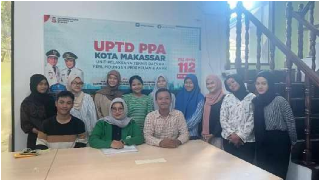
Gambar 1 : Foto bersama dengan Anggota Forum Anak Makassar, 29 Juni 2024