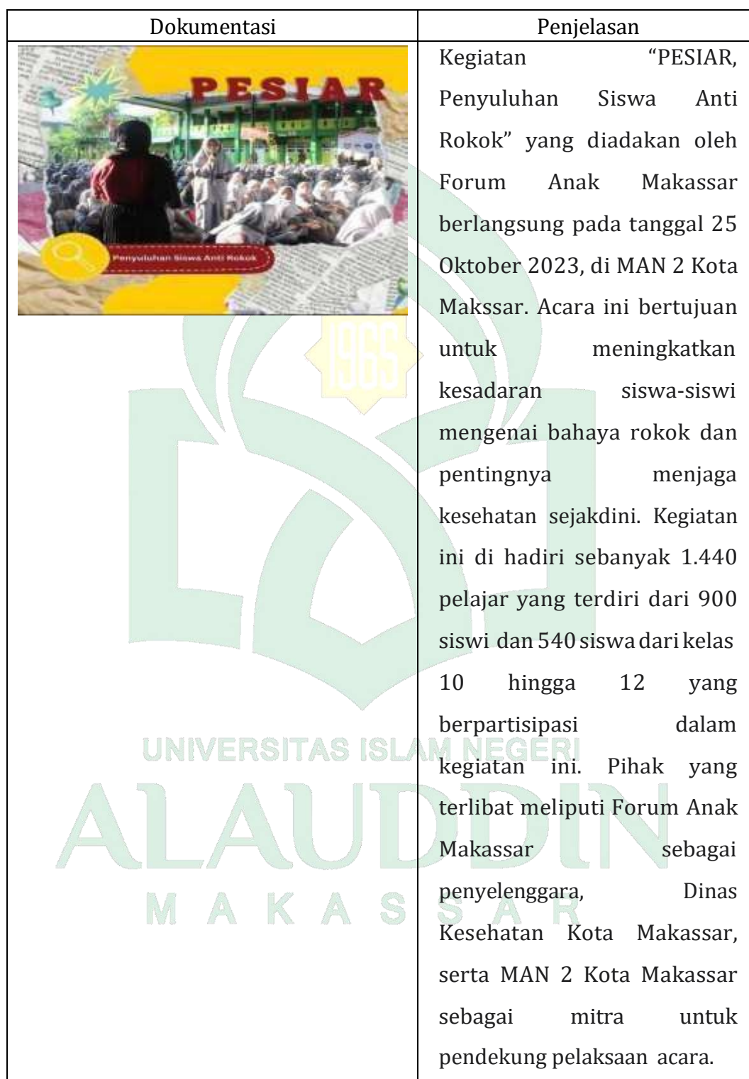
Tabel 4.1 Dokumentasi Kegiatan Forum Anak Sebagai Pelapor