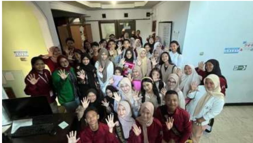
Gambar 5 : Foto bersama dengan calon anggota Forum Anak Makassar, 21 September 2024