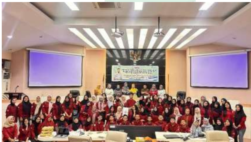
Gambar 6 : Foto bersama dengan Ketua Bidang Pemenuhan Hak dan Perlindungan Anak, seluruh anggota Forum Anak Makassar, Fasilitator Forum