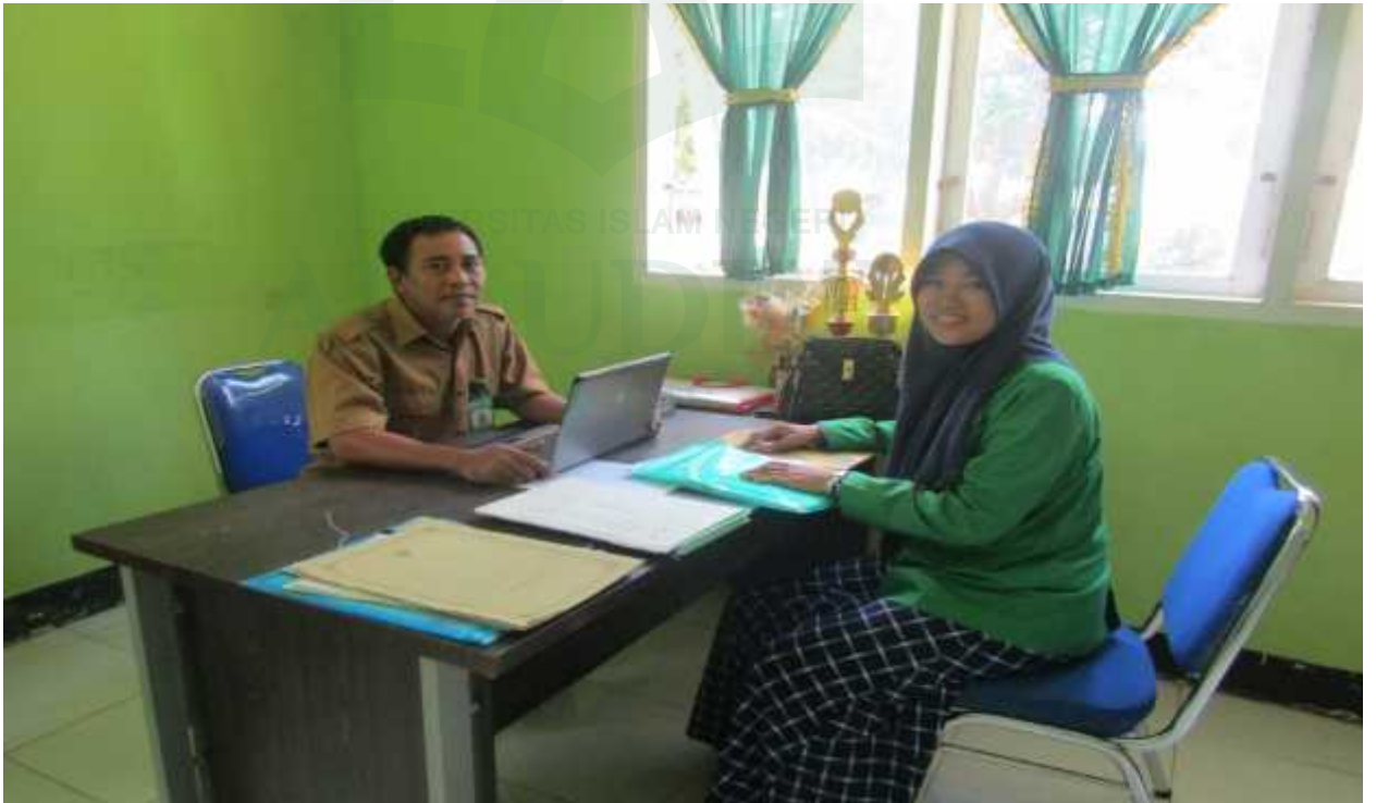
Wawancara Kepala KUA Kecamatan Salomekko Tgl. 25 Juli 2016