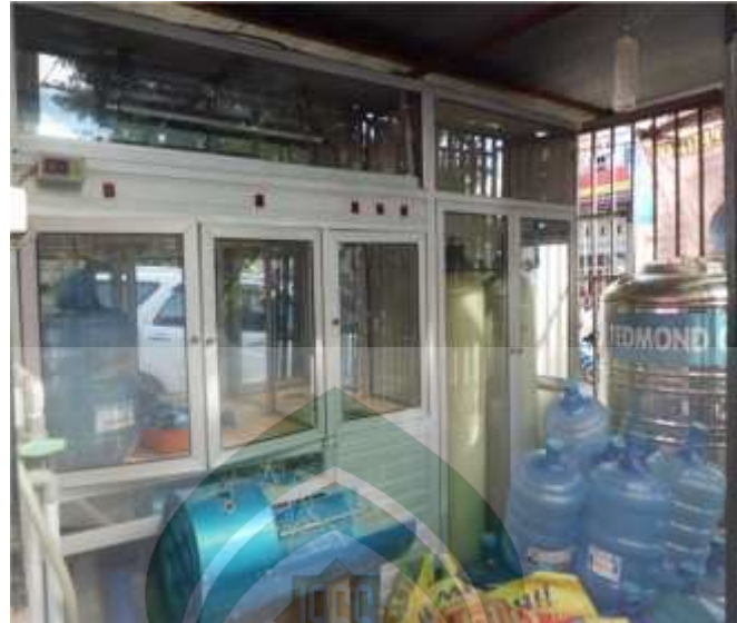
Depot air minum A