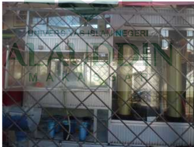
Depot air minum B