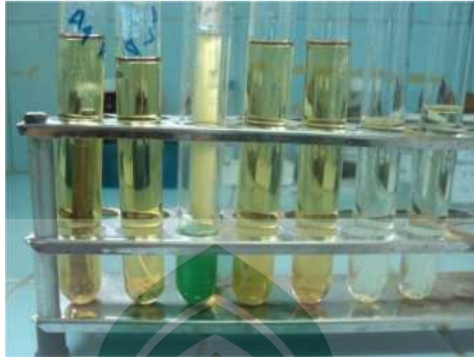
Gambar 2. uji penegasan