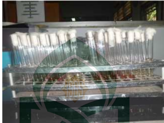
Gambar 1. Uji penduga