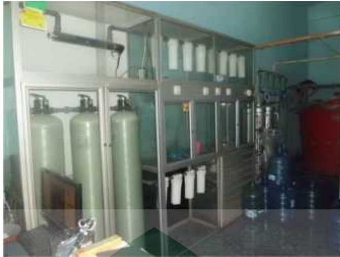
Depot air minum C