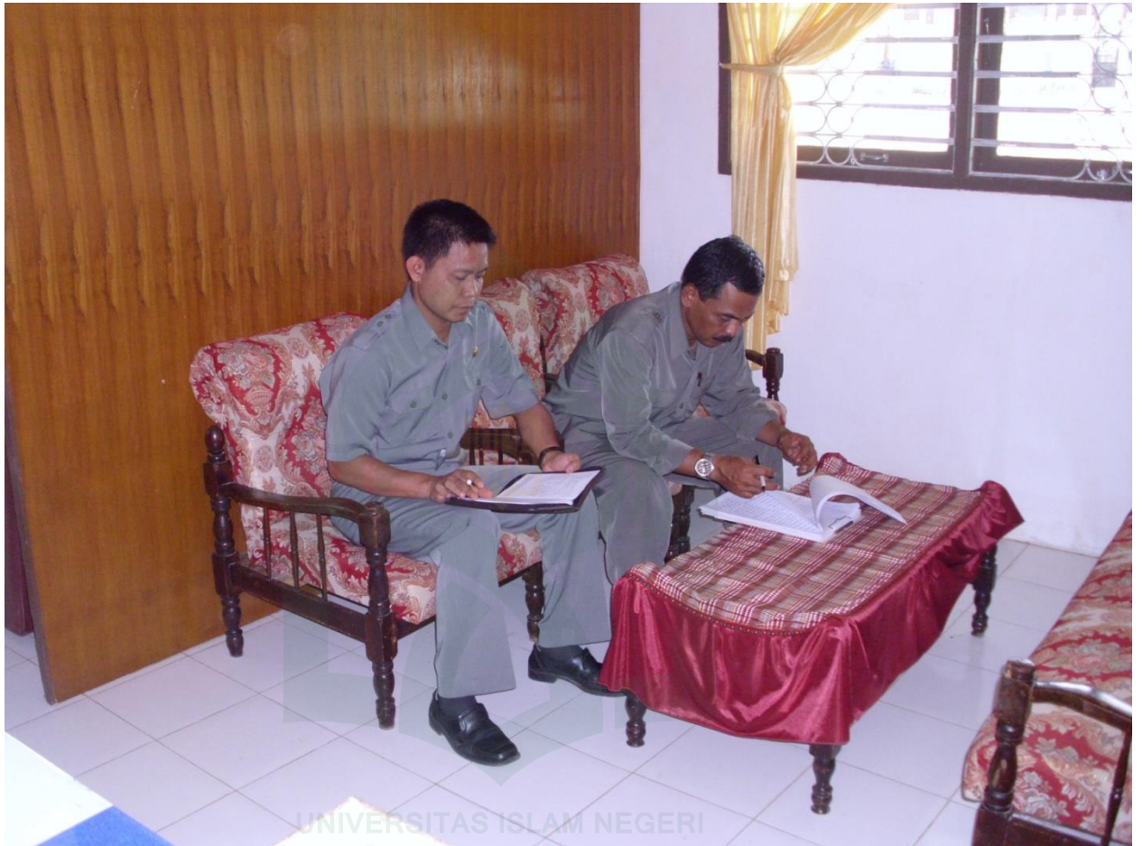
Wawancara dengan kepala MTsN Sinjai Utara

UNIVERSITAS ISLAM NEGERI ALAUDDIN M A K A S S A R