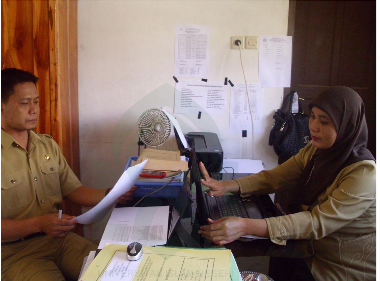
Wawancara dengan Guru Mata Pelajaran matematika MTsN Sinjai Utara