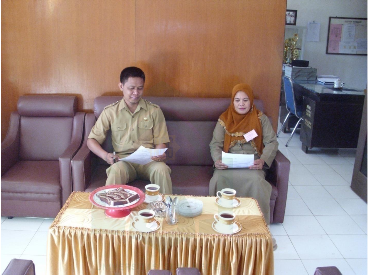
Wawancara dengan guru mata pelajaran Bahasa Indonesia MTsN Sinjai Utara