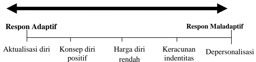
Gambar 2.4 Rentang respon konsep diri

Respon konsep diri sepanjang rentang respon sehat-sakit berkisar dari status aktualisasi diri yang paling adaptif sampai status kerancuan identitas serta depersonalisasi yang lebih maladaptif (Gambar 2.4). Kerancuan identitas merupakan suatu kegagalan individu untuk mengintegrasikan berbagai identifikasi masa kanak-kanak ke dalam kepribadian psikososial dewasa yang harmonis. Depersonalisasi adalah suatu perasaan tidak realistis dan merasa asing dengan diri sendiri. Hal ini berhubungan dengan tingkat ansietas panik dan kegagalan dalam uji realitas (Stuart, 2007).