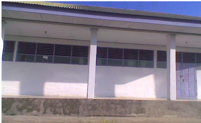
Laboratorium dan Aula