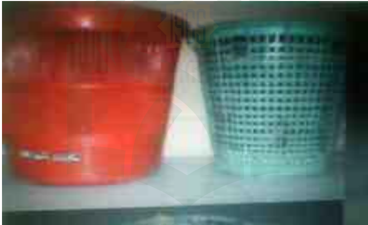
Tempat sampah plastik