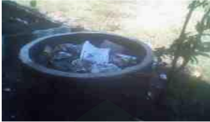
Tempat sampah Beton