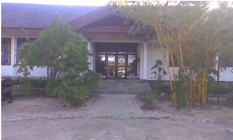
Ruangan Kepala sekolah dan ruangan Guru