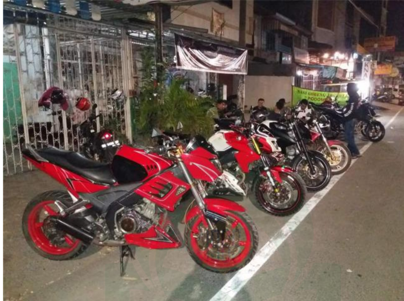
Gambar 1.2 Kopdar club v-one di sekretariat