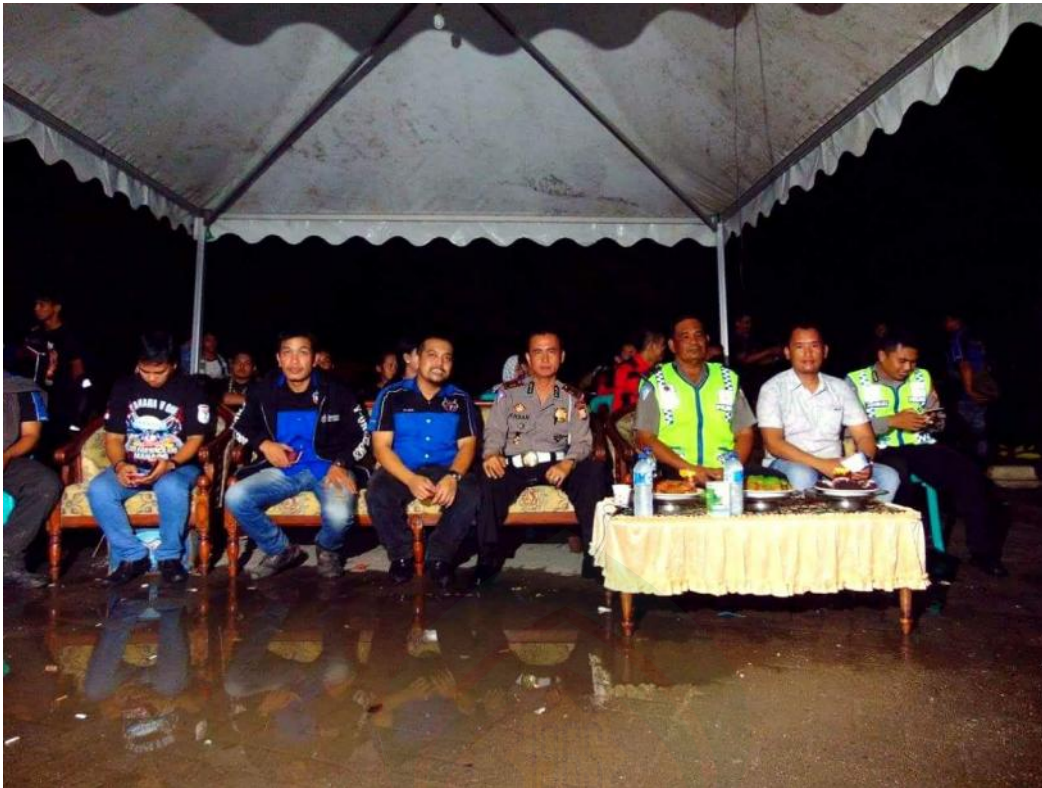
Gambar 1.3 v-one bersama kaporles saat university