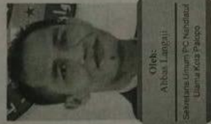
Oleh: Abbas Langgali Sarjana UIN P2 Negeri Lampung Kota Paçoço

SALAH satu fenomena sosial keagamaan yang menonjol dalam kurun 1 dasawarsa terakhir adalah tumbuh subur nya akun-akun di media sosial.