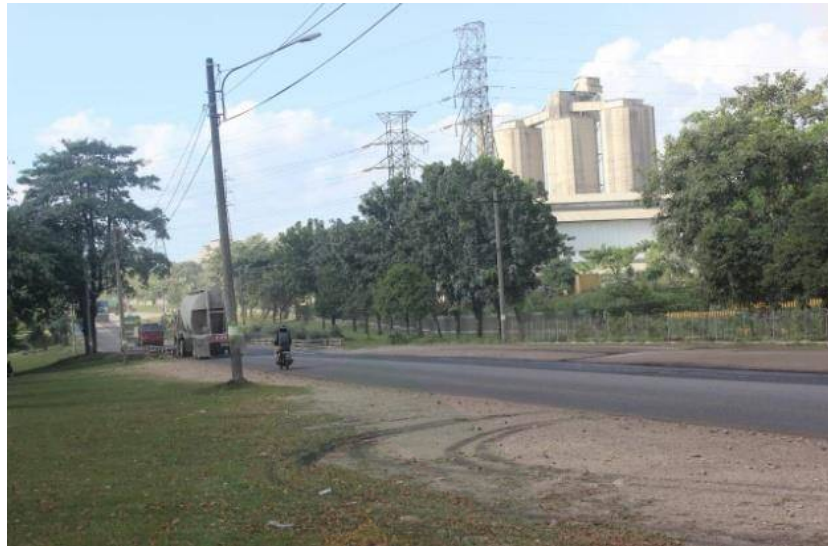
Gambar : Jalur lalu lintas yang di lewati truck muatan

Dilihat pada gambar tersebut jelas bahwa kegiatan operasional perusahaan pada proses pengangkutannya berjalan lancar hanya saja jalur yang di lewati truck muatan yang keluar masuk terlihat sangat gersang dan berdebu hal ini sangat mengganggu warga sekitar yang tinggal di dekat kawasan tersebut.