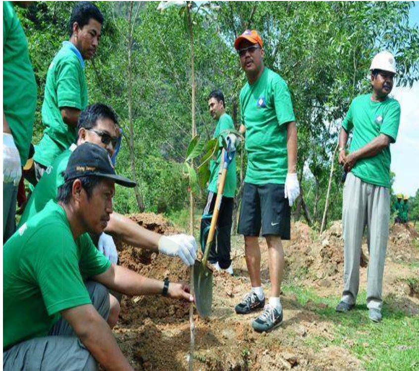
Gambar : Kegiatan penanam Pohon oleh karyawan PT Semen Tonasa

lingkungan hidup dan ekosistem secara berkelanjutan, seperti penanaman pohon yang dilakukan karyawan dan masyarakat sekitar.