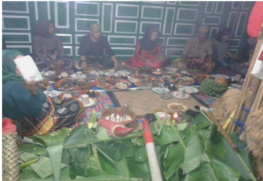
Gambar saat sebelum dimulai tarian Maggiri