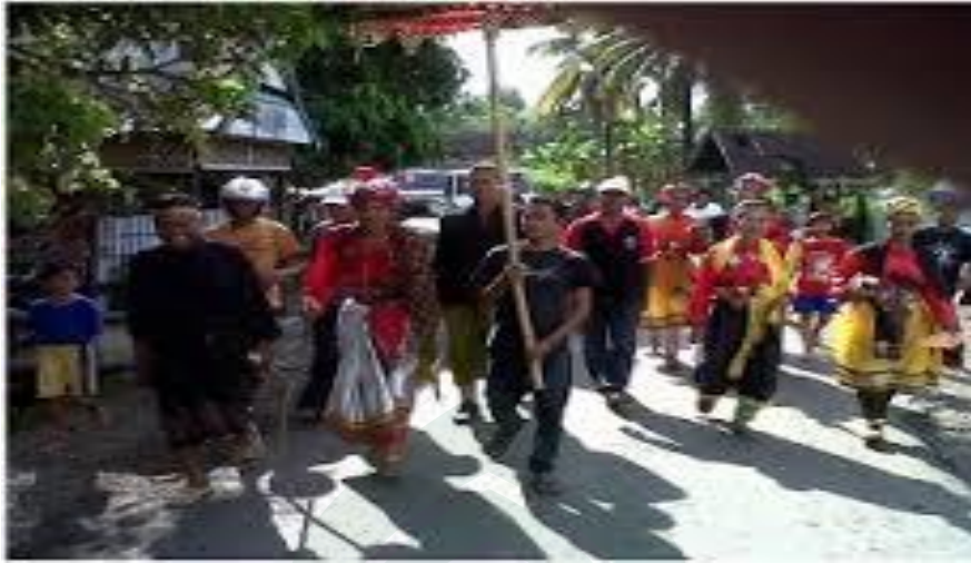
Gambar ini di ambil saat Palili Arajang (mengarak arajang keliling kampung)