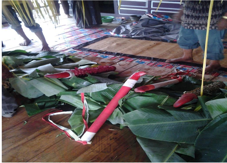
Gambar Arajang setelah di mandikan dan di balut dengan daun pisang