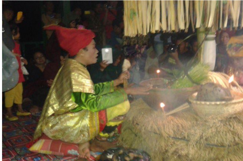
Gambar saat salah satu Bissu memanjatkan doa