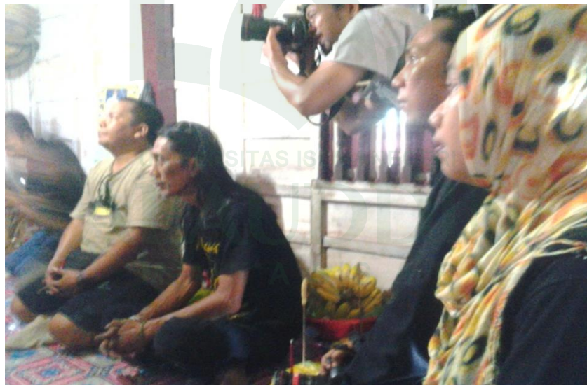
Gambar penulis beserta peliput lainnya saat prosesi meminta ijin meliput/meneliti