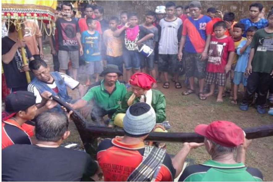
Gambar saat Arajang ingin di Palili (keliling kampung)