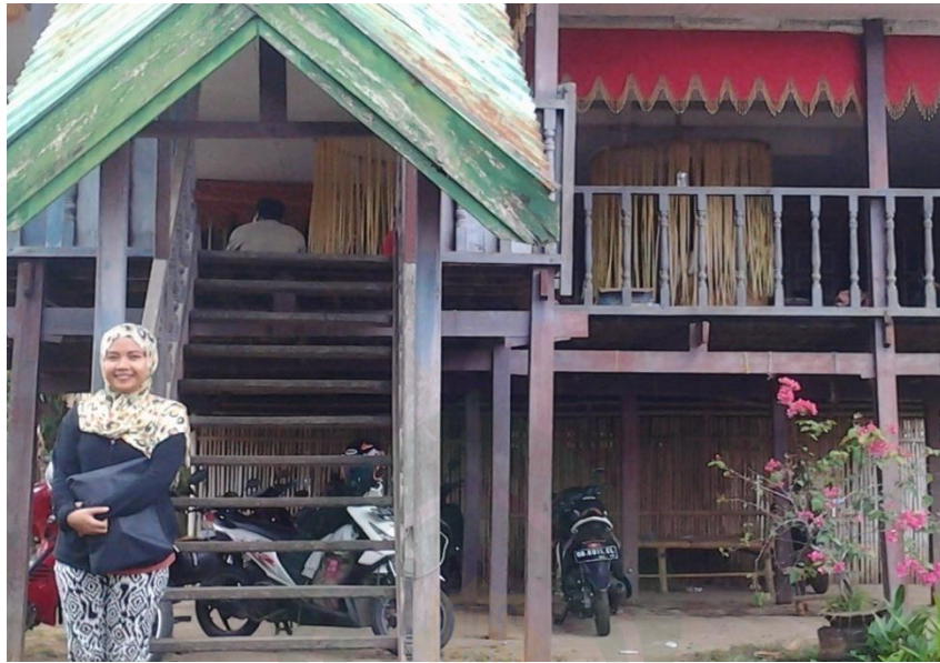
Gambar Penulis saat tiba di lokasi penelitian Bola ArajangE