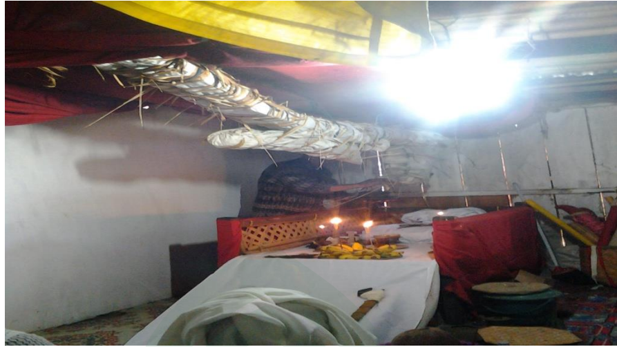
Gambar persiapan upacara Mappalili