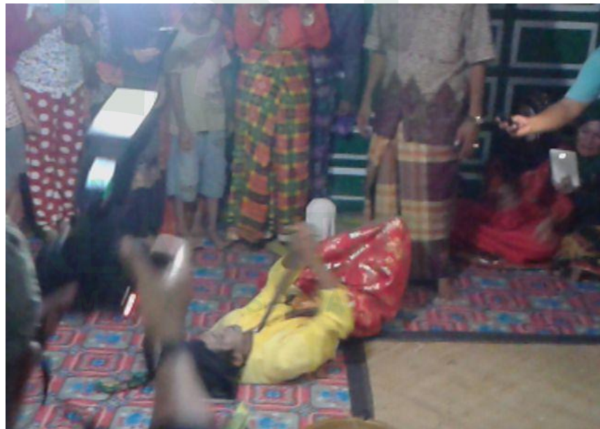
Gambar saat salah satu Bissu melakukan tarian Maggiri (Tarian menusuk tubuh dengan keris)