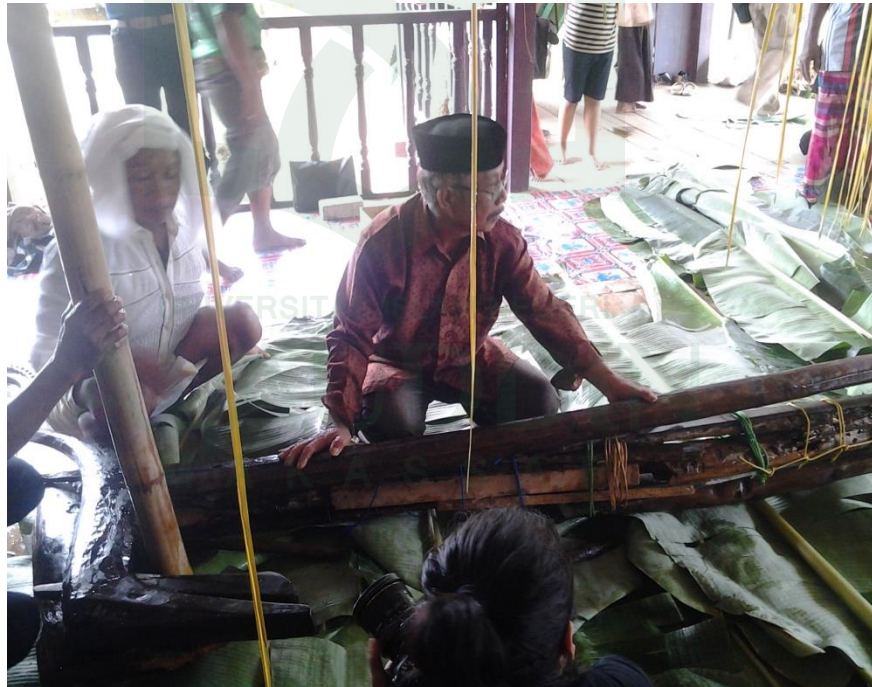
Gambar saat memulai ritual pemandian Arajang (Traktor tua)