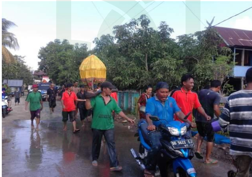
Gambar warga saat membawa Arajang