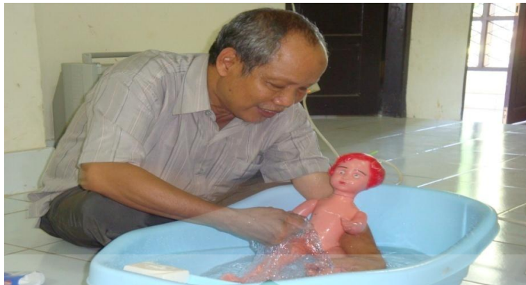
Gambar 4. Pelatihan memandikan bayi