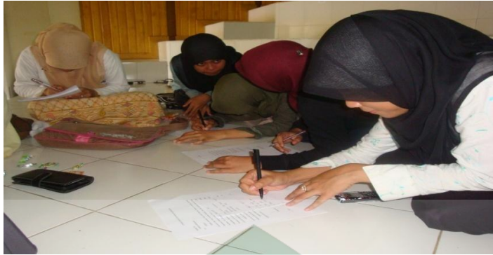
Gambar 1. Pengisian pre test