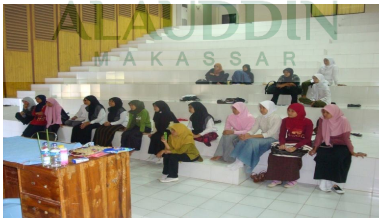
Gambar 6. Sampel yang mengikuti pelatihan