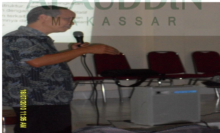
Gambar 3. Pemberian materi