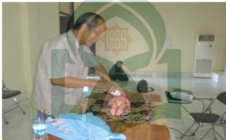
Gambar 5. Pelatihan menabur bedak ke badan bayi