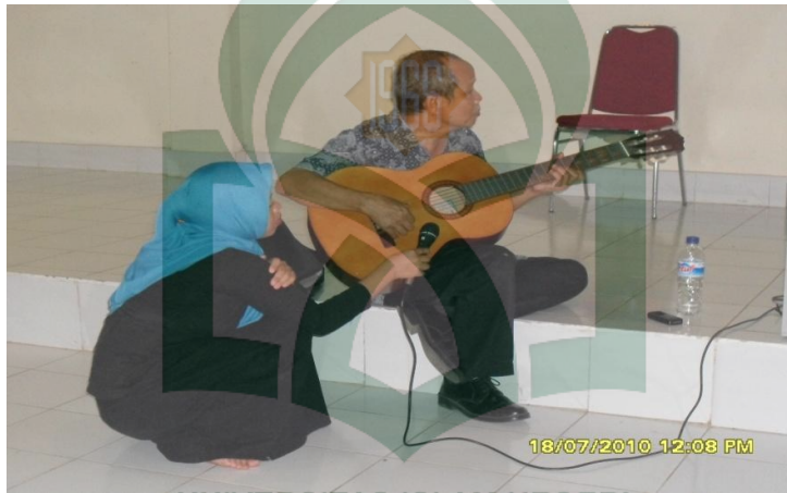
Gambar 2. Pemberian materi