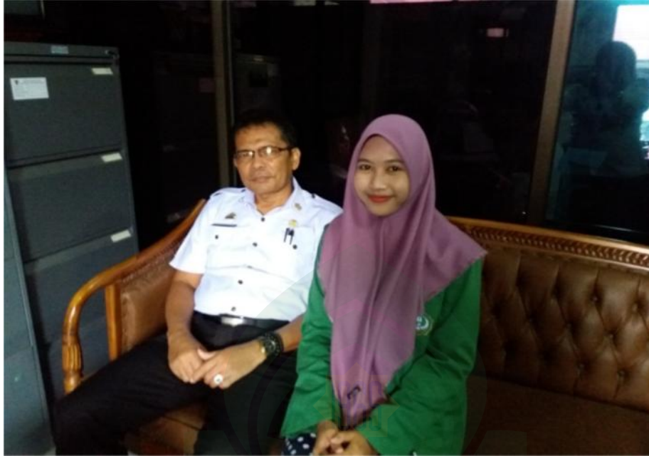
Wawancara dengan Kepala Badan Pengelolaan Keuangan Daerah