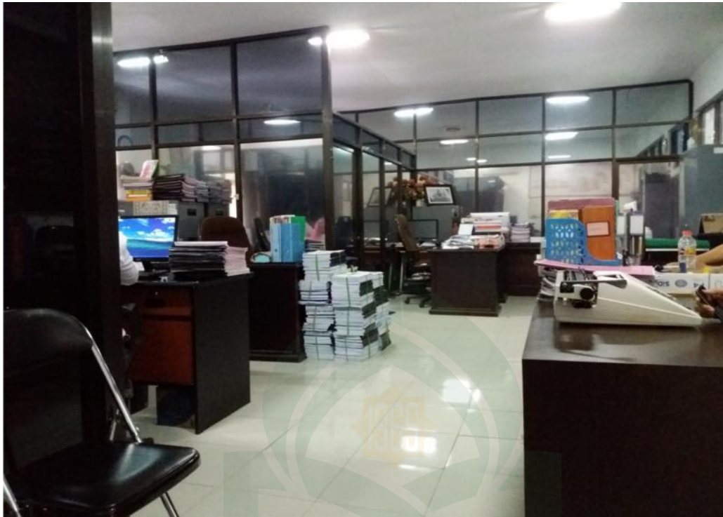
Kantor Badan Pengelolaan Keuangan Daerah

UNIVERSITAS ISLAM NEGERI ALAUDDIN M A K A S S A R