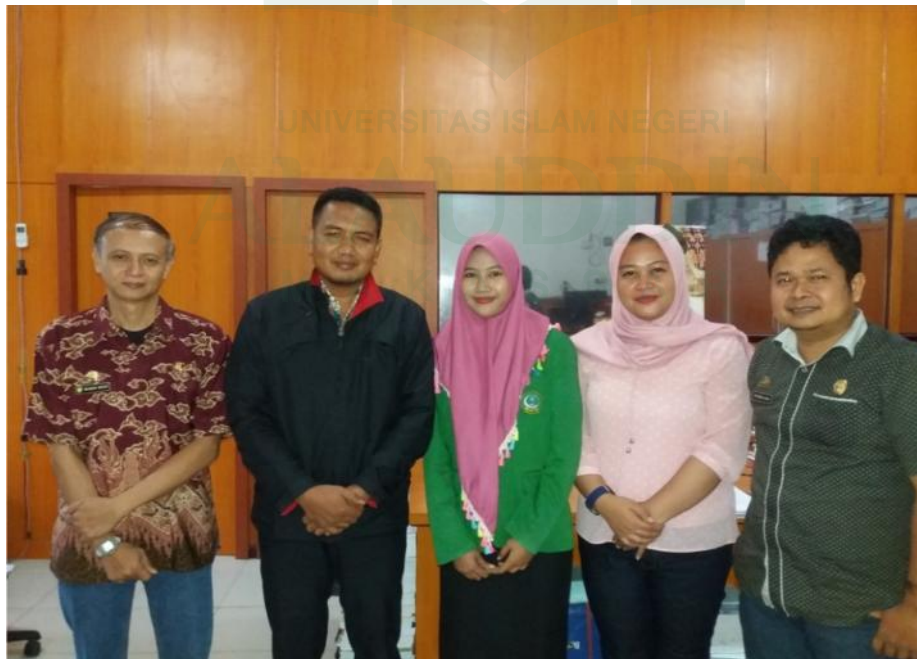
Wawancara dengan Kepala Bidang Akuntansi