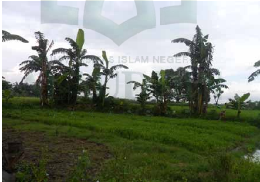
Suasana/Pemandangan Desa Pa'rasangang Beru