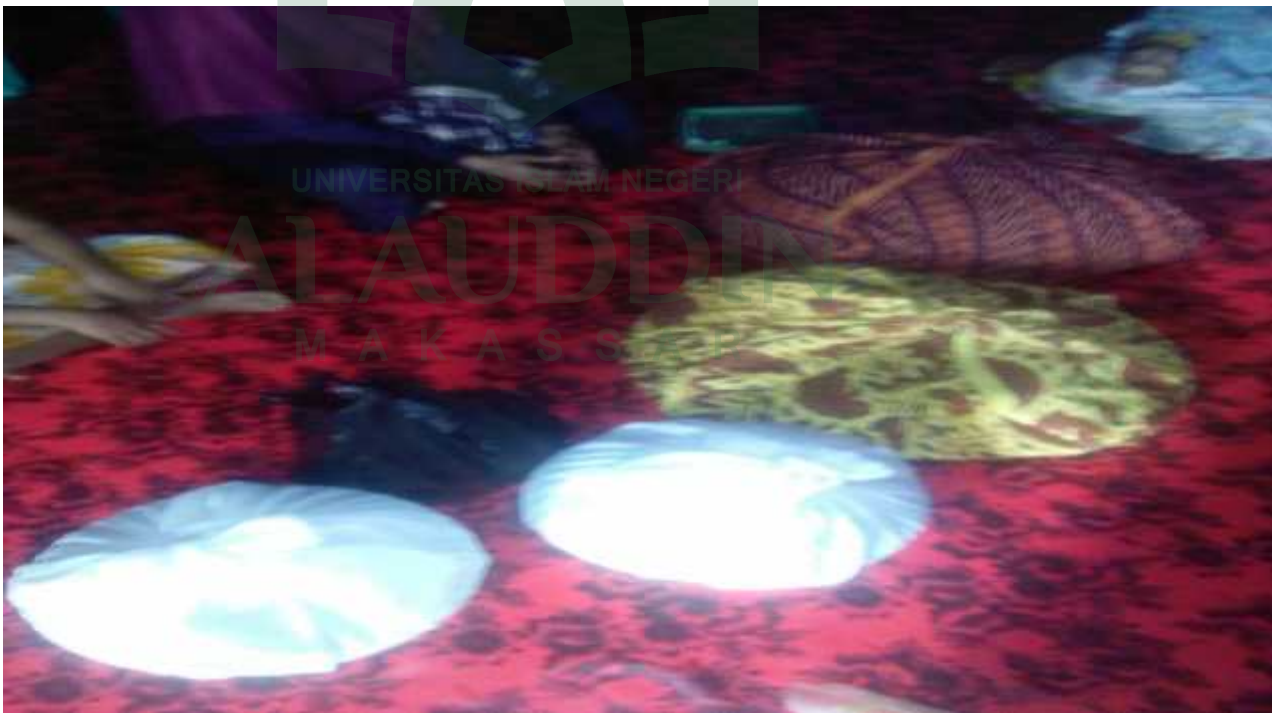
Makanan makanan yang di pasoro