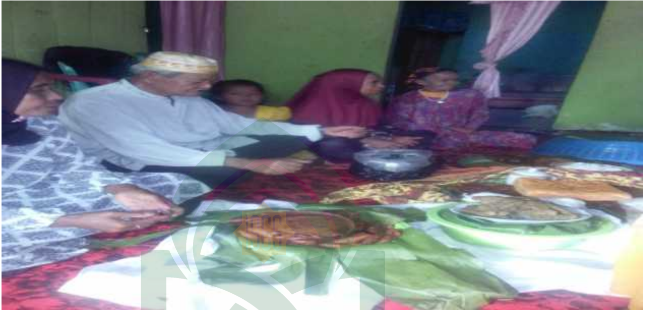
Di bacakan Doa di rumah Imam Syara'