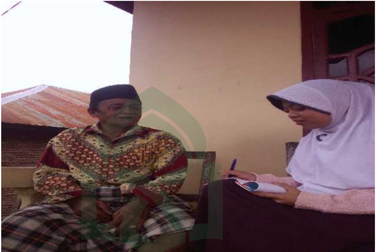
Wawancara dengan tokoh masyarakat