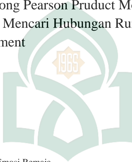
Deskriptif Kematangan Emosi Remaja