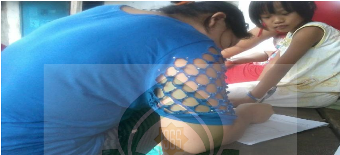
Gambar 1 Pengisian Koesioner Oleh Orang Tua di RT 1