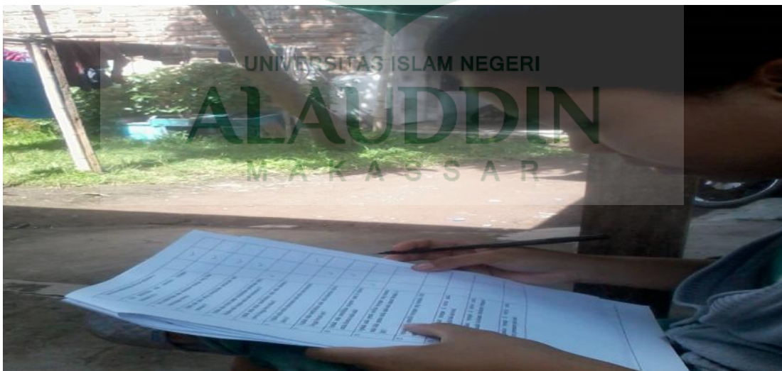
Gambar 2 Pengisian Koesioner oleh Orang Tua di RT 2