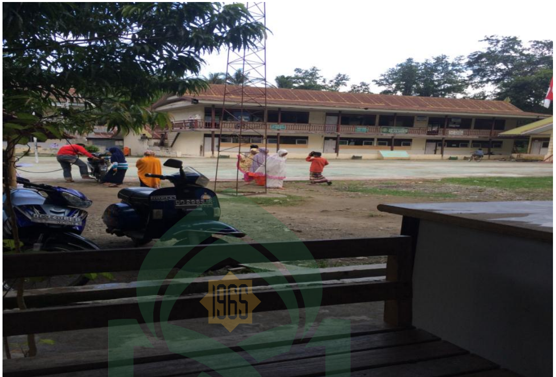
Lingkungan Pondok Pesantren Ihyaul 'Ulum DDI Baruga Kecamatan Banggae Timur Kabupaten Majene tanggal 4 Maret 2016

UNIVERSITAS ISLAM NEGERI ALAUDDIN M A K A S S A R