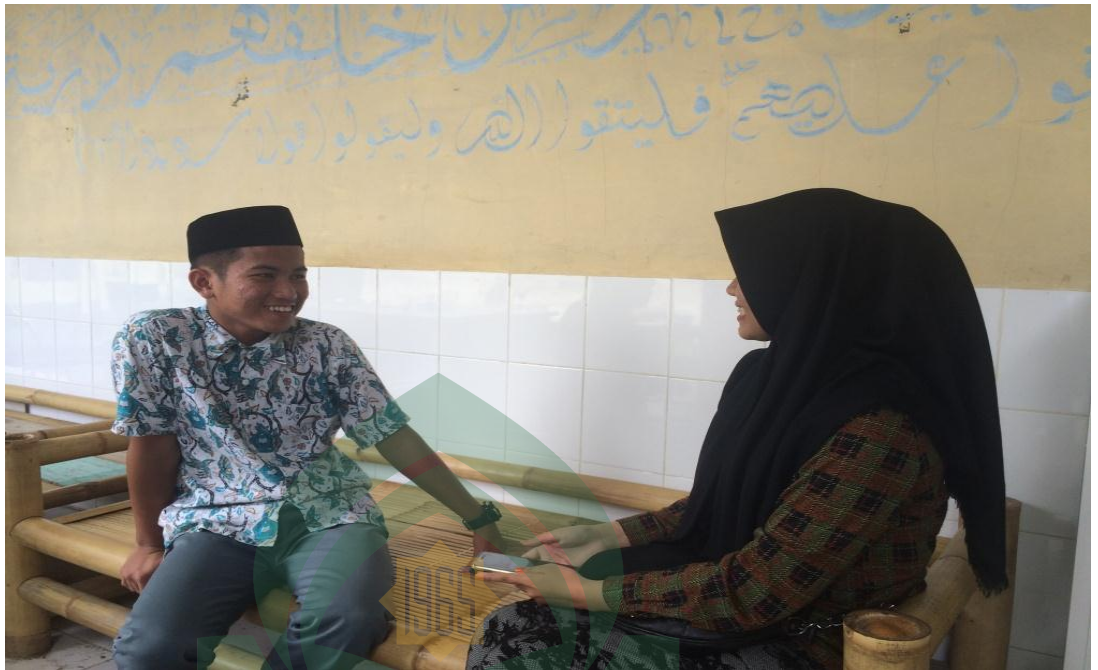
Wawancara dengan santri pondok pesantren Ihyaul 'Ulum DDI Baruga Kecamatan Banggae Timur Kabupaten Majene tanggal 5 Maret 2016