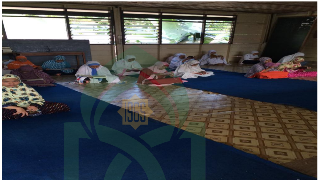
Pengajian Santriwati Pondok Pesantren Ihyaul 'Ulum DDI Baruga Kecamatan Banggae Timur Kabupaten Majene tanggal 3 Maret 2016

Pembina Mengajar Santri di Aula Pondok Pesantren Ihyaul 'Ulum DDI Baruga Kecamatan Banggae Timur Kabupaten Majene tanggal 3 Maret 2016