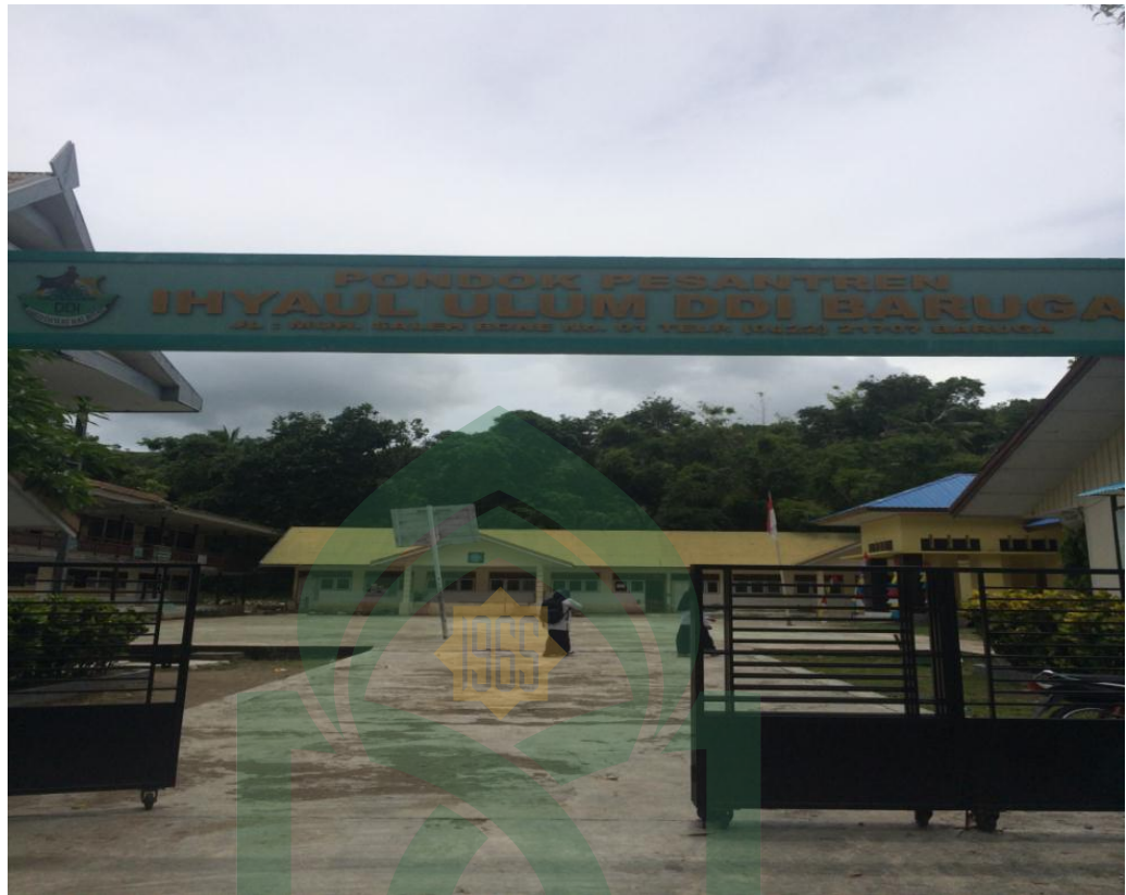
Pintu Gerbang Pondok Pesantren Ihyaul 'Ulum DDI Baruga Kecamatan Banggae Timur Kabupaten Majene tanggal 2 Maret 2016

UNIVERSITAS ISLAM NEGERI ALAUDDIN M A K A S S A R