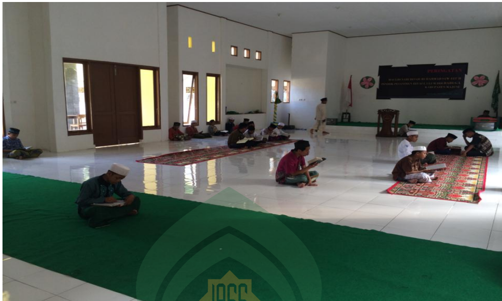
Proses pengajian santri Pondok Pesantren Ihyaul 'Ulum DDI Baruga Kecamatan Banggae Timur Kabupaten Majene tanggal 3 Maret 2016