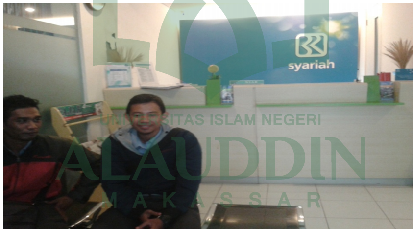
Gambaran keadaan Bank BRI Syariah KCP Sungguminasa