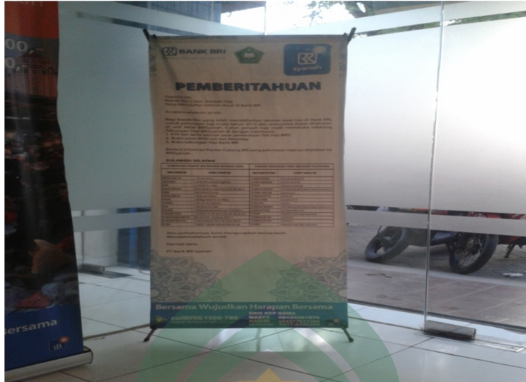
Gambaran persyaratan pemberian pembiayaan