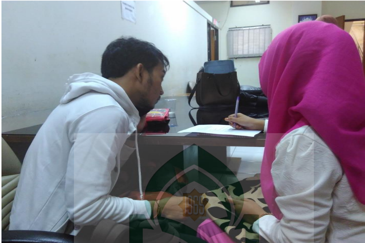
Wawancara dengan Mahasiswa Fakultas Dakwah dan Komunikasi