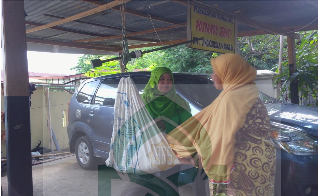
Imunisasi dan pemberian Vitamin kepada anak balita