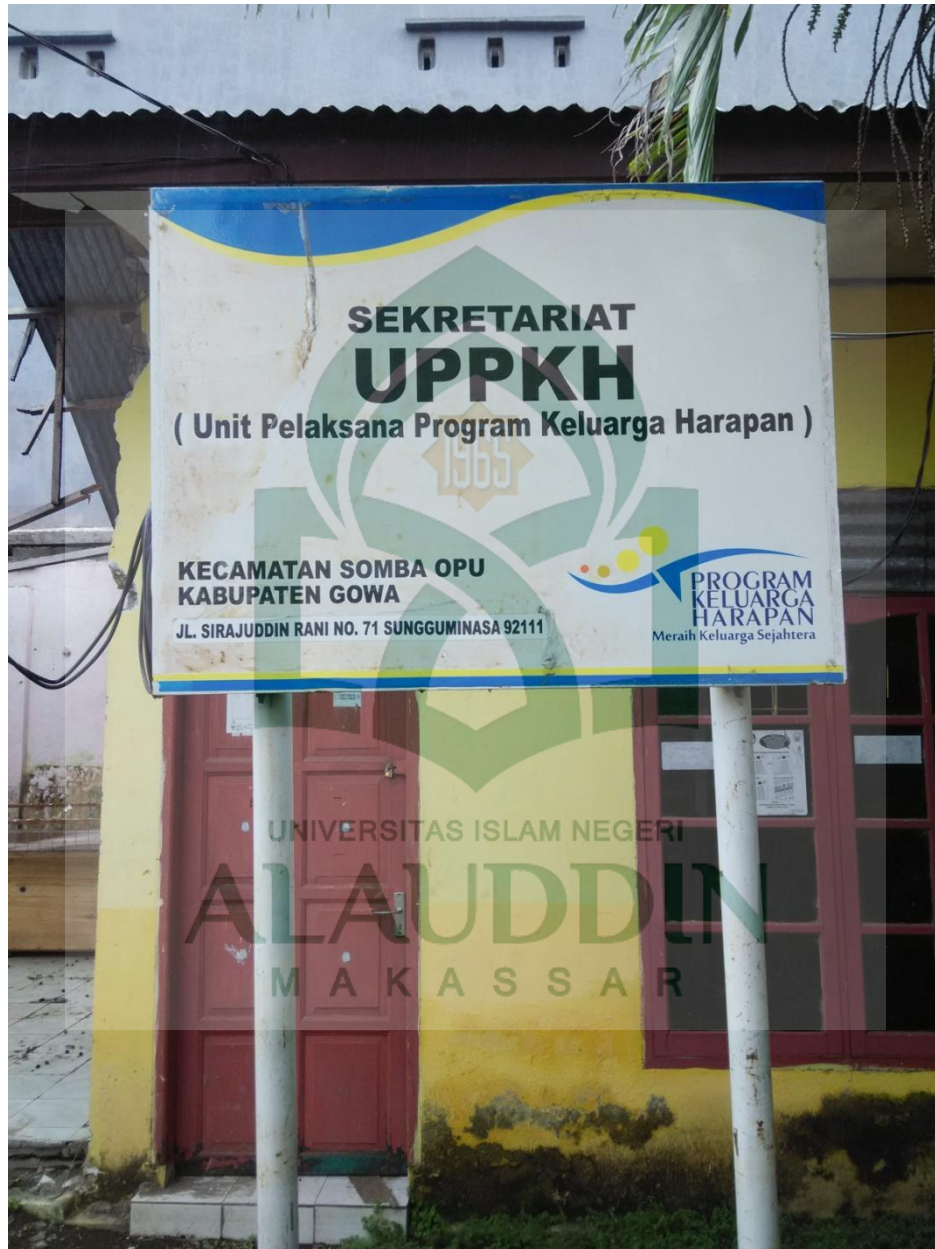
Sekretariat Unit Pelaksana Program Keluarga Harapan