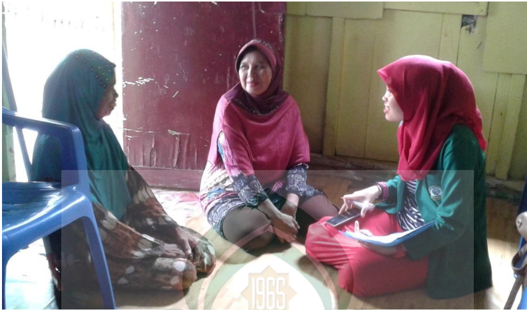
Wawancara dengan peserta PKH