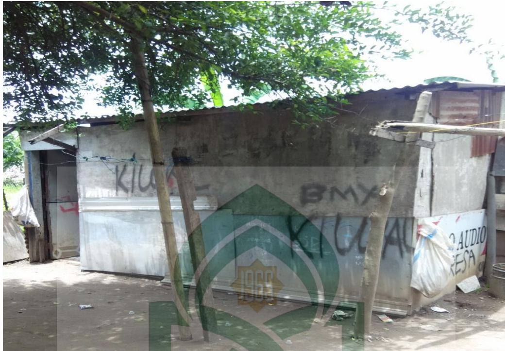
Rumah penerima bantuan PKH