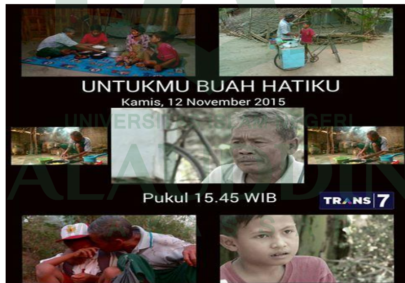
Gambar 1.4 : Gambar Narasumber Program “Orang Pinggiran”