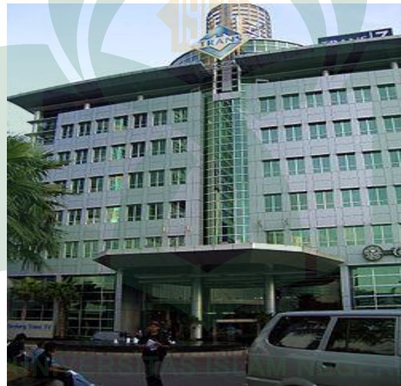
Gambar 4.4 : Gedung stasiun Trans7

Berikut ini gambar gedung official Trans Corp yang juga merupakan gedung official Trans7 pusat Jakarta