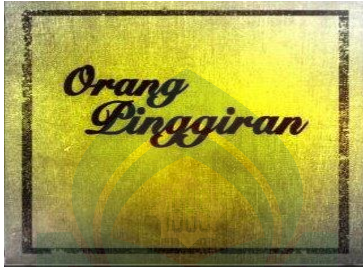
Gambar 1.1 : Logo Program Orang Pinggiran 2010-2013