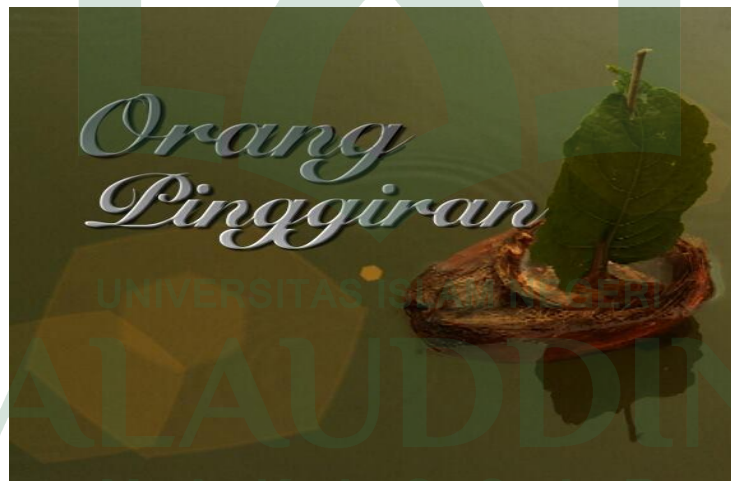
Gambar 1.2 : Logo Program Orang Pinggiran 2013 - Sekarang