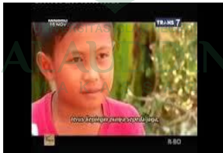
Gambar 1.3 : Gambar Narasumber Program “Orang Pinggiran”