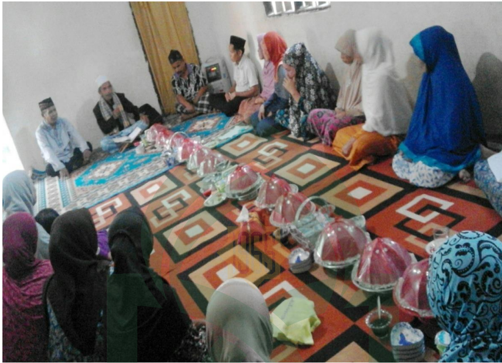
Pengajian Rutin Majelis Taklim Annisa' di rumah anggota 15 Februari 2016