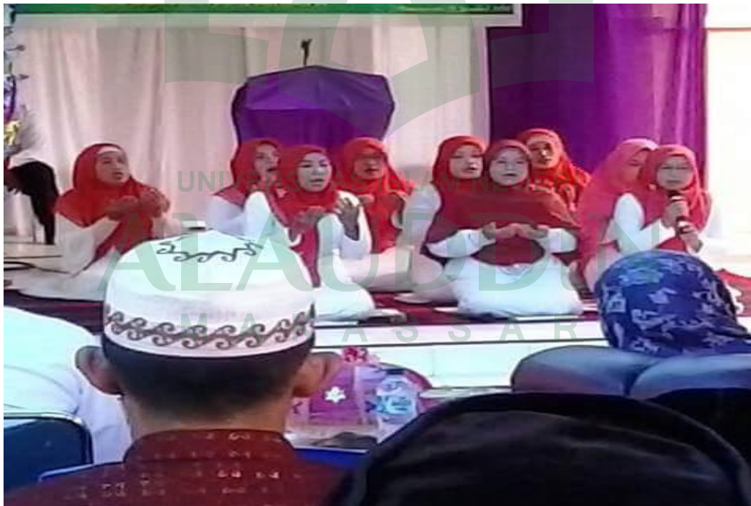
Perlombaan Salawat tingkat Kecamatan Tammerodo' Sendana Tanggal 21 Juni 2015