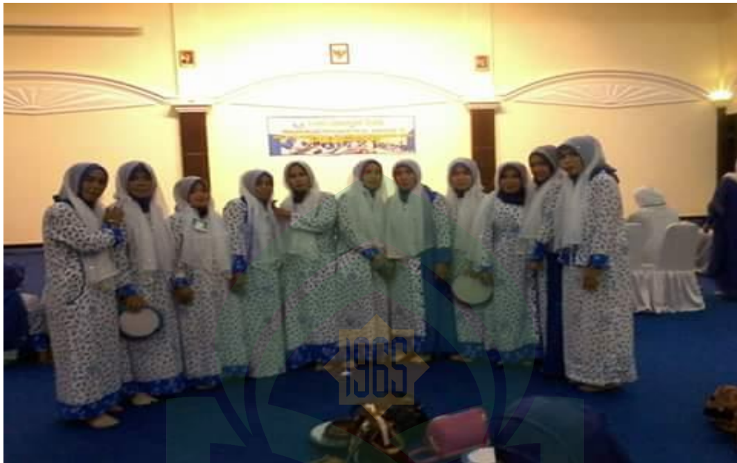
Lomba Qasidah rebana tingkat Provinsi Sulawesi Barat di Polewali Mandar Tanggal 29 November 2015