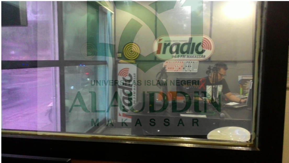
(Gambar 2: Saat Program Sorelam On Air)