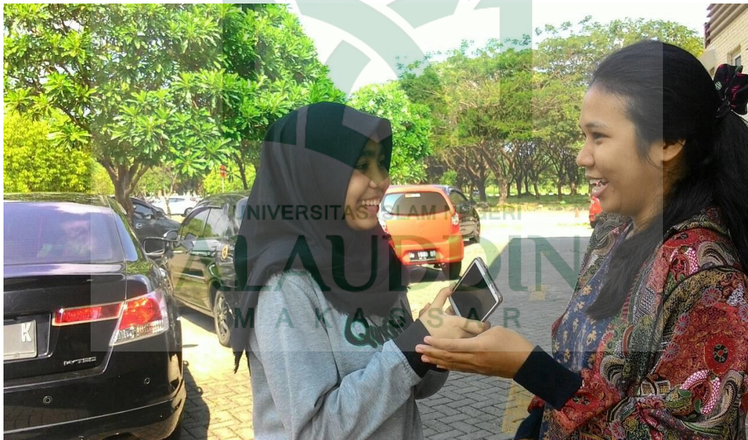
(Gambar 5: Wawancara dengan pendengar Sorelam I-Radio Makassar)