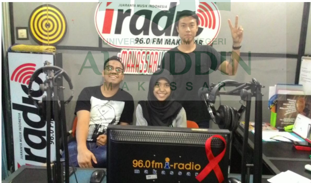
(Gambar 4 : Foto Bersama dengan crew I-Radio Makassar)