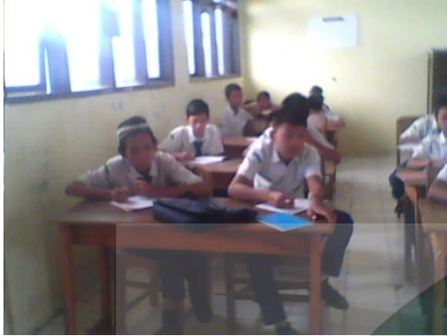
Kondisi pada saat pemberian pretest