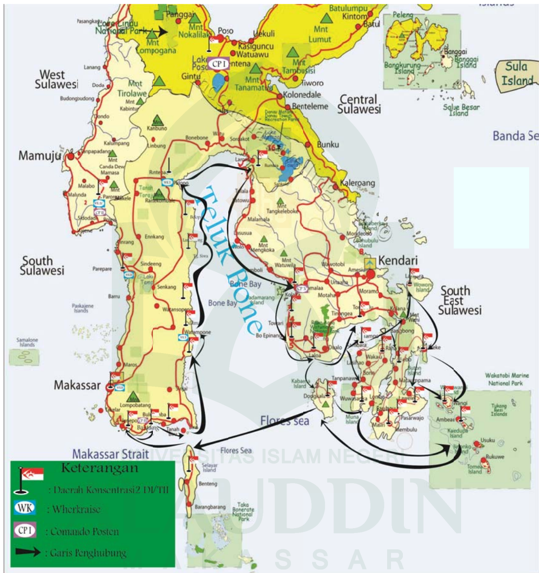
Gambar. 3 Peta Gerilya Laut DI/TII di kawasan Teluk Bone Dan Perairan Sekitar