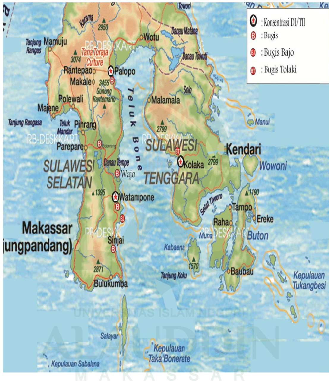
Gambar. 1 Peta Teluk Bone dan Persebaran Penduduk