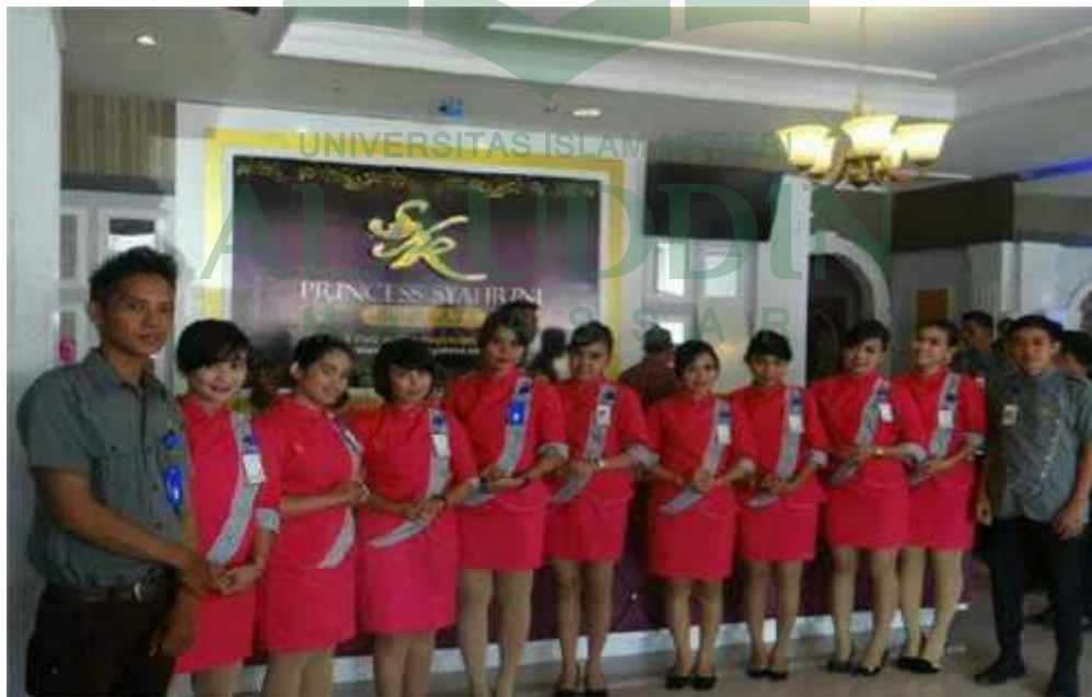
Para karyawan tempat karaoke Princess Syahrini