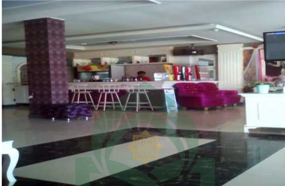
Loby tempat karaoke Princess Syahrini