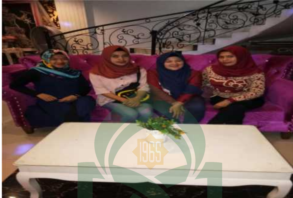
Penulis dan pengunjung , foto diambil setelah wawancara