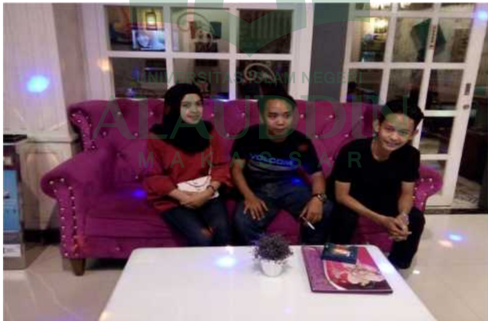
Penulis dan pengunjung, foto diambil setelah wawancara