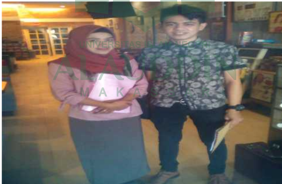
Penulis dan Dede (Kapten ditempat karaoke Princess Syahrini), foto diambil setelah wawancara