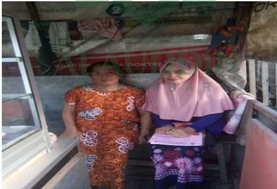
Penulis dan Dg Nurung (Pedagang kue), foto diambil setelah wawancara