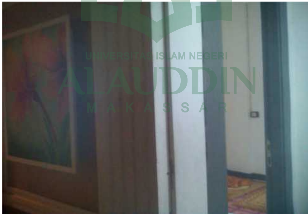
Mushallah tempat karaoke Princess Syahrini