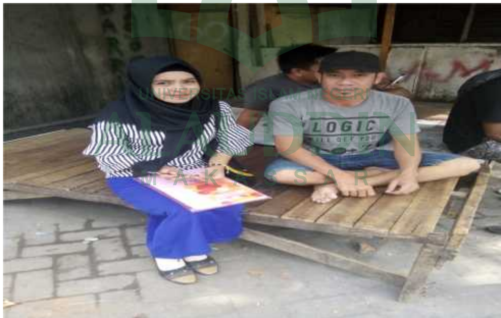
Penulis dan Junaedi (Masyarakat Kelurahan Mangasa), foto diambil setelah wawancara