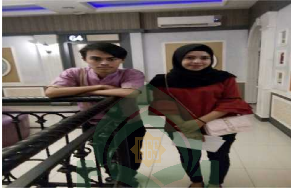
Penulis dan Asrul ( Reception ), foto diambil setelah wawancara