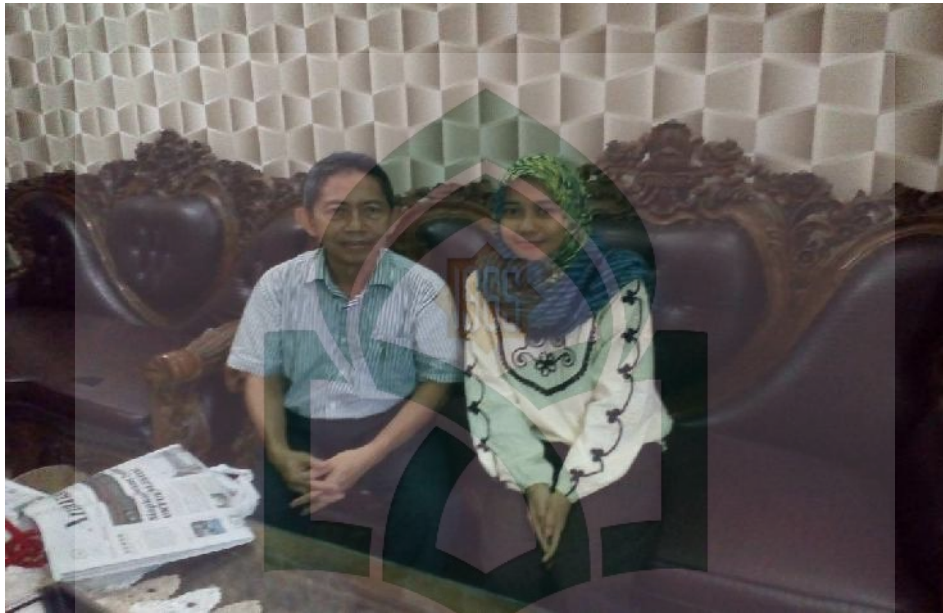
Foto bersama setelah berbincang-bincang di kediaman beliau.

UNIVERSITAS ISLAM NEGERI ALAUDDIN M A K A S S A R