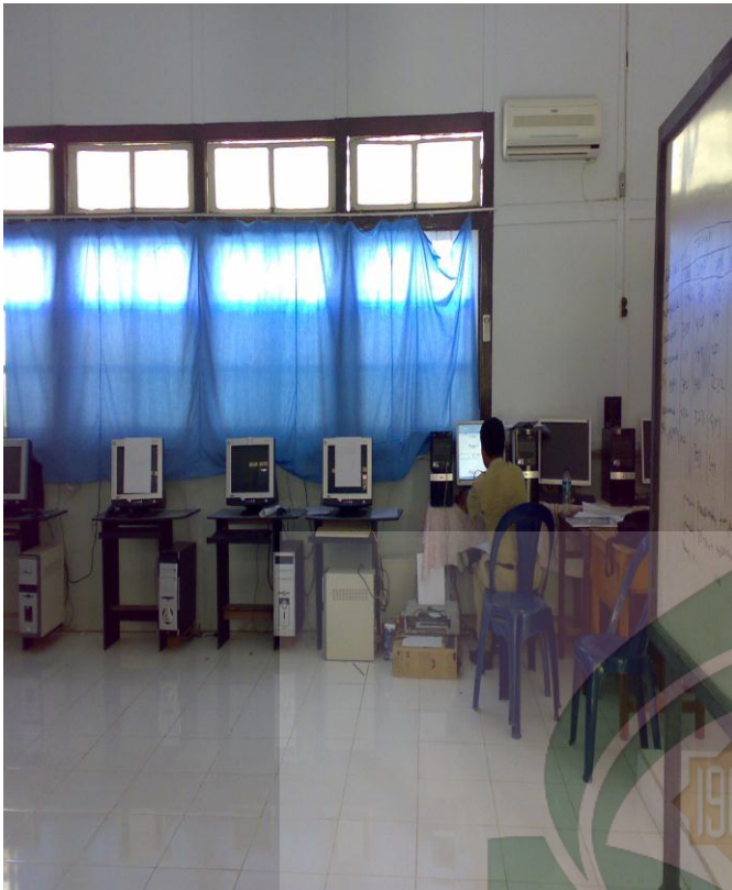
Ruangan lab komputer SMP Negeri 1 Namlea