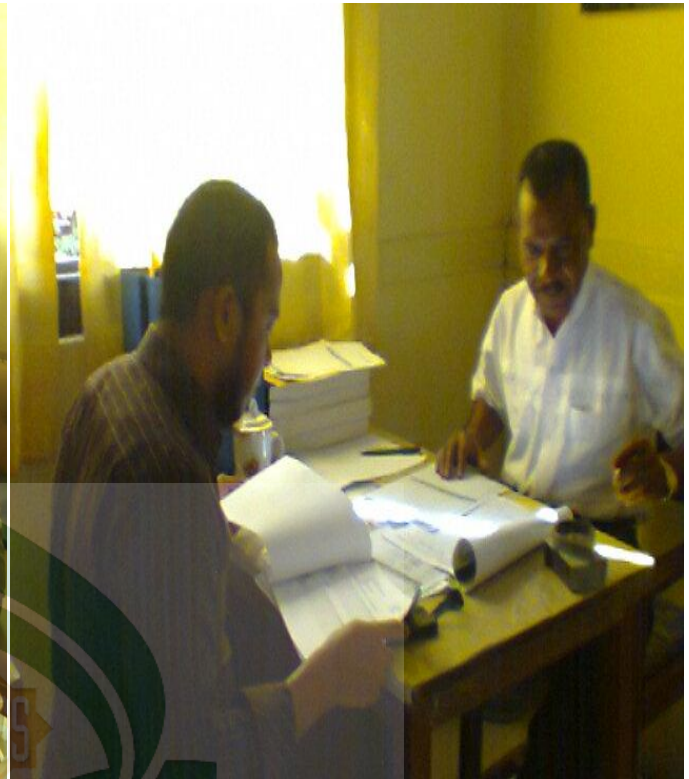
Foto pengambilan sumber data dokumentasi sekolah di ruang tata usaha dan wawancara