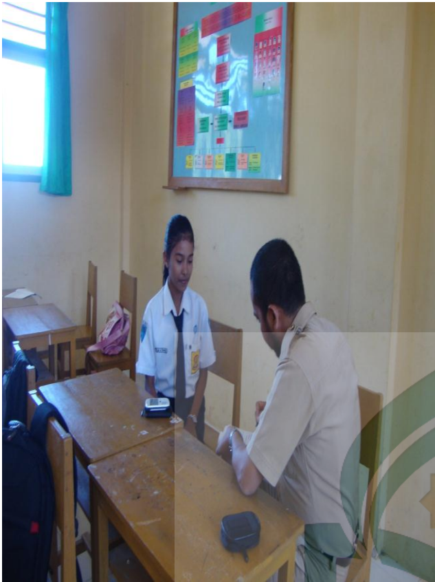
Foto wawancara siswi, tanggal 28 Februari 2012