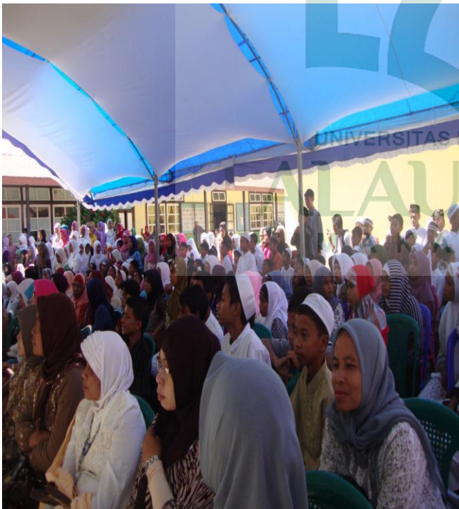
Peringatan Maulid Nabi Muhammad saw di SMP N1 Namlea, tgl 18 Februari 2012