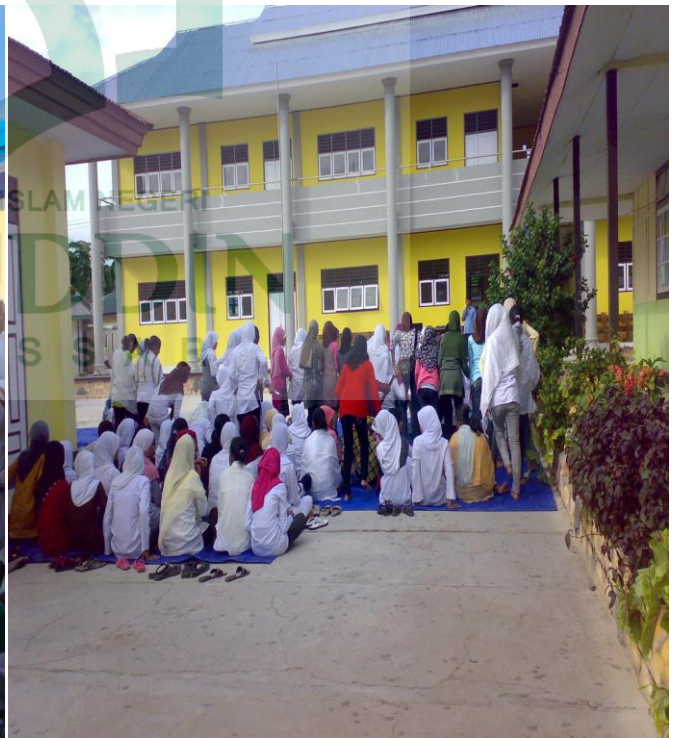
Dokumen sekolah persiapan zikir akhir Tahun di SMP N 1 Namlea