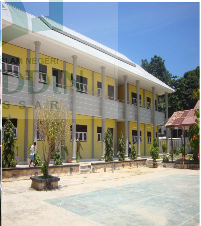
Gedung kelas SMP Negeri 1 Namlea