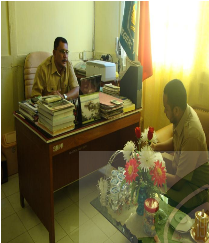
Foto wawancara Kepala Sekolah, tanggal 21 Februari 2012