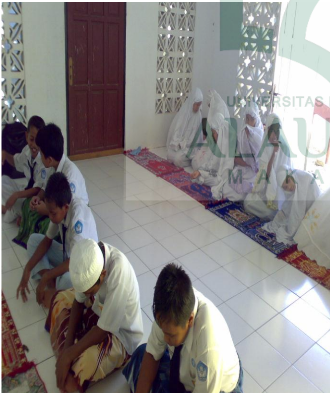
Siswa sedang menanti menjelang salat asar