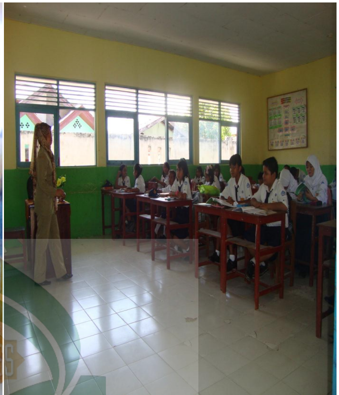
Foto observasi, guru PAI membuka proses pembelajaran di kelas