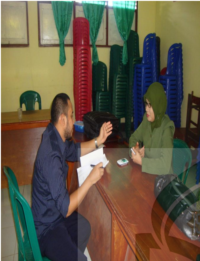
Wawancara guru PAI, tgl 20 Februari 2012