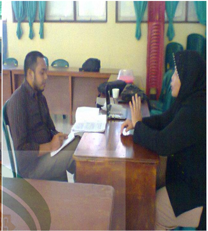
foto wawancara guru PAI, tanggal 24 Februari 2012