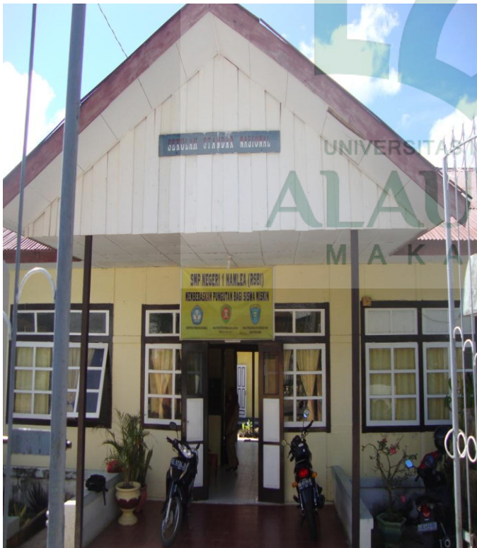
Kantor bagian depan SMP Negeri 1 Namlea