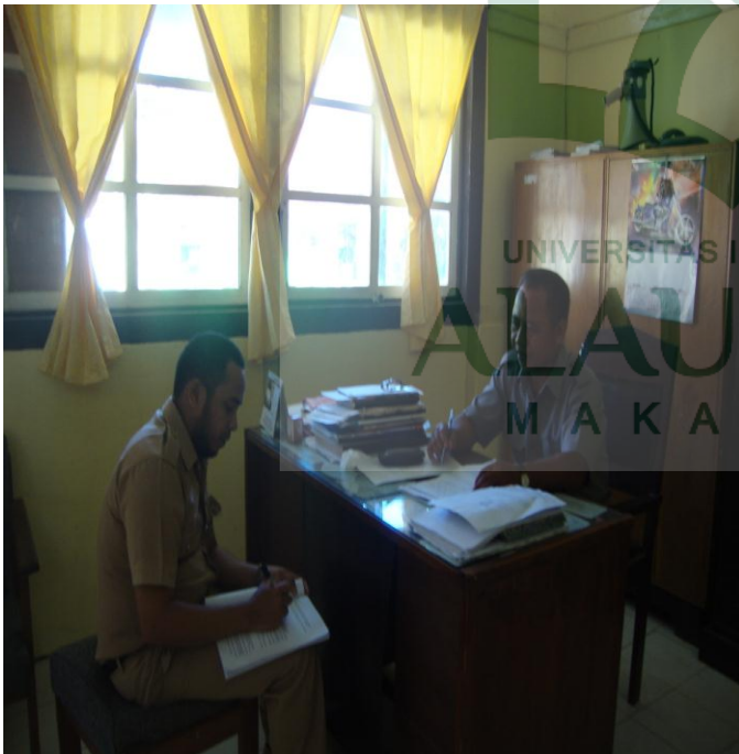
Wawancara Wakil Kepala Sekolah pada tgl 22 Februari 2012