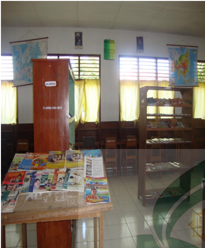
Ruang perpustakaan SMP N 1 Namlea