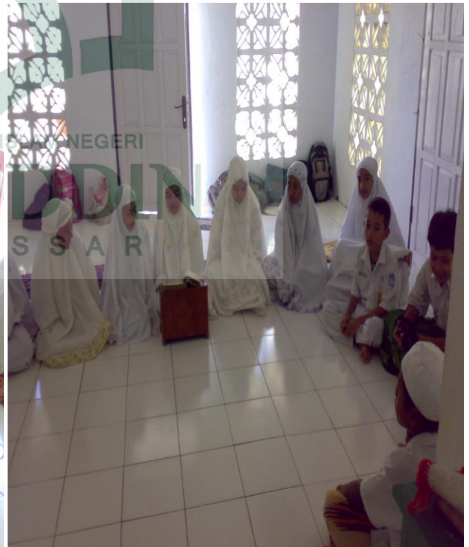
Siswa-siswi sip siang sedang mengaji menjelang salat dhuhur