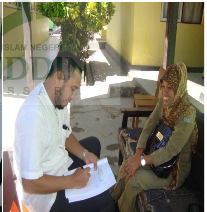
Foto wawancara Guru PAI, tgl 5 Maret 2012