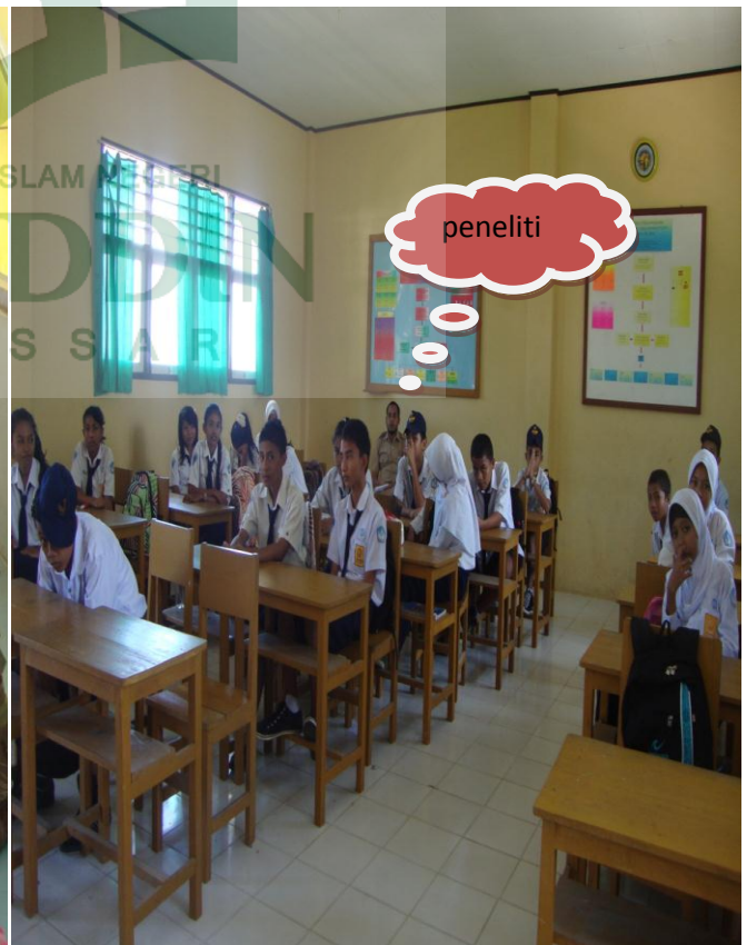
Foto observasi proses pembelajaran PAI di kelas