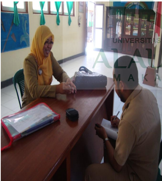
Foto wawancara Guru SMP, tgl 28 Februari 2012