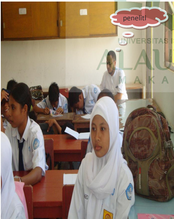
Foto observasi proses pembelajaran PAI di kelas