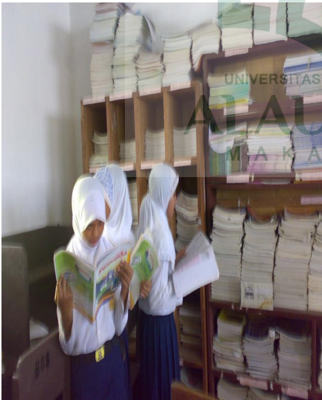
Siswa-siswi sedang mencari buku di perpustakaan SMP N 1 Namlea