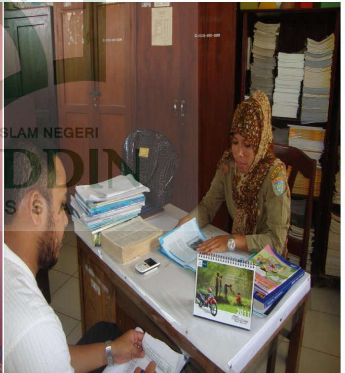
Foto wawancara guru PAI, tanggal 25 Februari 2012