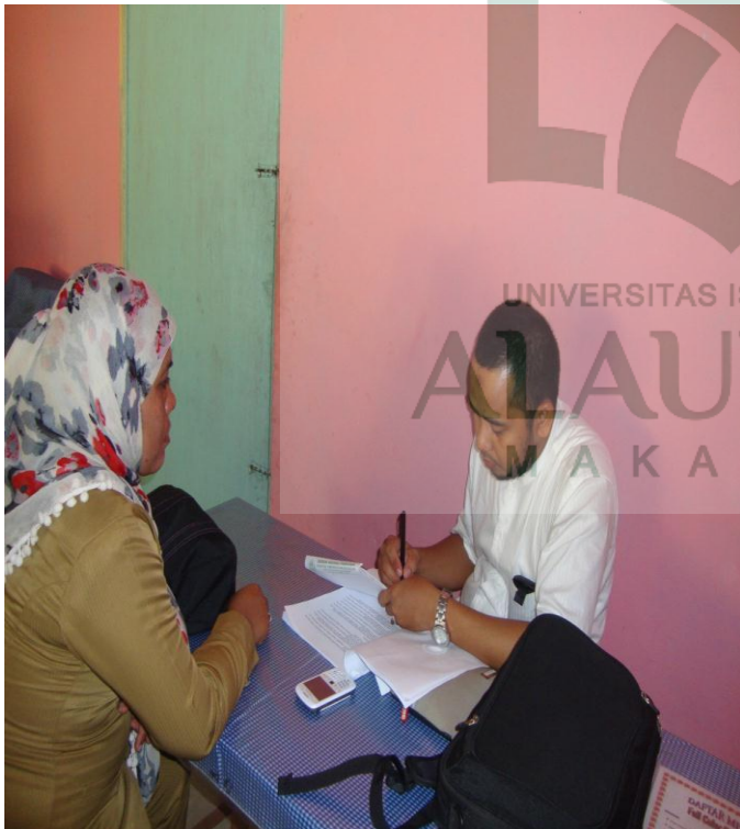
Foto wawancara Guru PAI, tanggal 25 Februari 2012