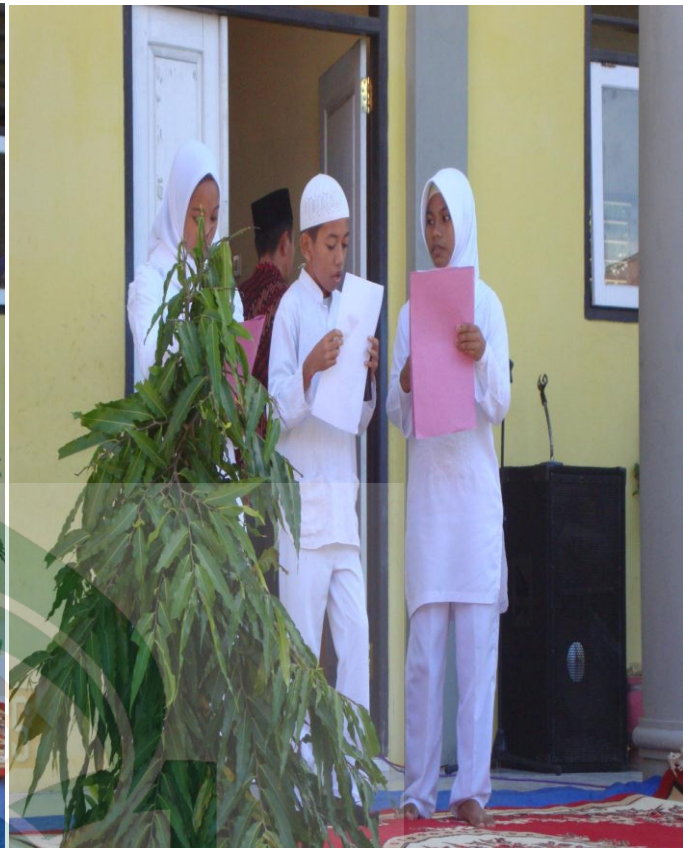
Foto pembacaan puisi siswa siswi pada peringatan maulid Nabi Muhammad SAW di SMP N1 Namlea, tgl 10 Februari 2012