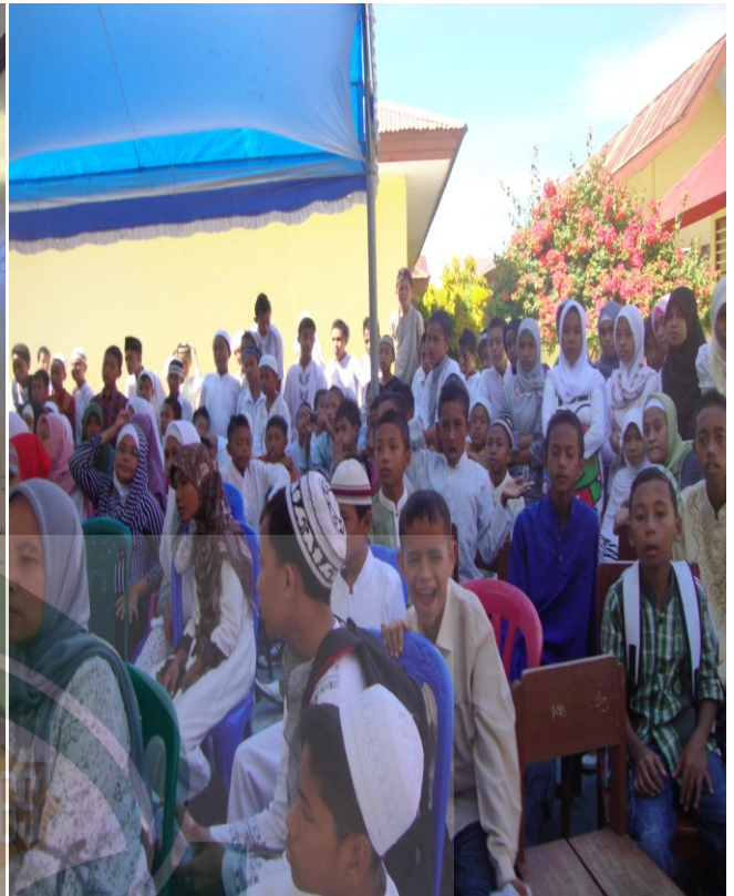
Foto peringatan Maulid Nabi Muhammad SAW di SMP N1 Namlea, tgl 18 Februari 2012