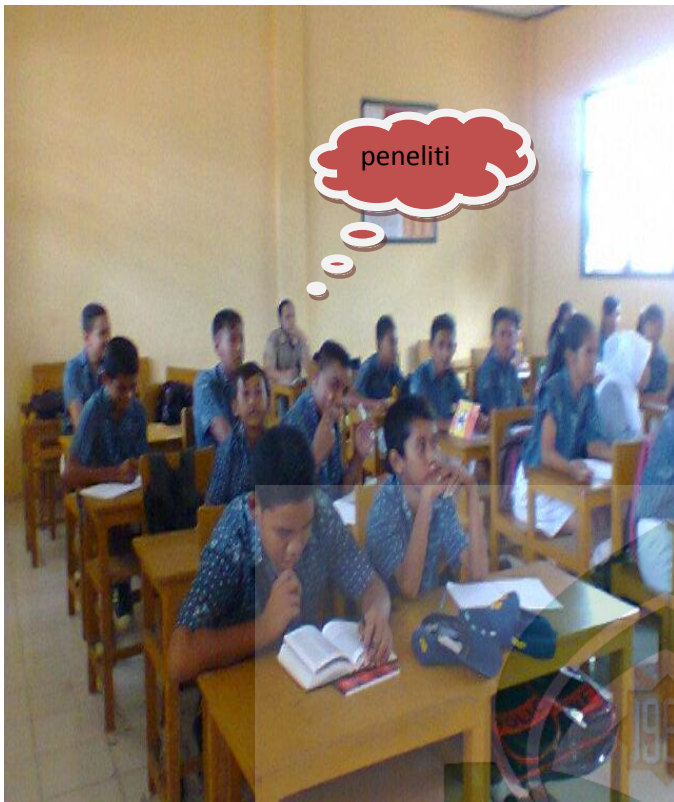
Foto observasi proses pembelajaran PAI di kelas