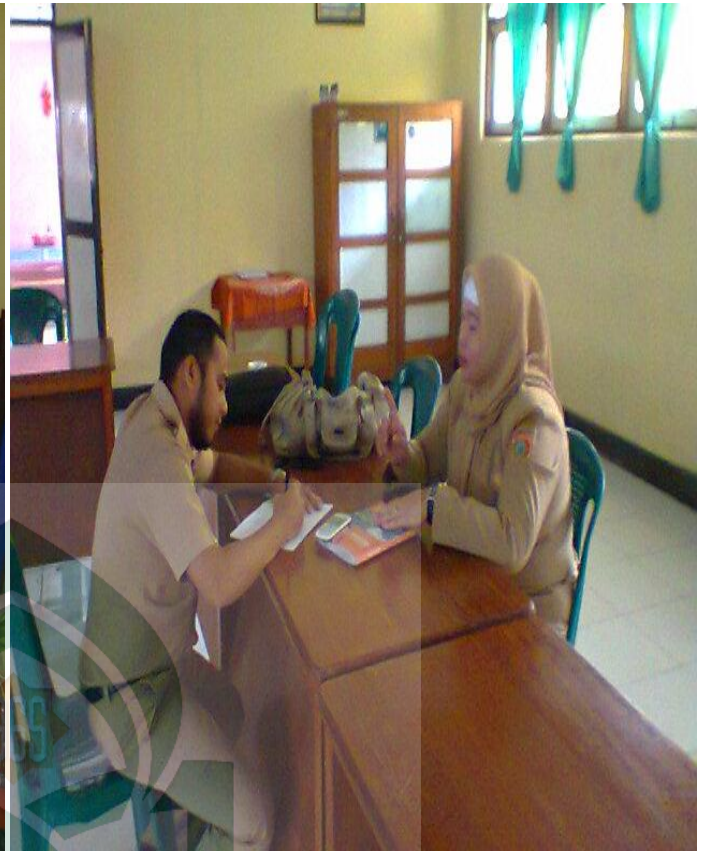
Wawancara guru PAI, tgl 6 Maret 2012