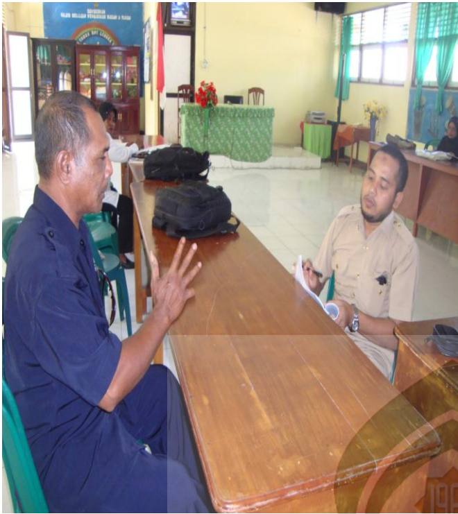
Wawancara Wakasek Sarana Prasarana pada Tgl 22 Februari 2012