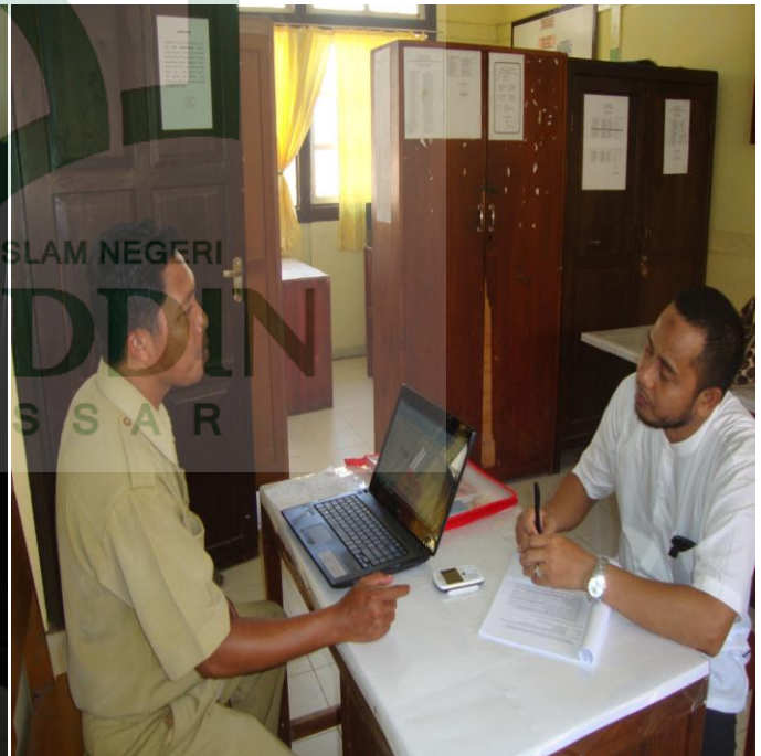
Wawancara Wakasek Kurikulum 25 Februari 2012