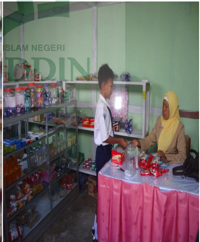
Siswa sedang berbelanja di Koprasi/kios sekolah SMP N 1 Namlea