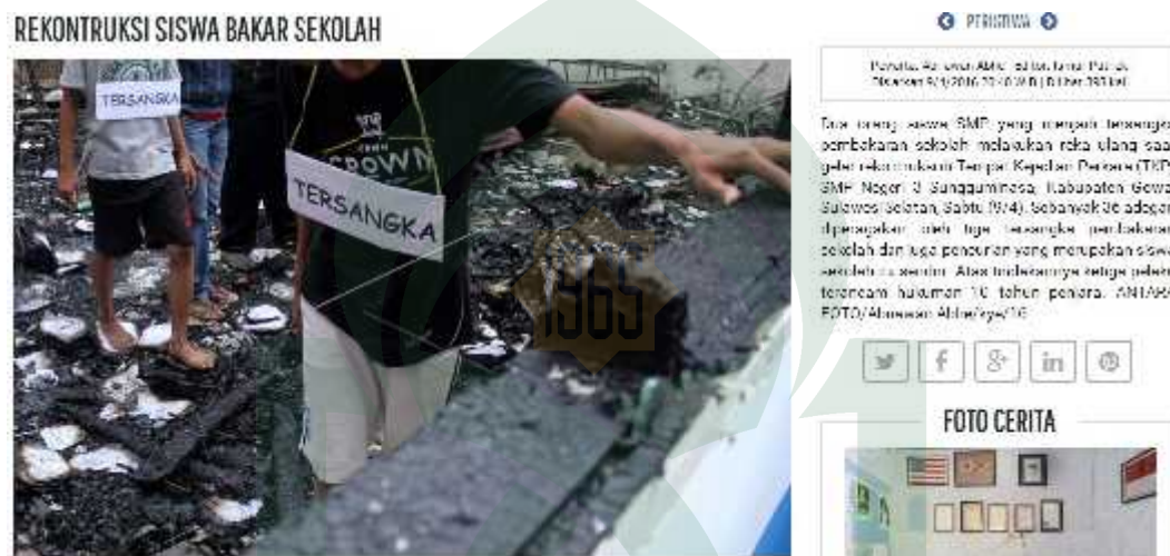
Gambar 4.6 Foto berita “Rekontruksi Siswa Bakar Sekolah”

Contoh kasus dari foto Abriawan Abhe yang berjudul “Rekontruksi Siswa Bakar Sekolah”. Abhe mengaku tidak menampilkan wajah tersangka pembakaran. Kedua nama tersangka pun tidak dicantumkan dalam keterangan fotonya. “Ini kan anak-anak kasian , jadi saya tidak tampilkan mukanya, ini untuk menjaga privasinya. Tapi adaji simbol bahwa mereka tersangka.”