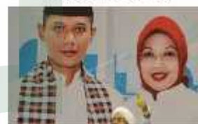
Gambar 4.11 Foto berita “Kejari Geledah Kantor Diskominfo”