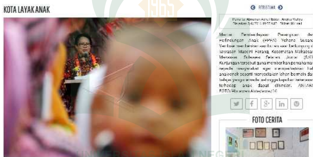
Gambar 4.9 Foto berita “Kota Layak Anak”

Seperti fotonya yang memotret Menteri Pemberdayaan Perempuan dan Perlindungan Anak (PPPA) Yohana Susana Yembise saat melakukan sosialisasi di Makassar. Menentukan titik fokus pada tokohnya dengan latar depan seorang anak yang dibuat blur atau tidak fokus. Latar depan seorang anak ini bukan tanpa maksud, melainkan memiliki hubungan dengan tokoh yang bersangkutan. Yakni seorang Menteri PPPA.