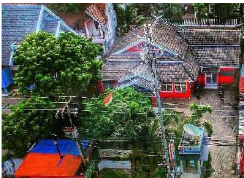
Gambar 4.1 Kantor berita Antara biro Sulsel