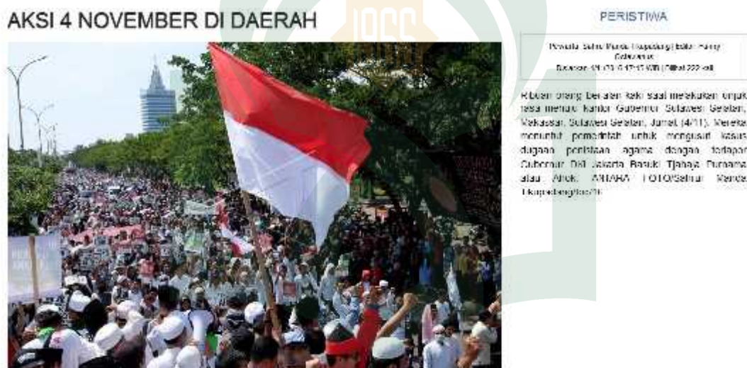
Gambar 4.7 Foto berita “Aksi 4 November di Daerah”

Sangat jelas bahwa Sahrul tidak menggiring atau mempengaruhi masyarakat dari foto yang ia ambil dalam aksi ini.