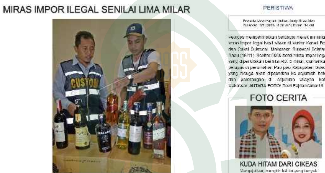
Gambar 4.10 Foto berita “Miras Impor Ilegal Senilai Lima Milyar”

Contoh foto berita dari Dewi Fajriani yang berjudul “Miras Impor Ilegal Senilai Lima Miliar.”