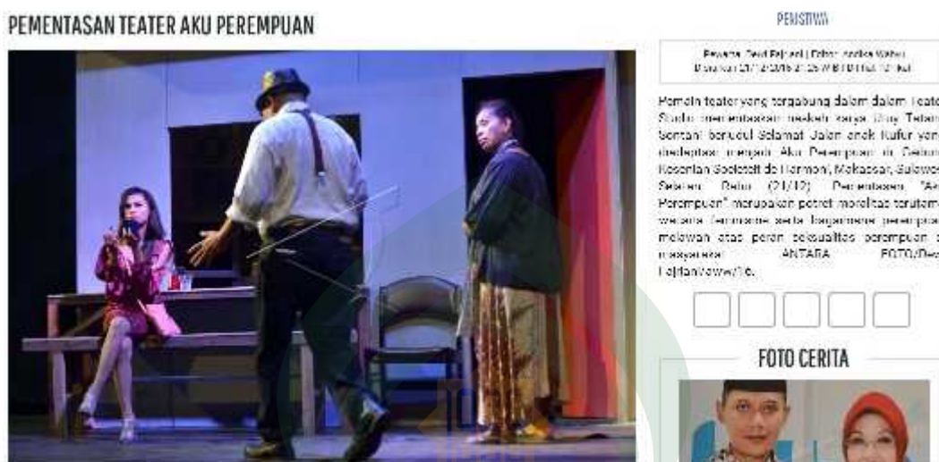
Gambar 4.16 Foto berita “Pementasan Teater Aku Perempuan”

Terkait fotonya, karena teater ini tentang perempuan, makanya saya menampilkan unsur femininitas. Gaya duduknya dan perilaku yang sedang ia lakukan. Coba perhatikan, perilaku itu hanya dilakukan oleh seorang perempuan.