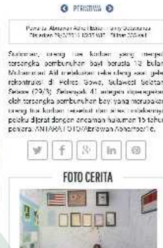
Gambar 4.17 Foto berita “Rekontruksi Pembunuhan Bayi di Gowa”