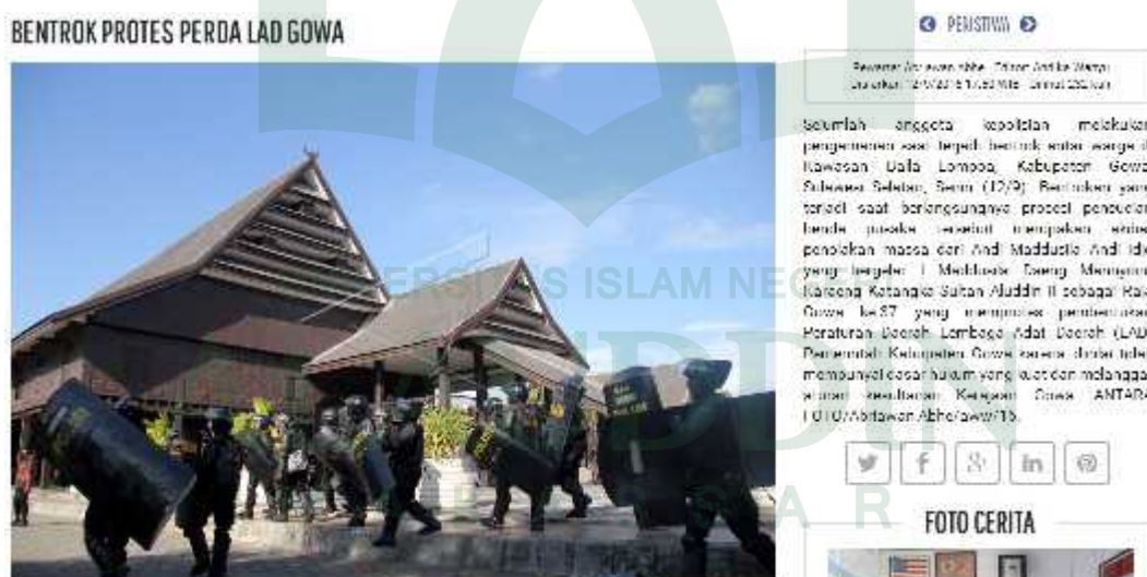
Gambar 4.12 Foto berita “Bentrok Protes Perda LAD Gowa”

Sebuah berita lebih menarik perhatian pembaca ketika berita tersebut lokasinya terjadi dekat dengan si pembacanya. Membuat si pembaca langsung sadar ketika melihat foto suatu peristiwa itu terjadi di dekatnya maka wartawan foto harus bisa mengambil gambar dengan menonjolkan icon dari daerah tersebut. Tetapi jika kita kesulitan untuk mencari icon daerah tersebut kita bisa perkuat oleh caption foto atau keterangan foto.