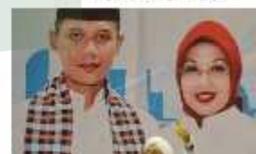
Gambar 4.15 Foto berita “Pendidikan Anak Suku Bajo”