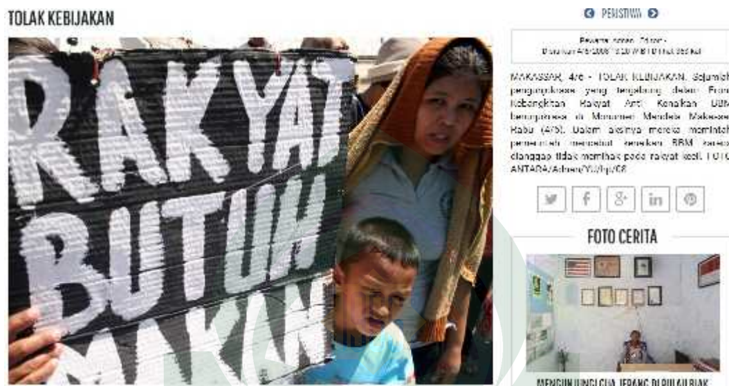
Gambar 4.14 Foto berita “Tolak Kebijakan”

kebijakannya masih mengedepankan kepentingan rakyat. Tapi untuk kesejahteraan rakyat memang harus memihak.