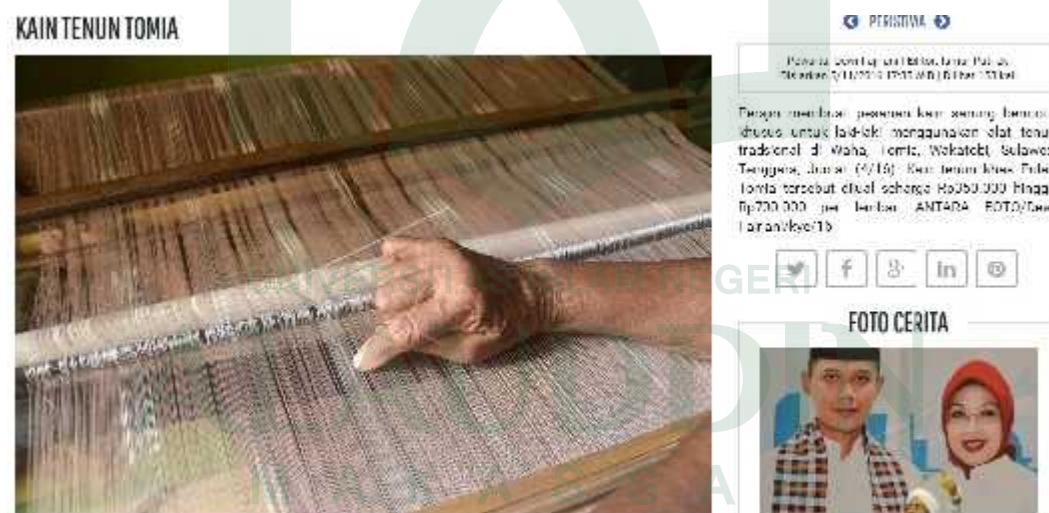
Gambar 4.5 Foto berita “Kain Tenun Tomia”

Terkait sudut pandang foto beritanya, Dewi mengatakan membuat foto detail dengan tangan kanan seorang pengrajin yang sedang menenun kainnya, karena dalam keterangan fotonya ia membahas soal motif.