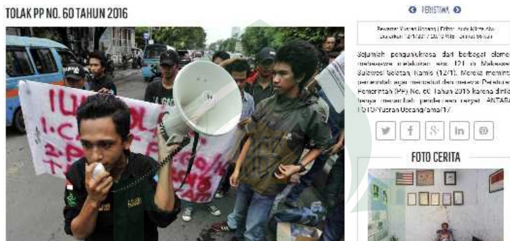
Gambar 4.19 Foto berita “Tolak PP No. 60 Tahun 2016”

Keempat wartawan foto Antara ini memiliki nilai positif tersendiri. Karena meski Antara sudah menjadi kantor berita milik pemerintah sejak tahun 1962,