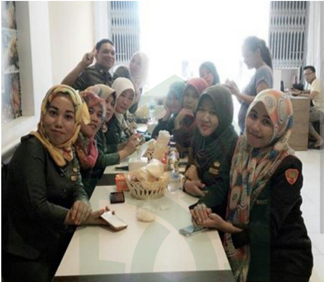
Kegiatan makan siang bersama di luar jam kerja.

UNIVERSITAS ISLAM NEGERI ALAUDDIN M A K A S S A R