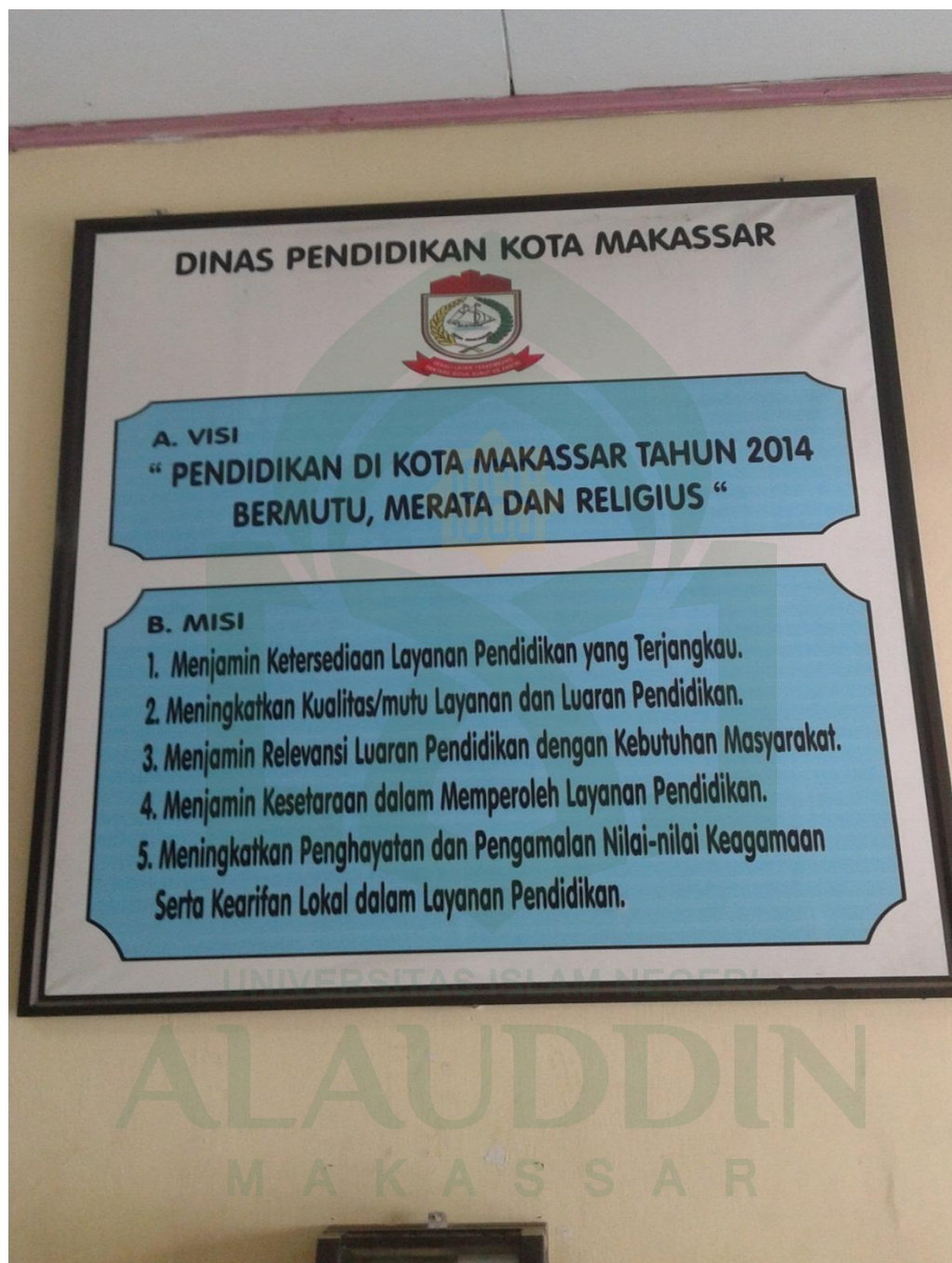
Visi dan Misi Dinas Pendidikan dan Kebudayaan Kota Makassar