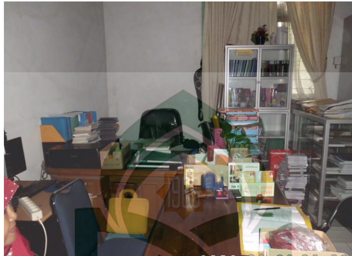
Ruang Pengolahan Bahan Pustaka I