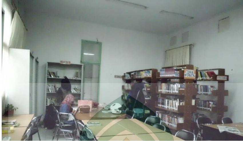
Kunjungan pemustaka I