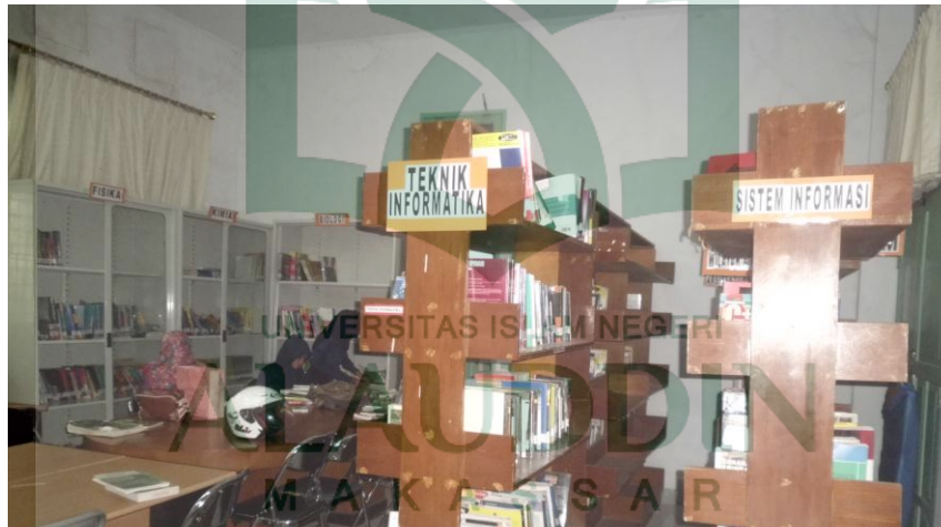
Kunjungan pemustaka II