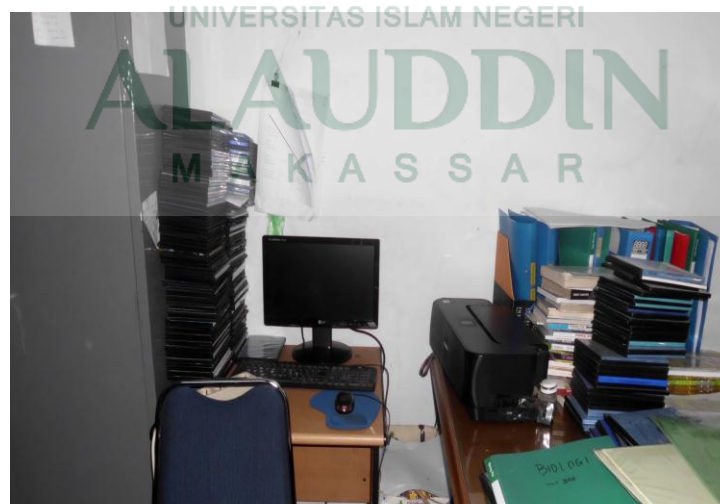
Ruang Pengolahan Bahan Pustaka II