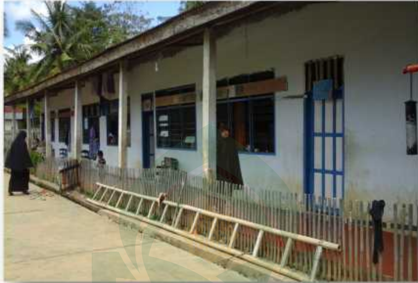
Asrama Putri Pondok Pesantren Darul Abrar