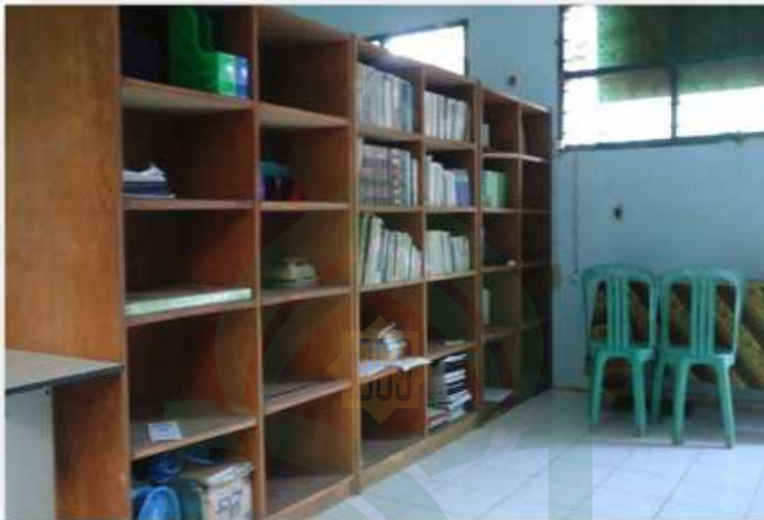
Kantor Pondok Pesantren Darul Abrar