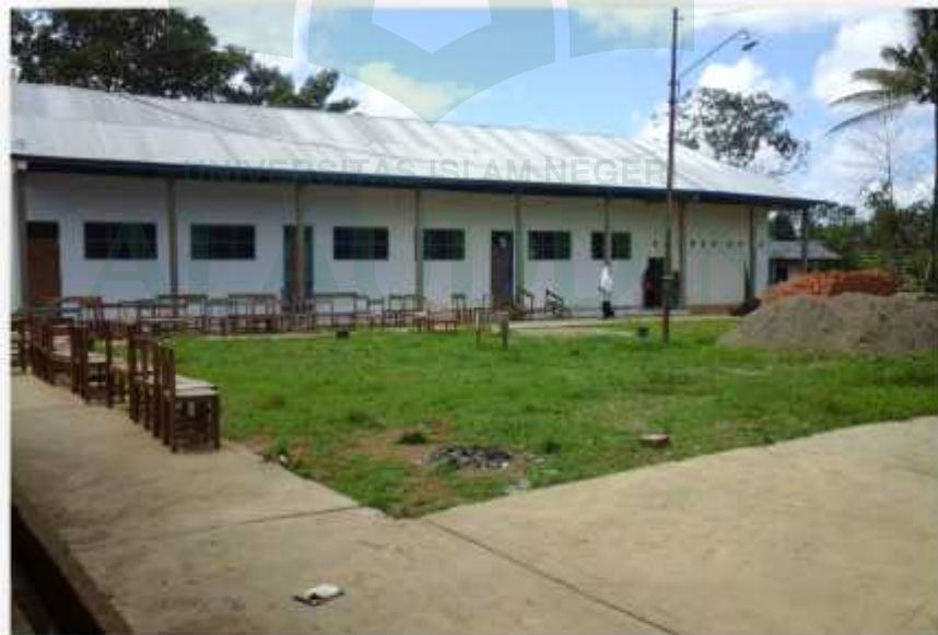
Ruang Belajar Pondok Pesantren Darul Abrar