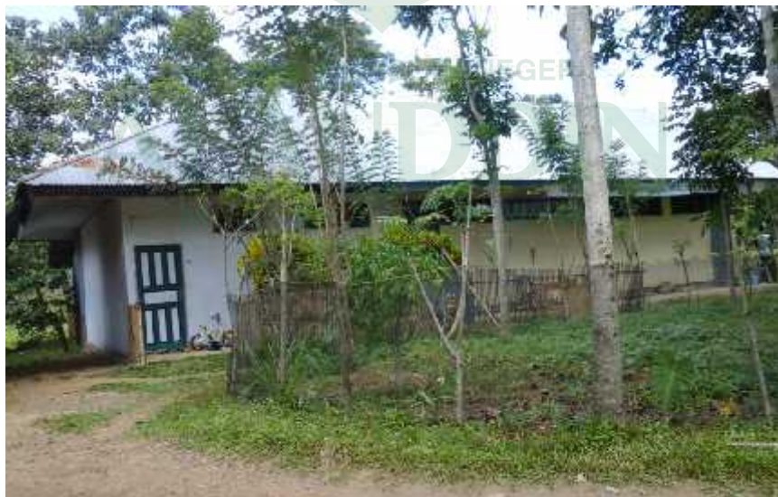
Laboratorium Pondok Pesantren Darul Abrar