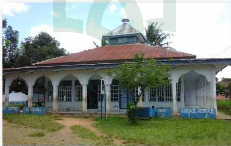
Mesjid Pondok Pesantren Darul Abrar