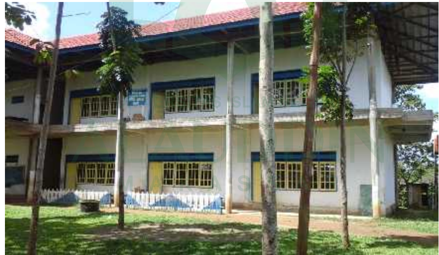
Kantor Organisasi Santri sekaligus Asrama Putra Pondok Pesantren Darul Abrar