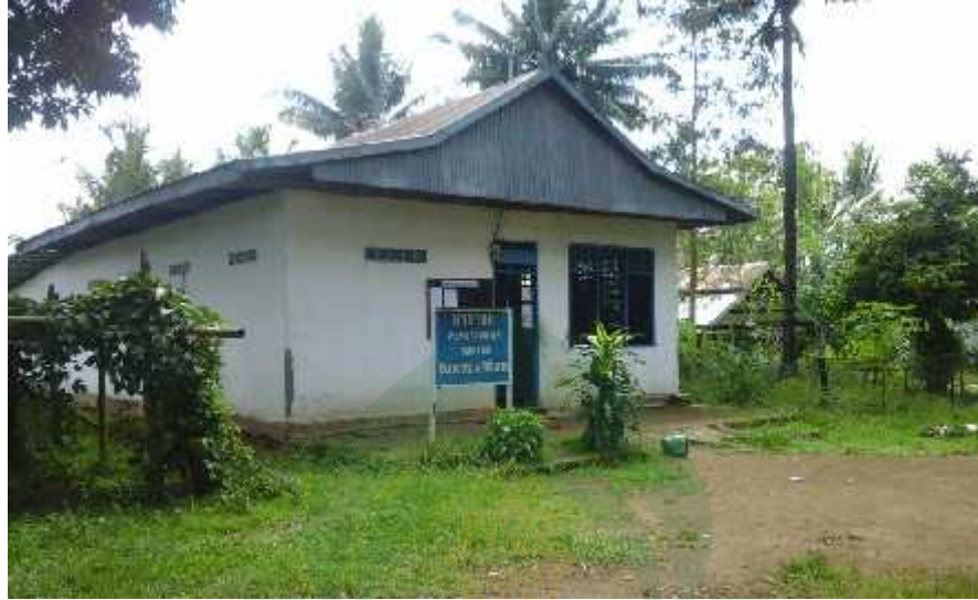
Kantor Pengasuh Pondok Pesantren Darul Abrar