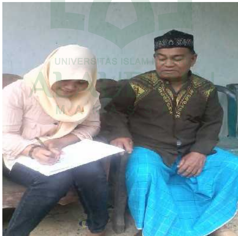
PIMPINAN PONDOK PESANTREN DARUL ARQAM MUHAMMADIYAH BALEBO