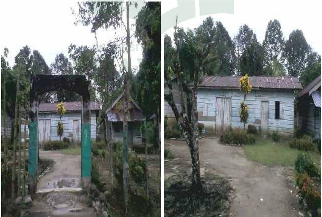
ASRAMA PUTRA DAN PUTRI