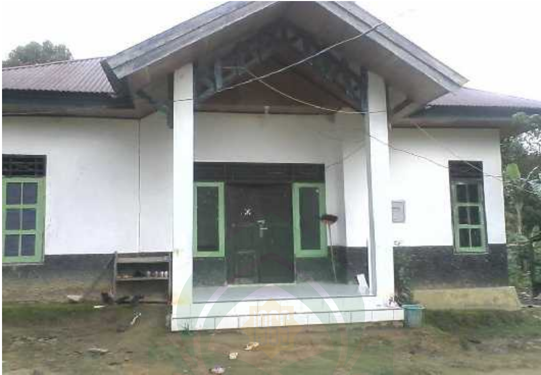
PANTI ASUHAN PESANTREN DARUL ARQAH MUHAMMADIYAH BALEBO