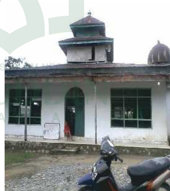
MASJID PONDOK PESANTREN MUHAMMADIYAH DARUL ARQAM BALEBO MASAMBA