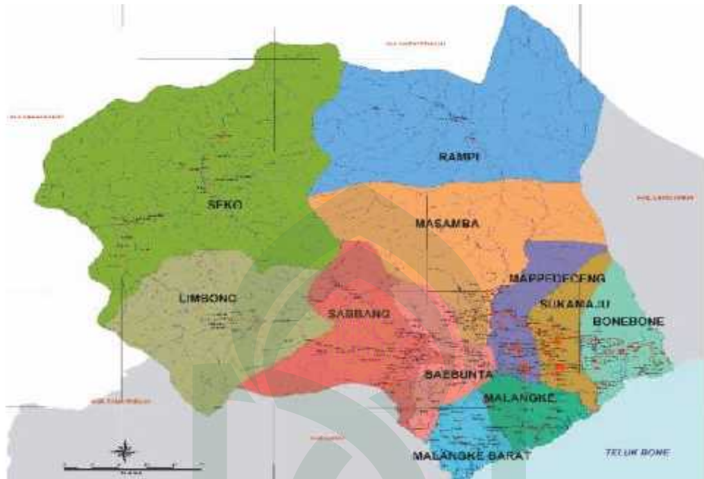
PETA KABUPATEN LUWU UTARA - MASAMBA