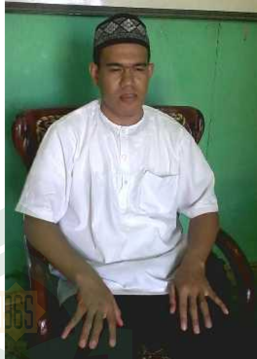
KEPALA SEKOLAH ALIYAH DAN TSANAWIYAH