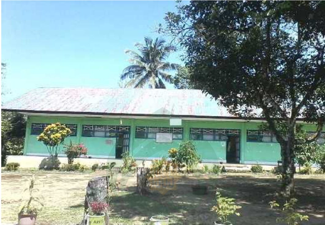
GEDUNG SEKOLAH TSANAWIYAH