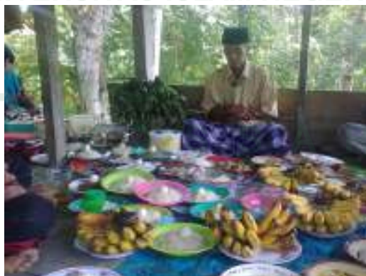
(Proses Mabbaca ketupat kosong)