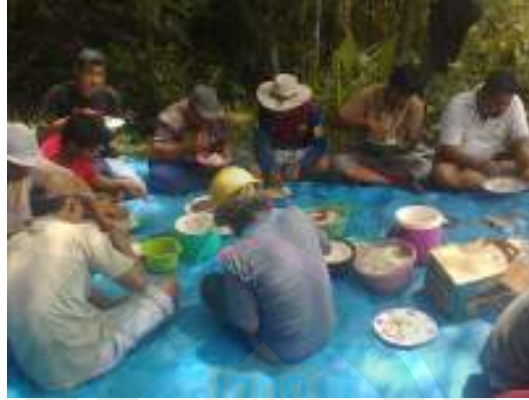
(Kegiatan Makan Bersama)