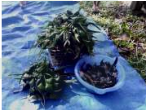
(Ketupat Kosong yang Diagikan kepada Petani)

UNIVERSITAS GUNUNGSIWA ALAUDDIN M A K A S S A R