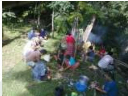
(Kegiatan mengolah Ayam secara Gotong-royong)