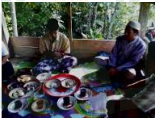
(Proses Mabbaca setelah pemotongan ayam)