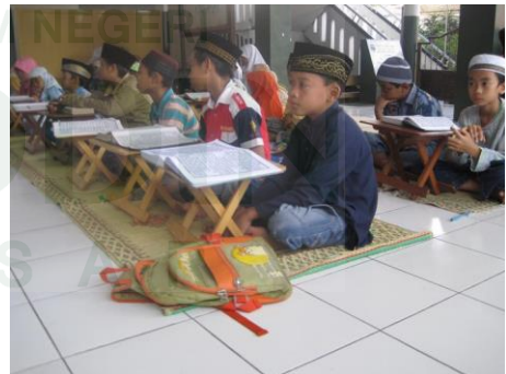
Santri TPA Masjid Besar Al-Amin