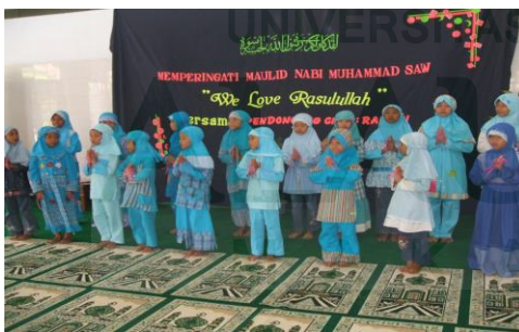
Santriwati TPA Masjid Besar Al-Amin