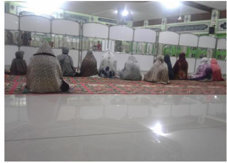
Jama'ah Magrib Perempuan