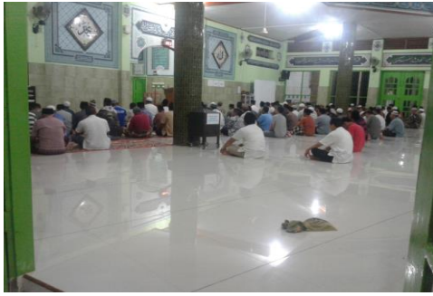
Jama'ah Magrib Laki-Laki