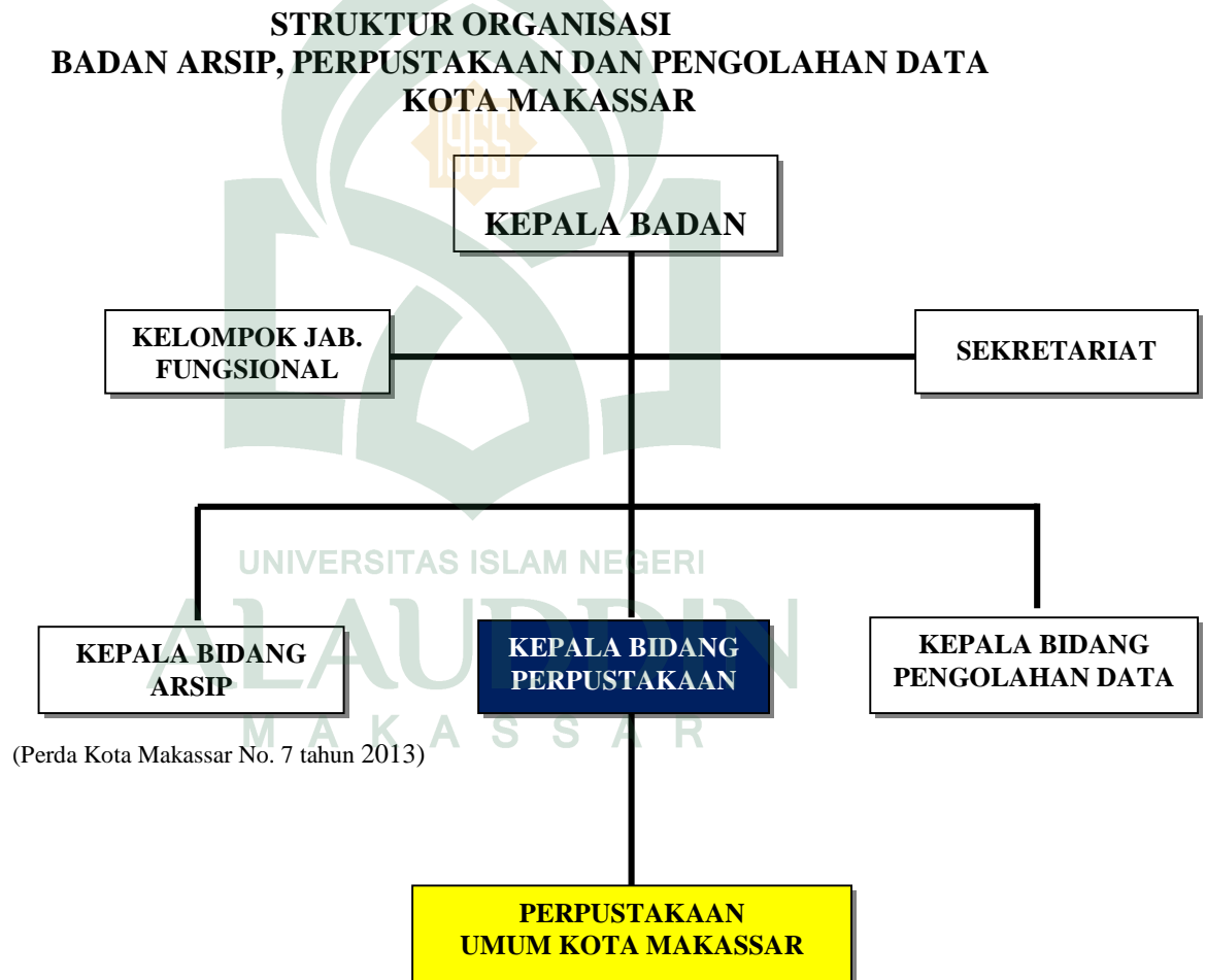
Gambar 2: Struktur organisasi perpustakaan umum kota Makassar (Badan Arsip, Perpustakaan dan Pengolahan Data)

Oleh karena perpustakaan umum unsur terpenting dalam menunjang kegiatan pendidikan, penelitian dan pengabdian pada masyarakat yang berada diluar lingkup masyarakat dan bertanggung jawab langsung pada kebutuhan masyarakat kota Makassar.