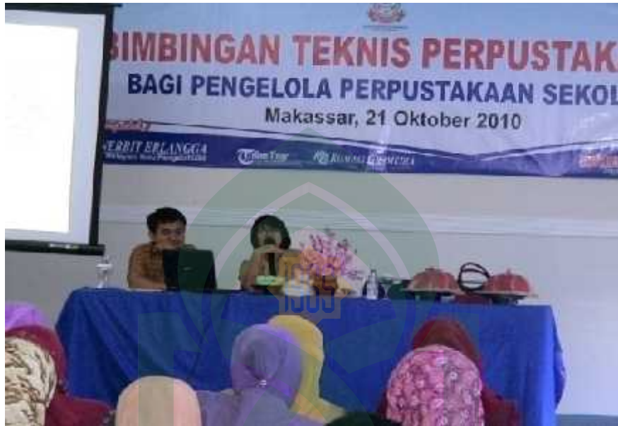
Gambar 5 Kegiatan Bimbingan Teknis Perpustakaan untuk Pengelola Perpustakaan Sekolah

Sumber data: Perpustakaan umum kota Makassar