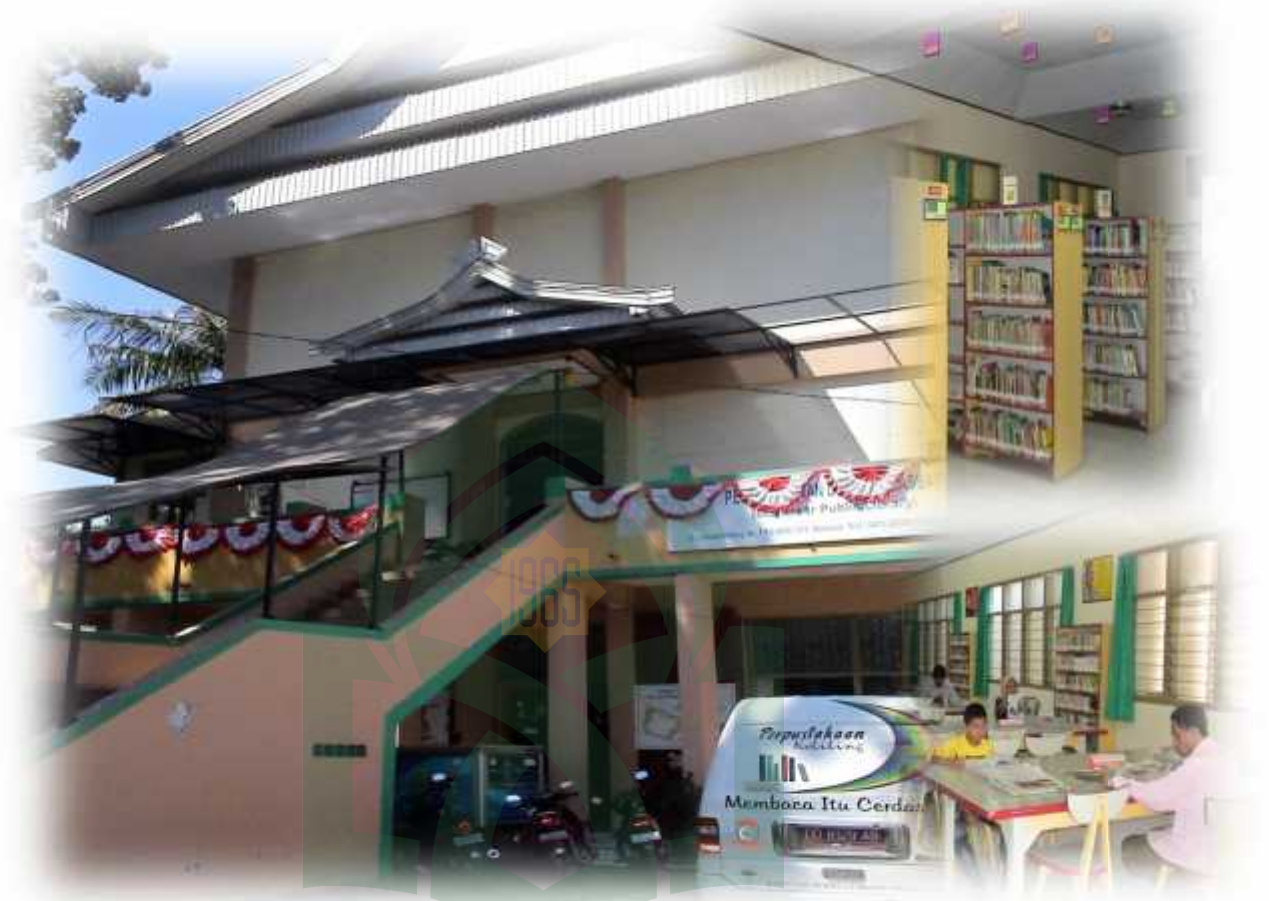
Gambar 1. Gedung Perpustakaan Umum Kota Makassar

Sejarah Singkat Badan Arsip, Perpustakaan dan Pengolahan Data Kota Makassar