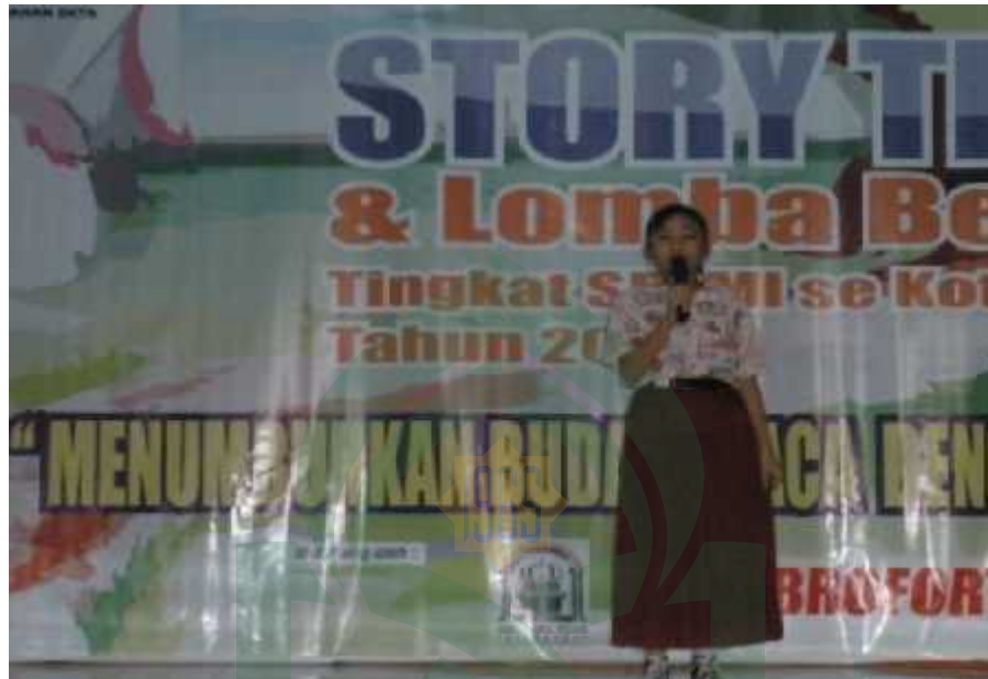
Gambar 1 Kegiatan Story Telling dan Lomba Membaca